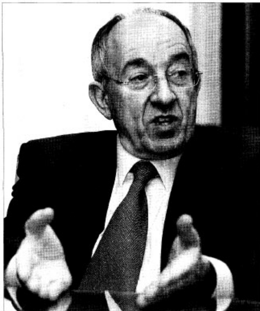
El secretario de Estado de Hacienda, Fernández Ordóñez, en un momento de la entrevista.

Respuesta: El Estado no se queda con menos. Las comunidades reciben ahora una cantidad en concepto de cesión de impuestos, más un fondo de suficiencia que se suma. Ahora, el total va a ser el mismo, lo que varía es que la composición entre participación en impuestos y transferencias se altera a favor de dar más peso a la participación en tributos. Ni el Estado ni las comunidades autónomas tienen más, o tienen menos, en el año cero de la reforma. De ahí en adelante, si el sistema se generaliza a todas, si que habrá un efecto, pero para las más dinámicas. Ahora, hay comunidades que están teniendo crecimientos muy importantes, como Murcia o como las del arco mediterráneo, lo que está afectando a sus necesidades de sanidad, de educación, de infraestructuras... y sin em-