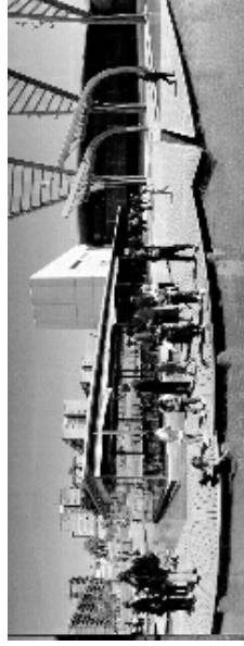
Restaurant del Fòrum Nord de la Tecnologia

El lliurament dels tercers Premis Francesc Layret tindrà lloc al restaurant del Fòrum Nord de la Tecnologia (Marie Curie s/n), el divendres, 24 de novembre, a les 21h.