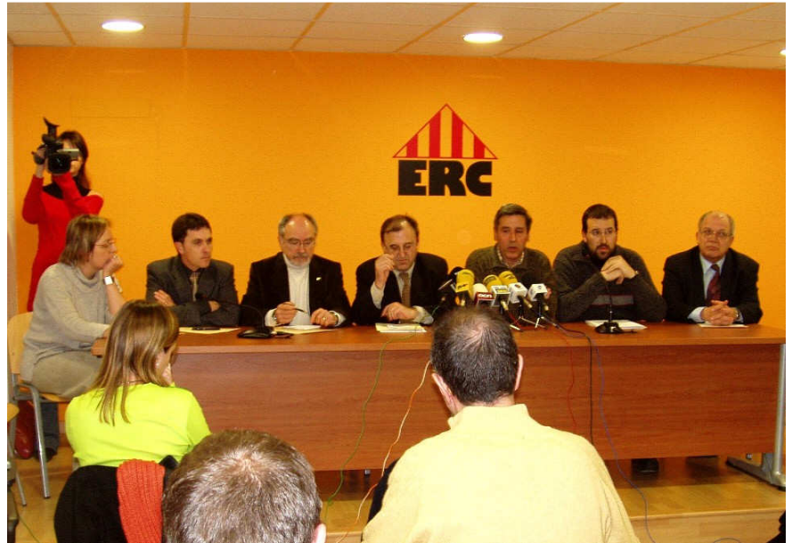
Representants d'ERC a totes les administracions de Lleida, units

ERC ha reiterat públicament la seva voluntat d'evitar la ruptura de la col·lecció del Museu Diocesà i que les obres surtin de Lleida. En un moment en el qual regna la confusió al voltant de quina és la voluntat real dels responsables de la Generalitat, els càrrecs electes d'ERC a les diferents institucions s'han manifestat clarament per la necessitat d'arribar a un acord polític amb l'Aragó sobre les 113 obres en litigi del Museu de