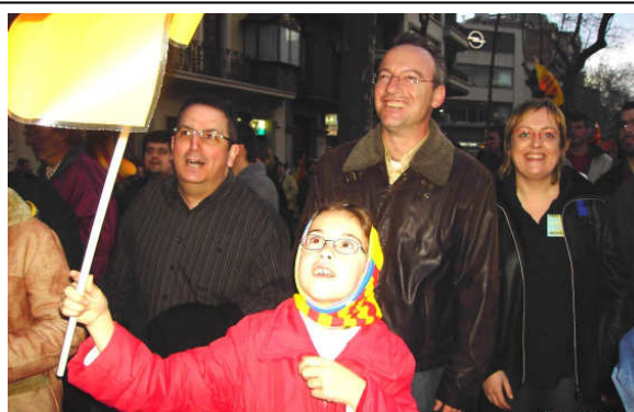
Els tres regidors d'ERC, durant la manifestació

La manifestació més gran dels darrers anys, convocada per una plataforma cívica formada per més de 600 entitats a la ciutat de Barcelona, va comptar amb una representació molt ben nodrida de militants i simpatitzants d'ERC a