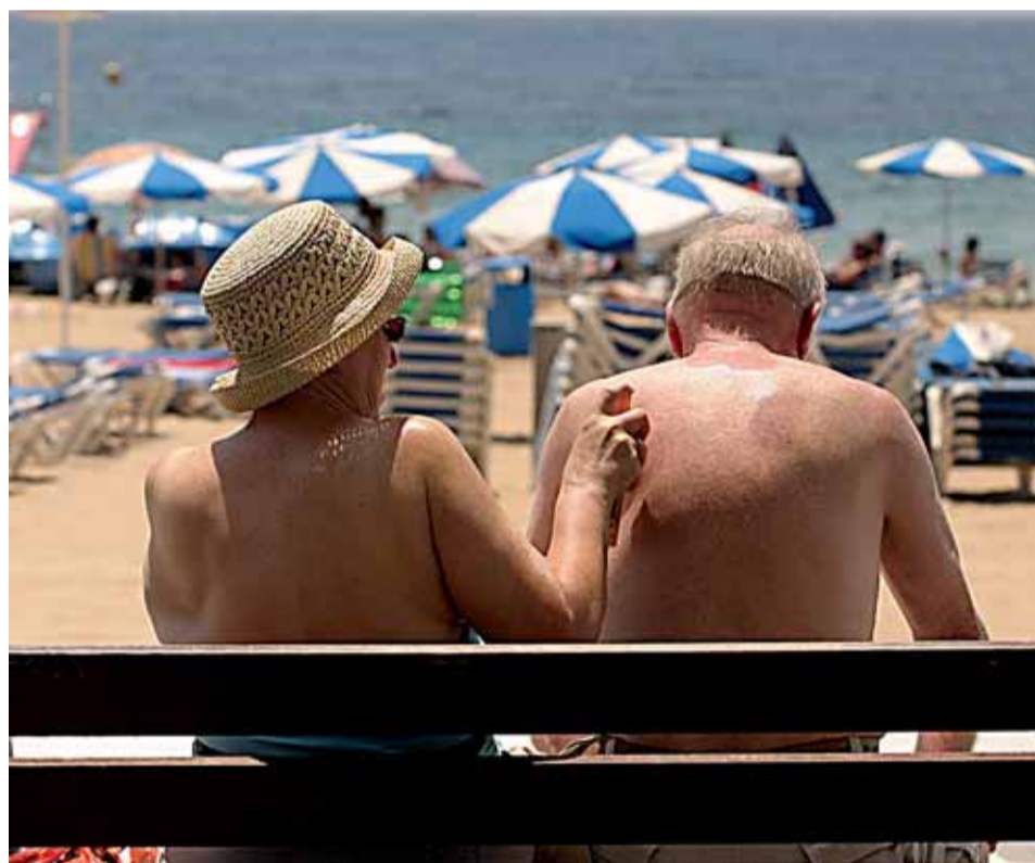
Una pareja de turistas se da crema solar junto a la playa de Benidorm.

El incremento de casos, según García Sáenz, oncólogo del Hospital Clínico de Madrid, puede atribuirse en par-