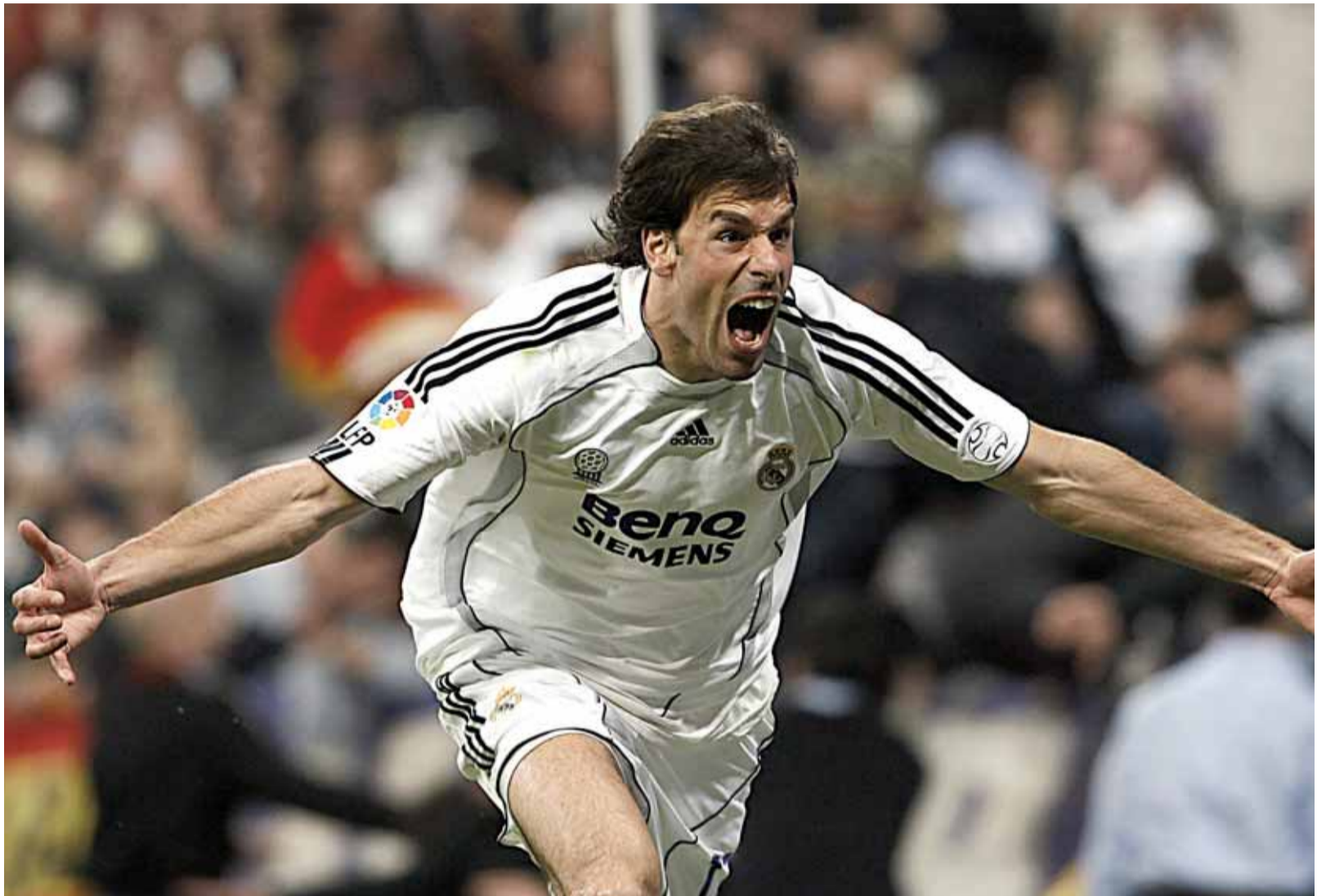
Ruud van Nistelrooy, delantero holandés del Real Madrid, celebra el primero de los dos goles que marcó ayer contra el Sevilla.

Protagonistas. Van Nistelrooy y Guti destruyeron las ansias del Sevilla