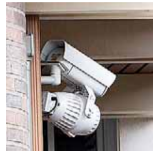
Una cámara de seguridad.

• Los propietarios de las viviendas ubicadas en los alrededores de Logroño son los principales solicitantes de este servicio. Página 3