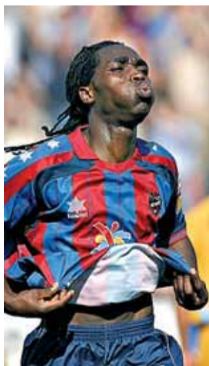
Riga, del Levante, ayer.

● La jornada no fue muy positiva para los equipos que luchan por eludir el descenso. Sólo ganó el Levante (2-0), que prácticamente sentenció al Nàstic, colista. El Celta (perdió 1-0 con el Villarreal) tampoco encuentra el remedio para solucionar sus males y ha perdido tres de los cuatro partidos que ha disputado con Hristo Stoichkov como entrenador. Sigue en zona de descenso. Salvado, de momento, está el Betis, que no acaba de garantizarse su continuidad en la máxima categoría. Ayer perdió ante el Getafe (0-2). El Athletic, en cambio, sumó un punto en Huelva (0-0).