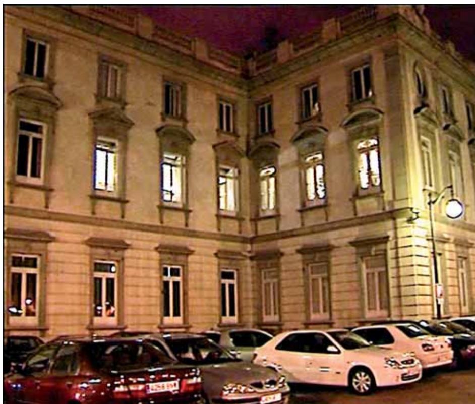
Sede del Tribunal Supremo, en la madrugada del domingo.