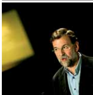
Rajoy, ayer en Sevilla.