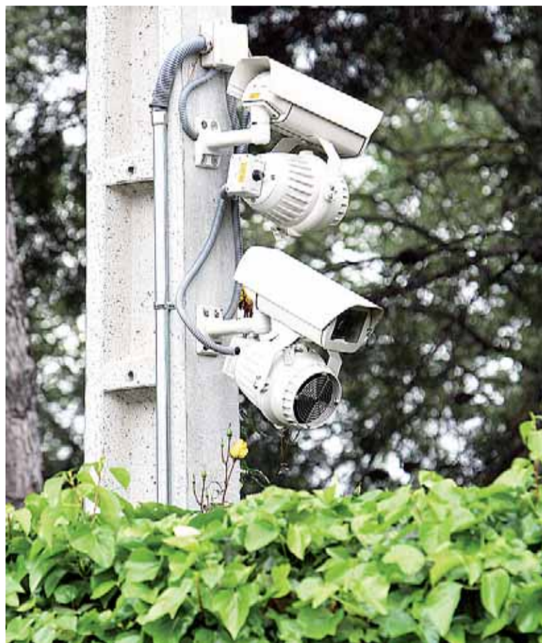
Viviendas unifamiliares equipadas con sistemas de seguridad. NACHO TORRA

Este modelo de delincuencia en domicilios, en muchos casos con los dueños en el interior, genera “muchísima inquietud. Ha aumentado la sensación subjetiva de inseguridad. Antes nos pedían sistemas de seguridad para proteger bienes y ahora, so-