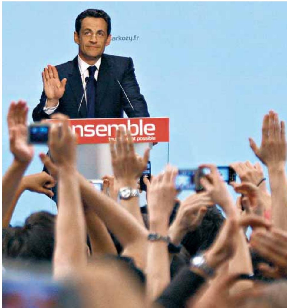
Sarkozy se dirige a sus seguidores tras conocerse los primeros resultados.

dado todo. Ahora se lo tengo que devolver”, se comprometió Sarkozy ante sus seguidores. El sucesor de Jacques Chirac dio las gracias a sus votantes y a su familia. Incluso sacó a relucir la humildad de la que sus críticos creen que no hace gala para afirmar que sentía “verdadero respeto” por Royal y sus ideas.