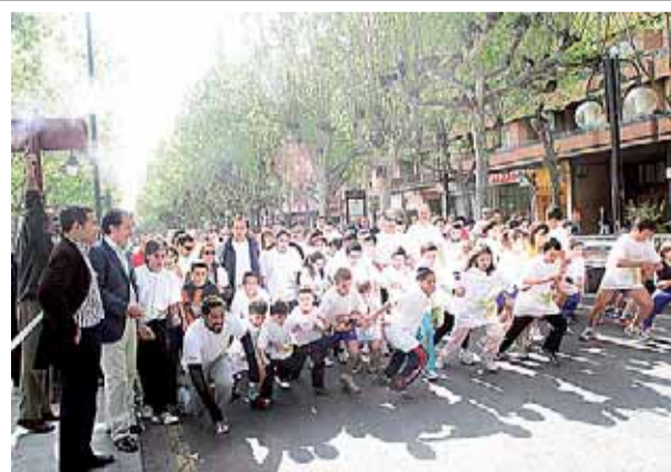
Carrera Popular del Día de Europa. Logroño acogió ayer la IV Carrera Popular del Día de Europa que partió de la plaza del Ayuntamiento con participantes de todas las edades.