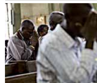
Rezoz por las víctimas, ayer.