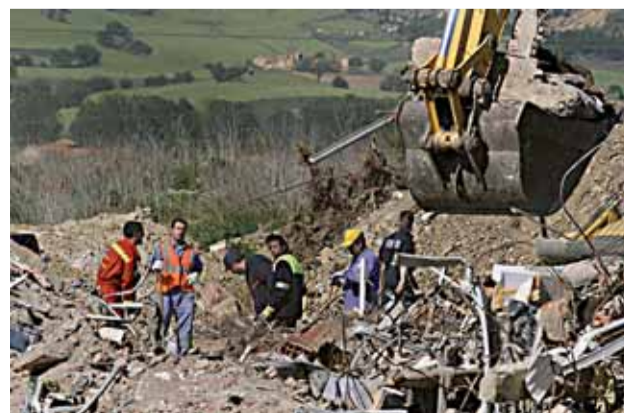
Búsqueda entre los escombros del edificio, ayer.

El subdelegado explicó que, tras el cotejo de las pruebas de ADN, entre los restos humanos muy fragmentados hallados en los últimos cuatro días y los datos obtenidos de los familiares de los desaparecidos, se ha constatado que pertenecen a la anciana y al joven, ambos vecinos del edificio número 4 de la calle Gaspar Arroyo, en el que se produjo la explosión y posterior derrumbe. AGENCIAS