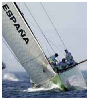
El Desafío Español, ayer.