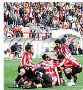
Celebran el gol.