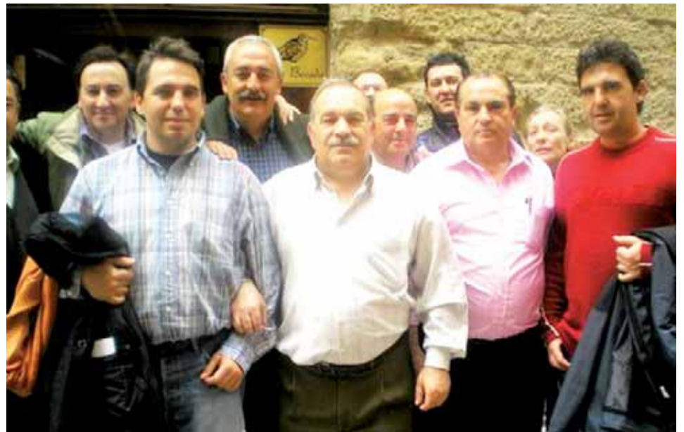
Miembros de las dos sociedades, en Logroño. ADN

Durante la jornada del sábado procedieron a la visita de una bodega de la Denominación de Origen Calificada Rioja, recorrieron el Casco Antiguo de la capital riojana, marco donde se emplaza actualmente la exposición 'La Rioja Tierra Abierta, Log 2007' y como no podía ser de otra forma, compartieron una comida de hermandad en La Becada.