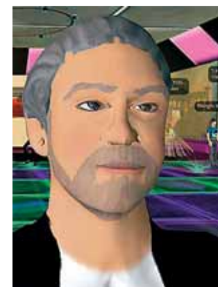
Imagen virtual de Llamazares.

A través de esta realidad virtual, Gaspar Llamazares, como se ha bautizado en Second Life, explicará las iniciativas de IU para las próximas elecciones del 27 de mayo. Todo bajo el epígrafe explícito y electoral de Tengo una respuesta para ti . De esta forma, los internautas con vida en el juego virtual podrán preguntar e interactuar con el líder de los comunistas. M.R.