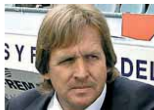
Bernd Schuster GETAFE

↑ El Getafe se ha consolidado en Primera con Bernd Schuster. Y, por primera vez, sueña con Europa. Con la UEFA. Su temporada es muy meritoria tanto en la Liga como en la Copa del Rey, competición en la que ha alcanzado las semifinales. El equipo azul triunfa, además, con un fútbol atractivo.