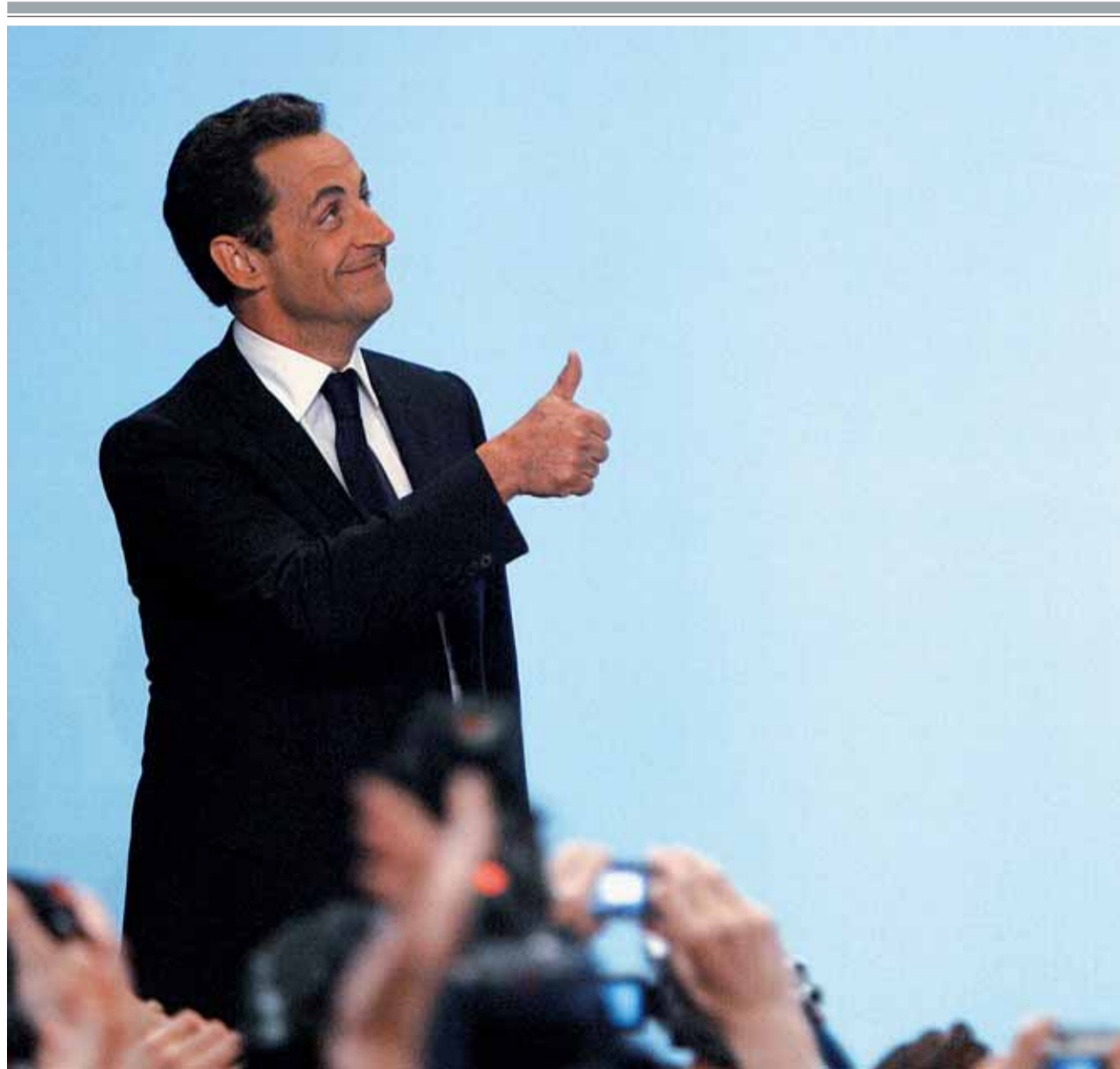
El candidato de la Unión por un Movimiento Popular tras el anuncio oficioso de su victoria, ayer en París.