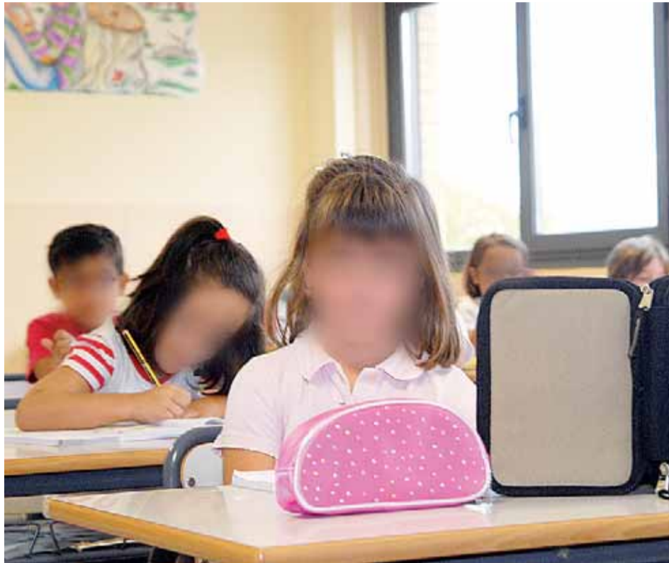
La propuesta quiere mejorar el marco legal de la disciplina escolar. NACHO TORRA

FALTOS DE COMPETENCIAS Según afirma la organización sindical, el profesorado está