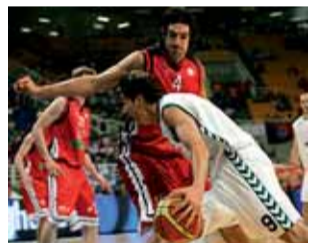
Scola defiende a Welsch, ayer.

RALLY. El francés de Citroën ganó ayer el Rally de Argentina, sexta prueba del Mundial, con un tiempo de 4 horas y 52 segundos. Loeb, campeón del mundo, se impuso a los finlandeses de Ford Marcus Gronholm, segundo, y Mikko Hirvonen, tercero, y sigue líder. Tiene tres puntos más que Gronholm. Sordo acabó sexto.