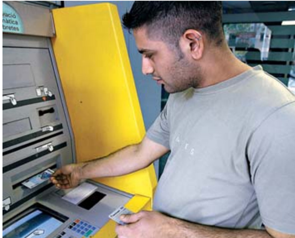
Un hombre de origen indio saca dinero de un cajero en Barcelona. FRANCESC SANS

En Europa, el fenómeno acaba de empezar. Hasta hace pocos años ningún banco islámico tenía sede propia en el viejo continente. Entonces existían las llamadas ventanillas islámicas de los grandes bancos europeos, que en los setenta descubrieron un filón en las grandes fortunas de los musulmanes afincados en Europa y empezaron a ofrecer servicios que respetaban la sharia . Hoy en día, grandes bancos como Lloyd's Bank,