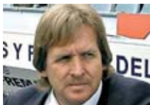
Bernd Schuster GETAFE

↑ El Getafe se ha consolidado en Primera con Bernd Schuster. Y, por primera vez, sueña con Europa. Con la UEFA. Su temporada es muy meritoria tanto en la Liga como en la Copa del Rey, competición en la que ha alcanzado las semifinales. El equipo azul triunfa, además, con un fútbol atractivo.