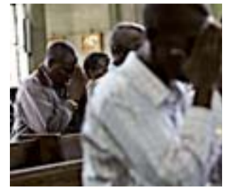
Rezoz por las víctimas, ayer.