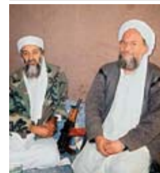
Al Zawahiri, en 2001.

● Las autoridades francesas en España aprendieron la lección. Tras las largas colas para votar en los consulados en la primera vuelta, la jornada de ayer fue más fluida. Las dos horas de espera de hace dos semanas se convirtieron en apenas media hora. El consulado de Madrid instaló dos mesas electorales más y amplió las cuatro existentes. Los electores también lo tuvieron más fácil: sólo había que escoger entre dos papeletas –frente a 12 en la primera vuelta. Y del consulado al Novotel madrileño, donde los seguidores de Nicolas Sarkozy celebraron la victoria del candidato conservador.