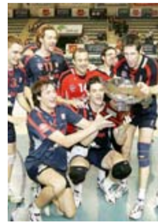
Los jugadores, con la copa.

Poco tardó el Drac Palma CV Pòrtol en confirmar su dominio. La tímida presión inicial del Unicaja Arukasur se dilu-