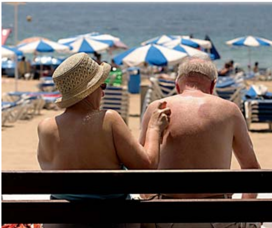
Una pareja de turistas se da crema solar junto a la playa de Benidorm.

El incremento de casos, según García Sáenz, oncólogo del Hospital Clínico de Madrid, puede atribuirse en par-