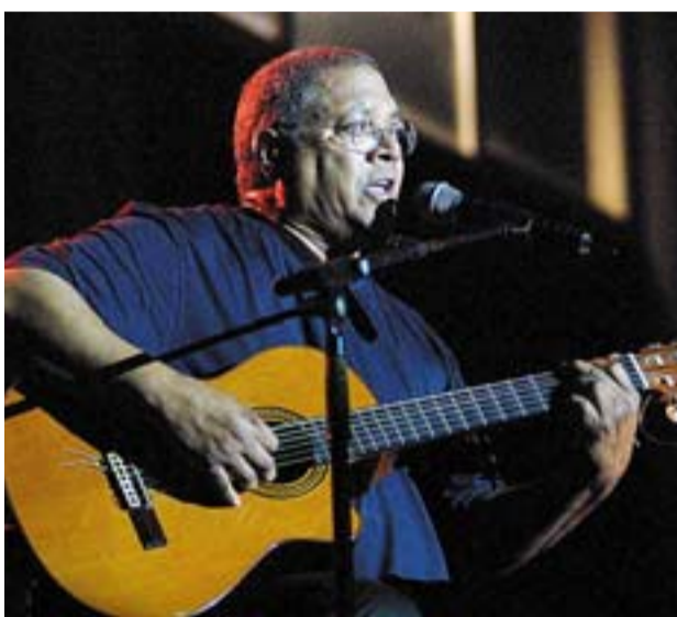
Pablo Milanés en su actuación en Calvià en 2004.