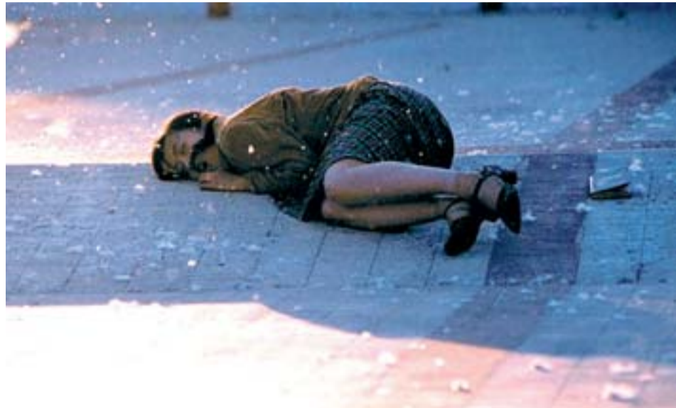
Fotograma del filme ganador del BAFF 2007, 'Summer Palace' del chino Lou Ye.

No es baladí que este año fuera el país invitado. El tributo sirvió para repasar la filmografía de las últimas dos generaciones de sus cineastas: desde Sorgo rojo , de Zhang Yimou -quien acaba de estrenar La maldición de la flor dorada- , y Tierra amarilla de Chen Kaige, dos ejemplos de