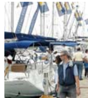
El XXIV Salón Náutico. J. PÉREZ