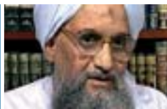
Ayman Al Zawahiri "NÚMERO DOS" DE AL QAEDA

«INVITO A BUSH A UN VASO DE ZUMO EN LA CAFETERÍA DEL PARLAMENTO IRAQUÍ, EN BAGDAD» • Internacional Pág. 8