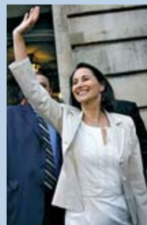
Royal, tras aceptar su derrota.

“Voy a retirarme, después de esto mi candidatura está fuera de lugar”, afirmó Gul.