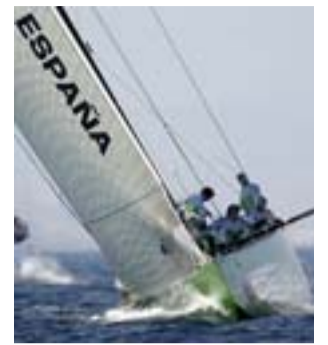
El Desafío Español, ayer.