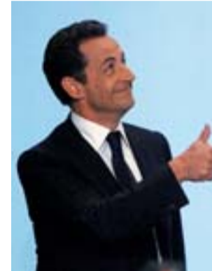
El candidato conservador.