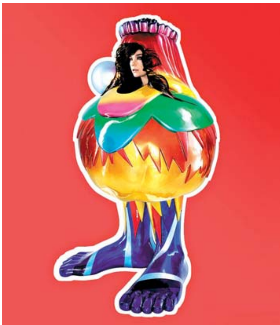
La cantante islandesa Björk en una de las ácidas y coloridas imágenes promocionales de 'Volta'.

Para resarcirse de la densidad de su anterior disco ( Medulla , 2004) ha colaborado con Timbaland -productor estrella del R&B y el hip-hop americano- y Antony Hegarty -de Anthony & the Johnsons-.