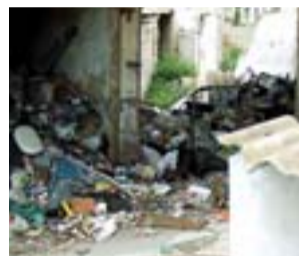
Residuos junto a la 'cocina'.