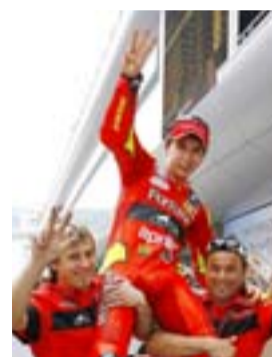
Jorge Lorenzo, ayer.