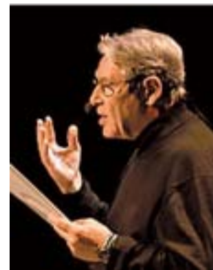
El actor Jordi Dauder.