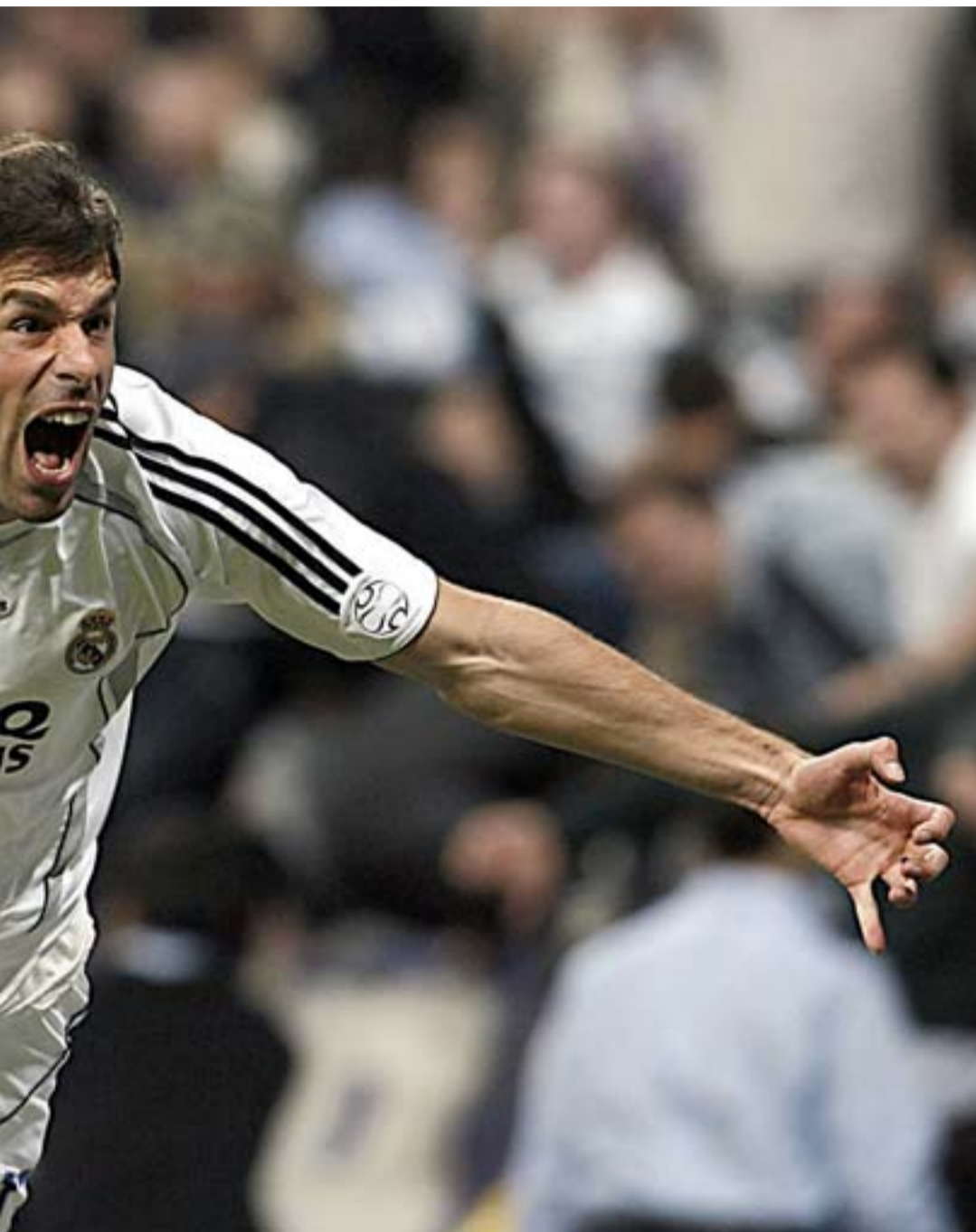
contra el Sevilla, en el estadio Santiago Bernabéu.