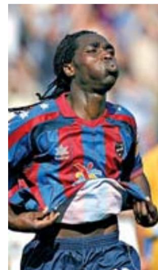
Riga, del Levante, ayer.

● La jornada no fue muy positiva para los equipos que luchan por eludir el descenso. Sólo ganó el Levante (2-0), que prácticamente sentenció al Nàstic, colista. El Celta (perdió 1-0 con el Villarreal) tampoco encuentra el remedio para solucionar sus males y ha perdido tres de los cuatro partidos que ha disputado con Hristo Stoichkov como entrenador. Sigue en zona de descenso. Salvado, de momento, está el Betis, que no acaba de garantizarse su continuidad en la máxima categoría. Ayer perdió ante el Getafe (0-2). El Athletic, en cambio, sumó un punto en Huelva (0-0).