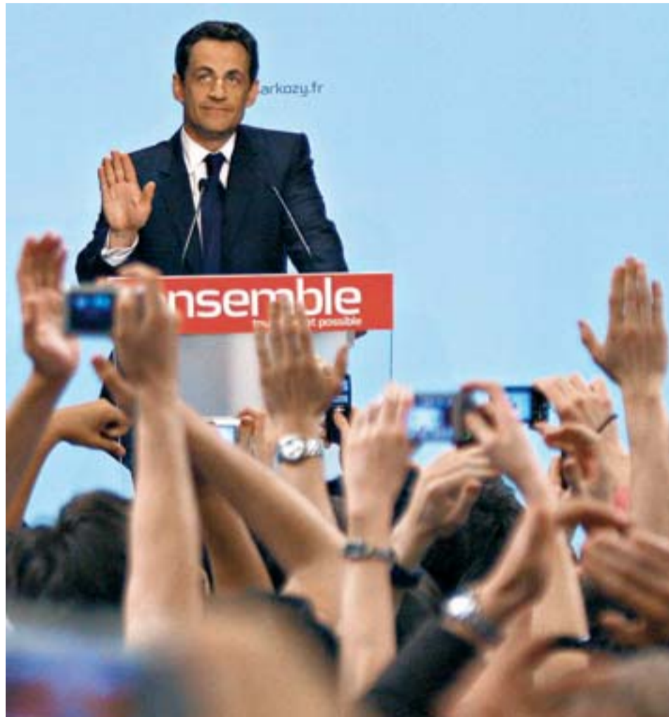
Sarkozy se dirige a sus seguidores tras conocerse los primeros resultados.

“Les devolveré a los franceses el orgullo de ser franceses. Acabaré con los arrepentimientos”, aseguró, aludiendo a la identidad nacional, una idea que ha si-