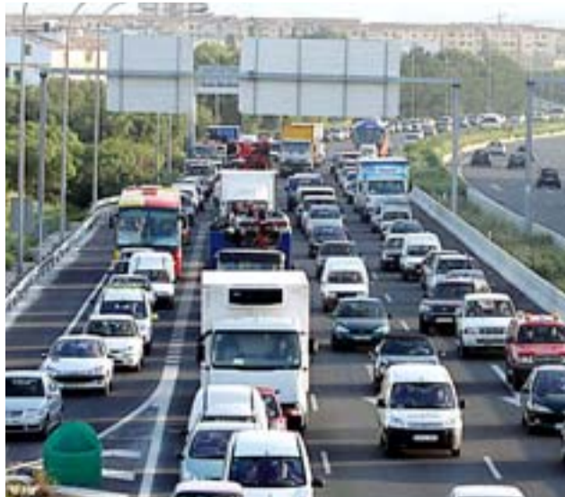
Instantánea de un atasco en la autovía Palma-Sa Pobra.

La buena climatología contribuyó sin duda a que las pequeñas retenciones que se vienen registrando en la carretera (con motivo de las obras de