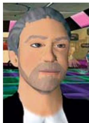
Imagen virtual de Llamazares.

A través de esta realidad virtual, Gaspar Llamazares, como se ha bautizado en Second Life, explicará las iniciativas de IU para las próximas elecciones del 27 de mayo. Todo bajo el epígrafe explícito y electoral de Tengo una respuesta para ti . De esta forma, los internautas con vida en el juego virtual podrán preguntar e interactuar con el líder de los comunistas. M.R.