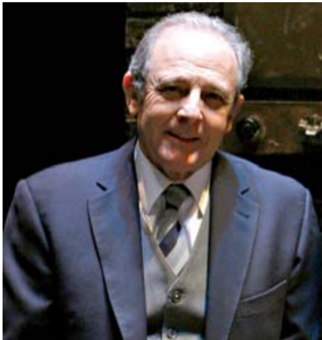
Emilio Gutiérrez Caba, uno de los protagonistas.