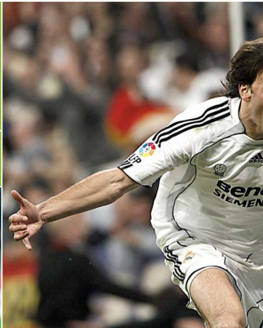
Ruud van Nistelrooy, delantero holandés del Real Madrid, celebra el primero de los dos goles que marcó ayer.