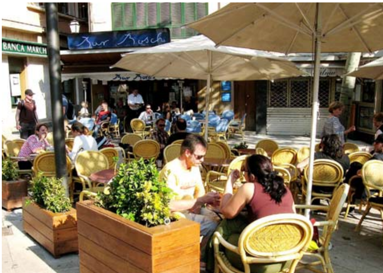
El Bar Bosch, uno de los establecimientos clásicos de Palma, está entre los destacados del 'blog' Cafeymas. S.L.L.