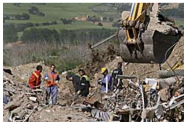
Búsqueda entre los escombros del edificio, ayer.

El subdelegado explicó que, tras el cotejo de las pruebas de ADN, entre los restos humanos muy fragmentados hallados en los últimos cuatro días y los datos obtenidos de los familiares de los desaparecidos, se ha constatado que pertenecen a la anciana y al joven, ambos vecinos del edificio número 4 de la calle Gaspar Arroyo, en el que se produjo la explosión y posterior derrumbe. AGENCIAS