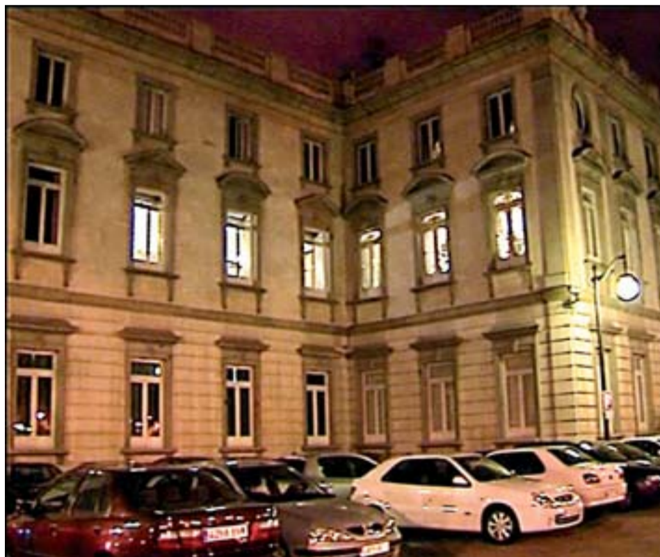
Sede del Tribunal Supremo, en la madrugada del domingo.

Sin embargo, los jueces lanzan en sus conclusiones un pequeña reprimenda jurídica al Gobierno y recuerdan que ante la hipótesis de que un partido político presente candidaturas con el ánimo de suceder a otro ilegalizado, la ley prevé una única salida: instar a su ilegalización.