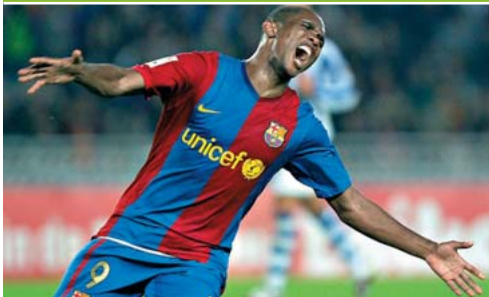
Eto'o celebra su gol ante la Real, el segundo del Barça, el sábado en Anoeta.

El Madrid vence al Sevilla (3-2) e intensifica su acoso al Barça, líder con sólo dos puntos de ventaja a cinco jornadas para el final