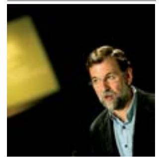
Rajoy, ayer en Sevilla.