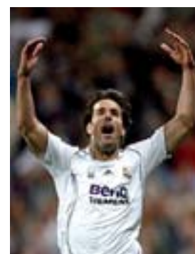
Van Nistelrooy, ayer.