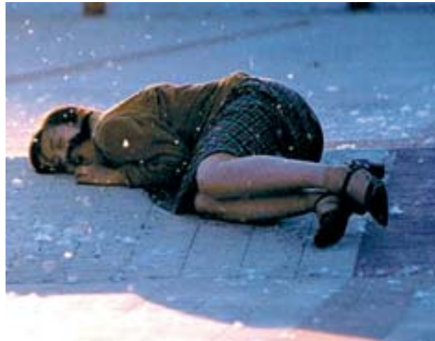
Fotograma del filme ganador 'Summer Palace' de Lou Ye.

No es baladí que este año fuera el país invitado. El tributo sirvió para repasar la filmografía de las últimas dos generaciones de sus cineastas: desde Sorgo rojo , de Zhang Yimou -quien acaba de estrenar La maldición de la flor dorada- , y Tierra amarilla de Chen Kaige, dos ejemplos de la llamada quinta generación, a Pickpocket , del venerado por la crítica Jia Zhangke, de quien también se pudo ver,