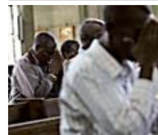
Rezoz por las víctimas, ayer.