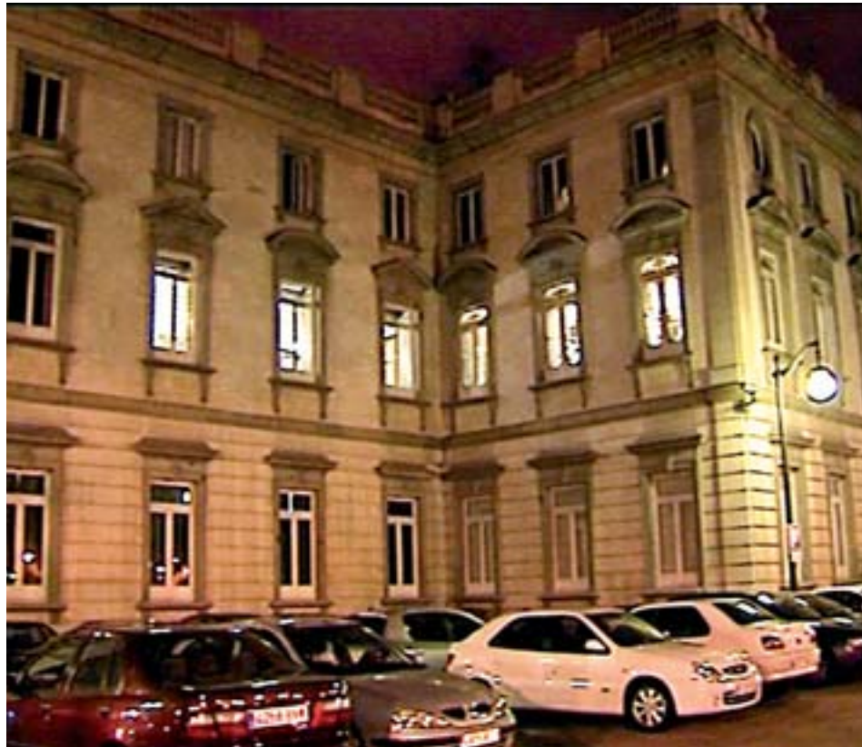
Sede del Tribunal Supremo, en la madrugada del domingo.

Finalmente, el fallo estima las impugnaciones presentadas por la Abogacía y la Fiscalía contra ANV, 133 listas de las 256 inscritas, al entender que