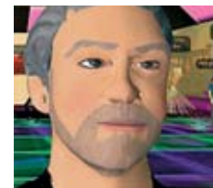
El Gaspar Llamazares virtual.

● En la red cabe todo, incluso la propaganda electoral. Lo ha visto claro el coordinador general de Izquierda Unida (IU), Gaspar Llamazares, quien consciente de las posibilidades y los nuevos lenguajes de internet, acaba de estrenar su doble en Second Life, un juego virtual que recrea un mundo paralelo. De momento es el