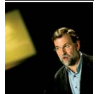
Rajoy, ayer en Sevilla.