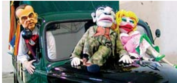
Marionetas de Axioma Teatre, compañía participante en Titirimundi.