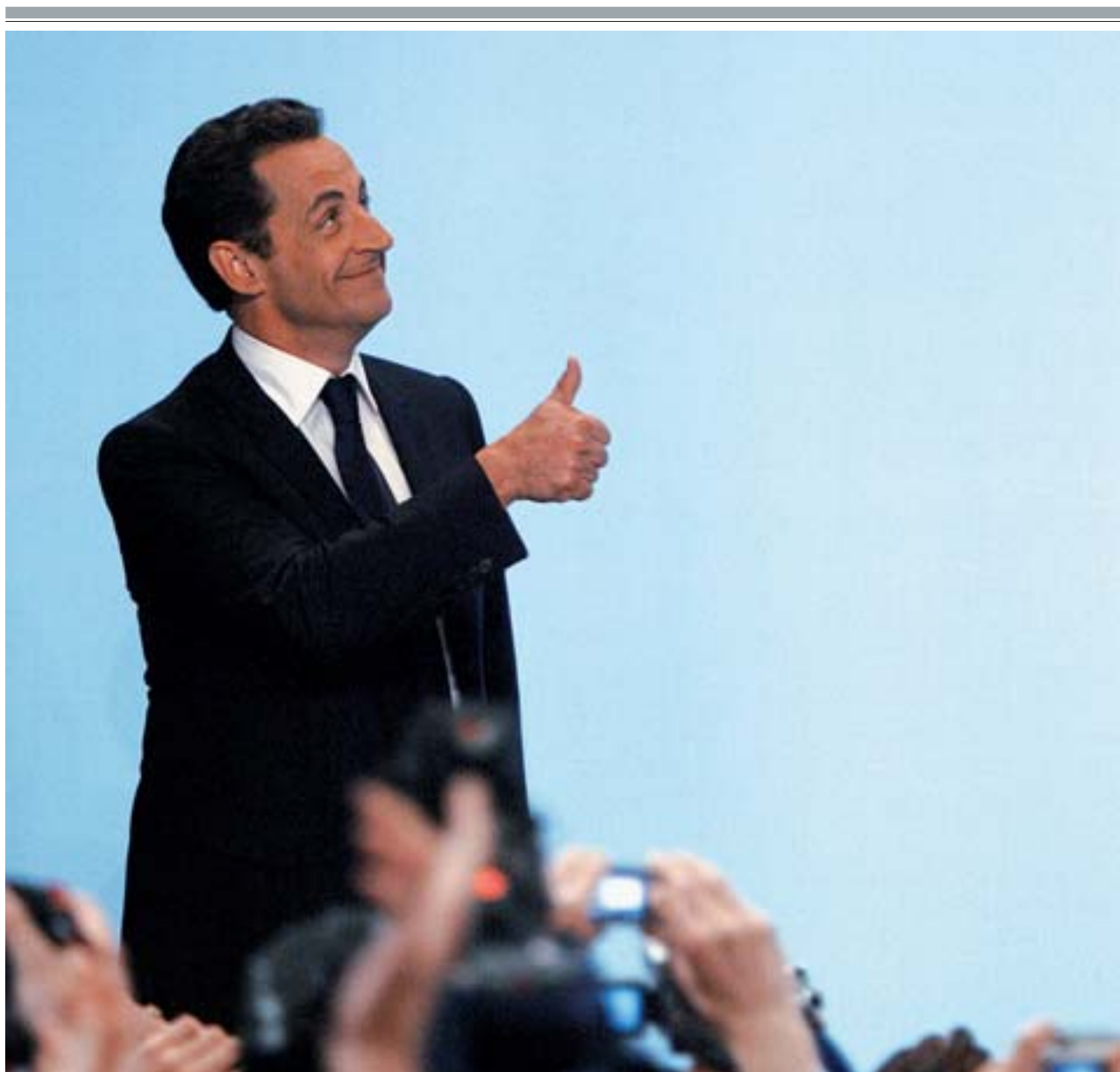
El candidato de la Unión por un Movimiento Popular tras el anuncio oficioso de su victoria, ayer en París.

Los casos de cáncer de piel aumentan un 11% en cinco años por falta de prevención • Página 13