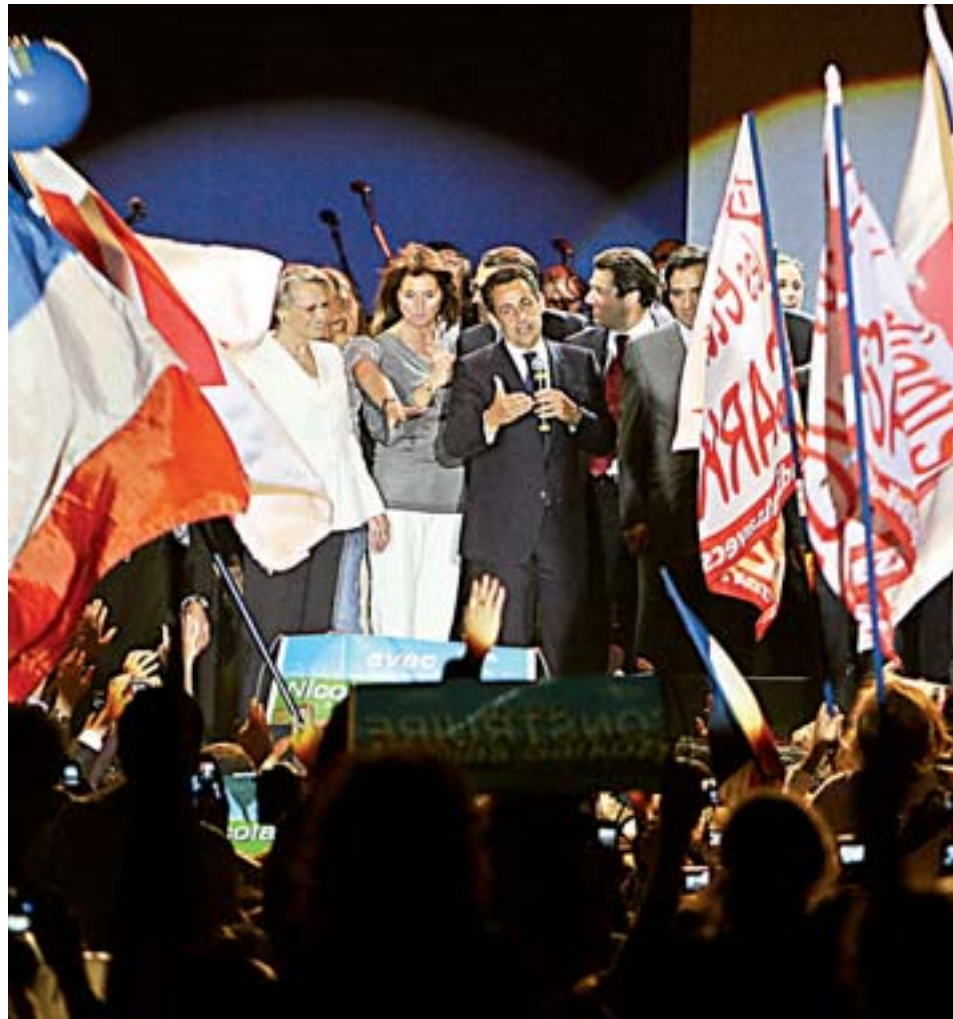
Sarkozy se dirige a sus seguidores en la Plaza de la Concordia en París.

“Amo a Francia, que me lo ha dado todo. Ahora se lo tengo que devolver”, dijo Sarkozy ante unos 10.000 seguidores concentrados en la Plaza de la Concordia parisina. Antes de entonar el himno nacional de La Marsellesa ,