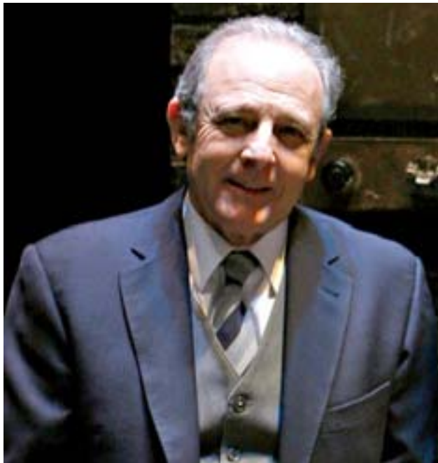
Emilio Gutiérrez Caba, uno de los protagonistas.

La chispa que desencadena toda la historia es la trágica muerte de Clara, una famosa diseñadora. Este hecho desata los deseos de venganza de dos mujeres que son amigas a pesar de que no se ven desde hace 18 años: su hermana Patricia, interpretada por María Adán, y An-