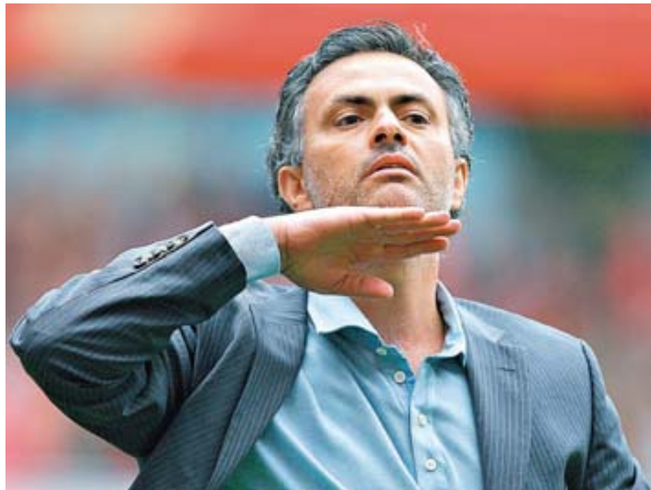
José Mourinho, técnico del Chelsea, gesticula ante su afición ayer.

José Mourinho, técnico del Chelsea, acabó otra vez frustrado, abrazándose a sus ju-