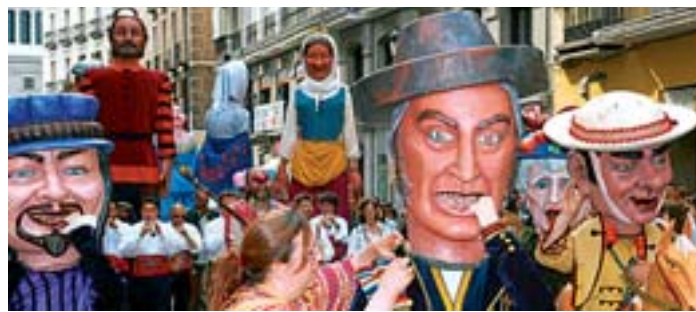
Cabezudos desfilando en el pasacalles de San Isidro 2006.