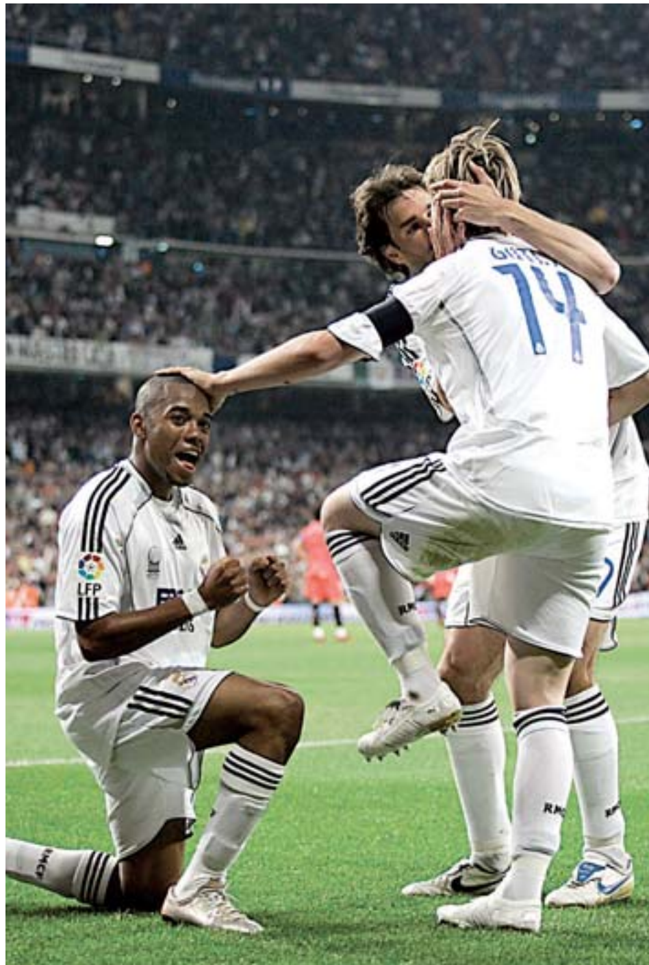
Robinho y Van Nistelrooy celebran con Guti el gol del brasileño, ayer en Madrid.

● Ha firmado 20 goles y está en racha. Ruud Van Nistelrooy está convencido de que si acaba como Pichichi, el Real Madrid ganará la Liga. Tras los dos tantos de ayer, el holandés encabeza la clasificación con uno de ventaja sobre Kanouté (Sevilla) y Diego Milito (Zaragoza).