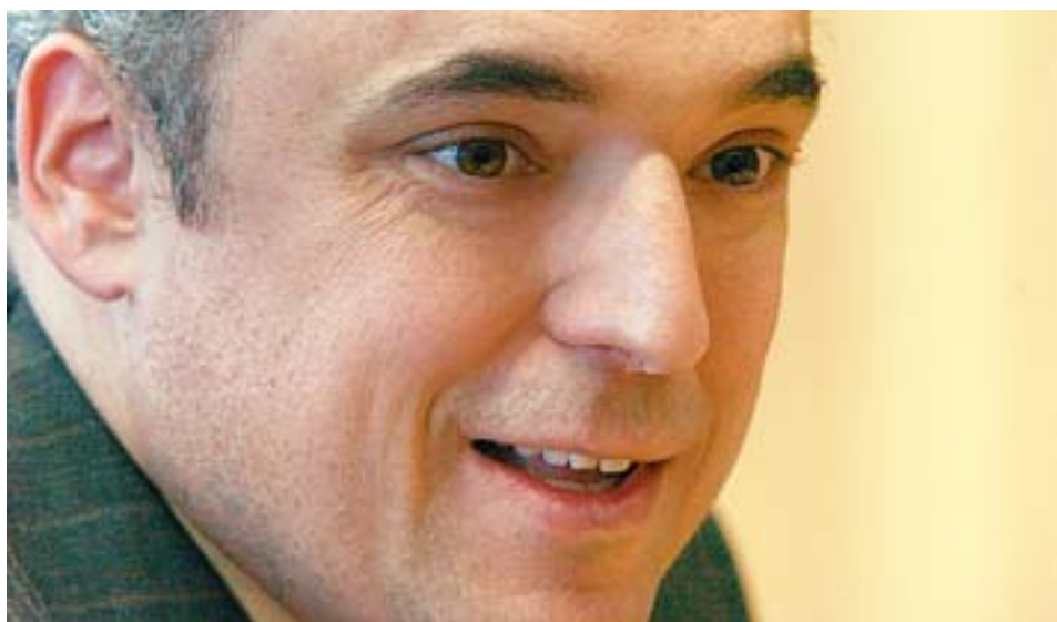
El candidato socialista a la Comunidad en su despacho de la Asamblea de Madrid. S. CH.