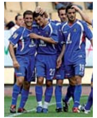
Celebración del segundo gol.