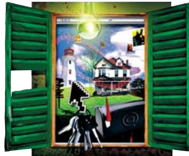
ILUSTRACIÓN: CARLOS SUÑÉ

La historia de Facebook demuestra su éxito: creada en el año 2004 por un estudiante de Harvard, Mark Zuckerberg, en tres años ha logrado pasar de ser una simple web para estudiantes a recibir ofertas de compra por parte de todos los gigantes mediáticos del mundo. Que se sepa, ya ha rechazado ofertas de News Corp, el conglomerado de empresas que compró MySpace, y Viacom, ma-