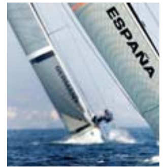
El Desafío Español, ayer.

VELA. El Desafío Español acaricia las semifinales de la Copa del América tras imponerse ayer al United Team Germany. El proyecto más ambicioso y caro de la vela española está a punto de cumplir su objetivo: clasificarse entre los cuatro primeros de la Copa Louis Vuitton, de la que saldrá el equipo que le dispute el título al campeón, el suizo Alinghi, a partir del 1 de junio.