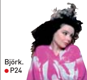
Björk. ● P24