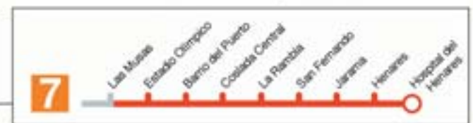
Las nuevas estaciones son accesibles para personas con movilidad reducida

Las ocho estaciones de la nueva Línea 7 Metroeste darán servicio a 120.000 viajeros diarios. El nuevo tramo integra en la red de Metro los municipios de Coslada y San Fernando de Henares, así como el entorno del estadio de La Peineta. La inversión realizada en la obra alcanza los 645,3 millones de euros