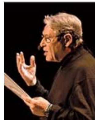
El actor Jordi Dauder.