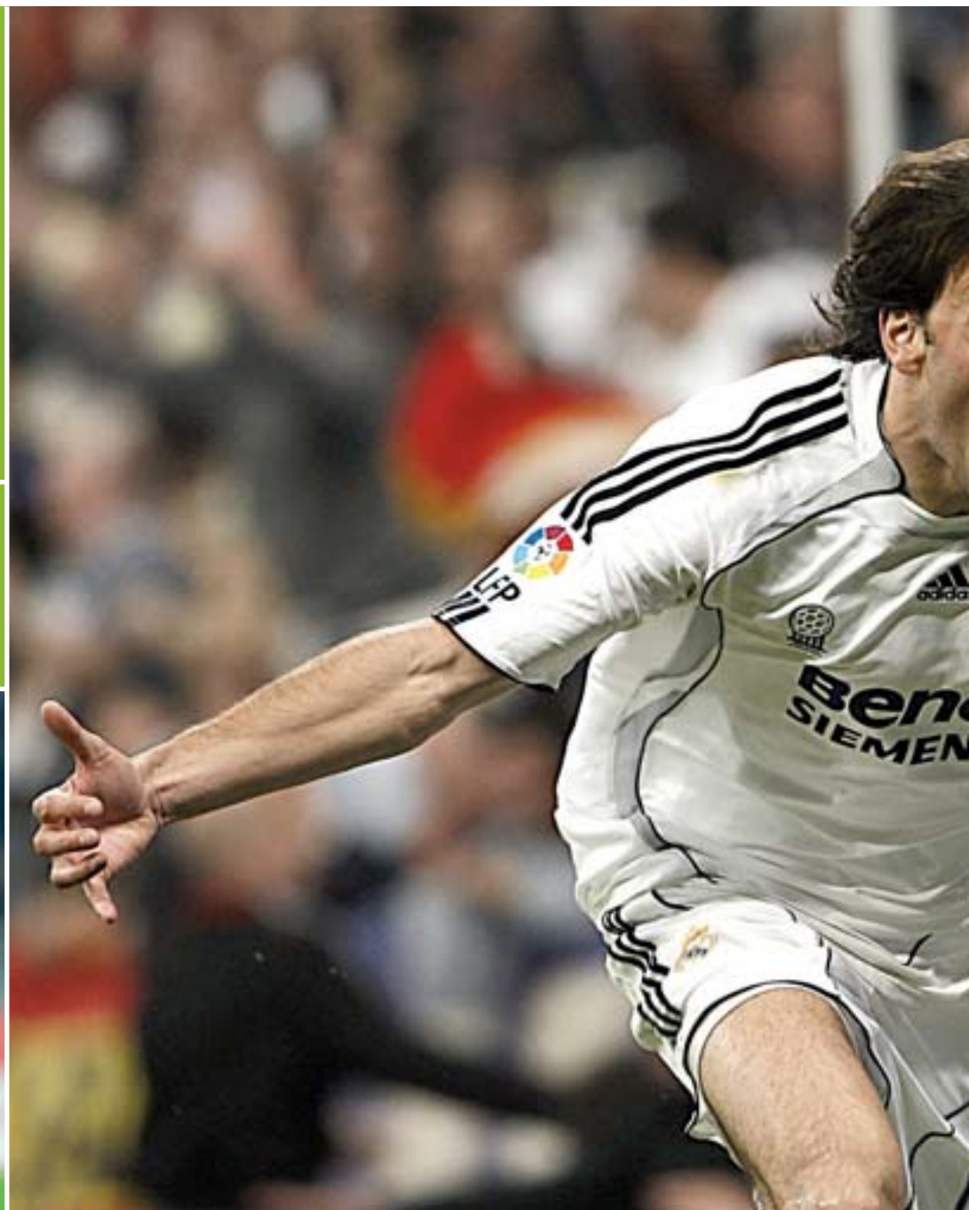
Ruud van Nistelrooy, delantero holandés del Real Madrid, celebra el primero de los dos goles que marcó ayer.