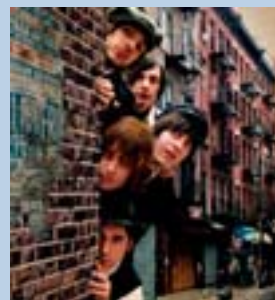
El grupo madrileño Seine.

● El viernes 15, los diez finalistas del Trofeo de Rock Villa de Madrid se jugarán el primer puesto en Universimad, el festival que acogerá el Paraninfo de la Universidad Complutense. Los aspirantes compartirán las tablas con artistas consagrados, como el gallego Deluxe (que abrirá el cartel a mediodía) o Kiko Veneno, que rematará la noche a las diez.