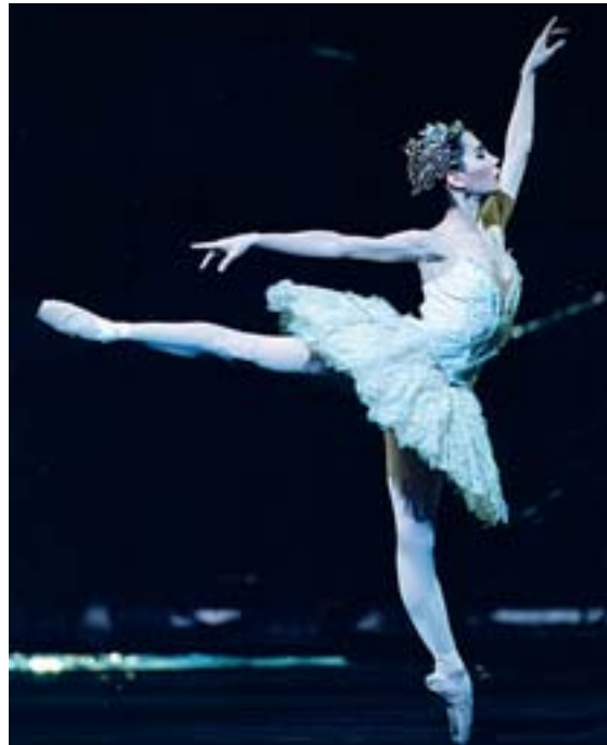
La bailarina Tamara Rojo en 'El lago de los cisnes'.

● San Isidro vuelve, y más fuerte que nunca con espectáculos de calle, títeres, zarzuela, ballet, fuegos artificiales y un presupuesto un 40% superior. La fiesta cuenta con un millón de euros más que el año pasado, en total 2,5 millones. Las fiestas más chulescas, con el lema de Madrid, ciudad para la convivencia , arrancan el miércoles. Sólo falta ponerse la parrusa (gorra típica), el mantón de manila y el clavel rojo en la solapa. Entonces, San Isidro habrá comenzado.