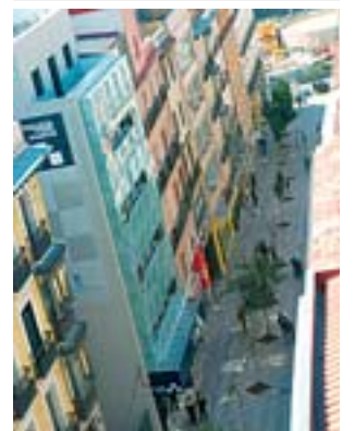
Comisaría de Montera. S. CH.

El Ayuntamiento aumenta en un 40% el presupuesto de la celebración patronal