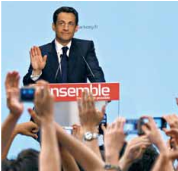
Sarkozy, tras conocerse los primeros resultados.

Los sondeos durante la campaña y a pie de urna no fallaron y Nicolas Sarkozy se convirtió en el nuevo presidente de Francia. Con el 75,22% de los votos escrutados, un 53,30% eligió la pa-