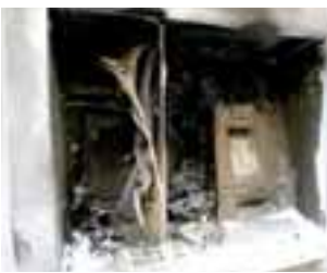
El aspecto del cajero, ayer.