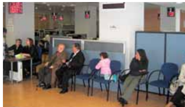
Unas 600 personas acudieron el viernes a las oficinas. J.M