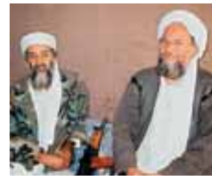
Al Zawahiri, en 2001.

Según los analistas, la elección de Sarkozy confirma la derechización de Francia.