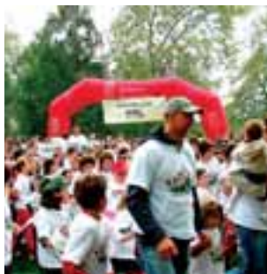
Imagen de la carrera.

Pamplona ● En el mundo, 852 millones de personas pasan hambre. De ellos, 300 millones son niños. Otros 1.000 millones sobreviven con menos de 1$ al día y 1.100 millones no tienen acceso a agua potable. Éstos son sólo algunos datos que se recordaron ayer en la ‘Carrera contra el Hambre’, donde participaron más de 500 niños