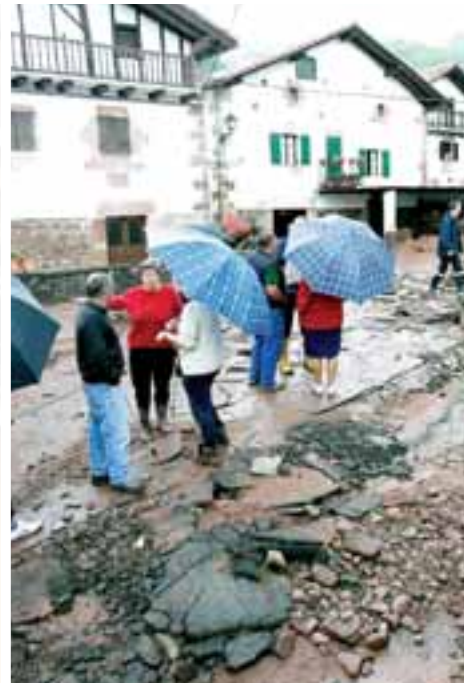
Los efectos de la lluvia se dejaron notar en las calles y en las propias viviendas.