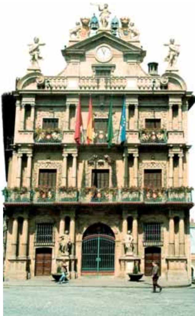
Fachada del Ayuntamiento, sede del Gobierno local.

Durante esta semana, presentamos a los candidatos a la Alcaldía de la ciudad con representación actual en el equipo de Gobierno y a los partidos minoritarios que también concurren a los comicios.