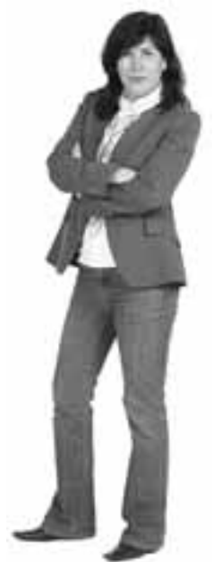
Uxue Barkos. Iruñeko alkategaia. Candidata a la alcaldía de Pamplona.