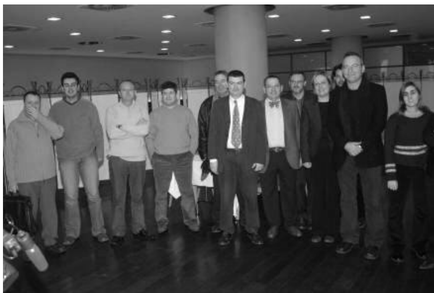
Els membres del Grup Municipal van felicitar l'Any Nou als representants dels mitjans de comunicació

Més enllà de la discussió sobre xifres i percentatges concrets, el que ha estat significatiu ha estat el dur procés d'elaboració, ja que partíem d'una proposta de reducció global de l'onze per cent de les partides de gestió. Després de llargues i dures negociacions, el Pressupost final manté l'equilibri entre la possibilitat de fer front els compromisos anteriors sense limitar la capacitat d'endegar noves accions polítiques, molt especialment en les àrees de gestió directa d'ERC.