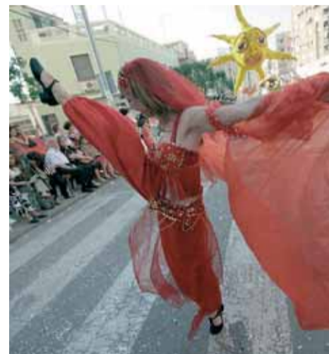
Imagen del Pregón, el sábado.