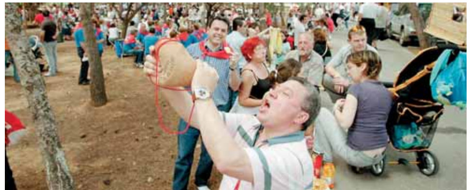
Un romero combate el calor en el ermitorio con un buen trago de vino. CARMERIPOLLÈS

Así, al son de "yo soy esa, la que me llevo los billetes y nadie se entera...", una Pantoja muy 'masculina' paseaba del brazo de su Julián ajena a sus disputas judiciales. Y es que, como bien dicen, en fiestas todo vale.