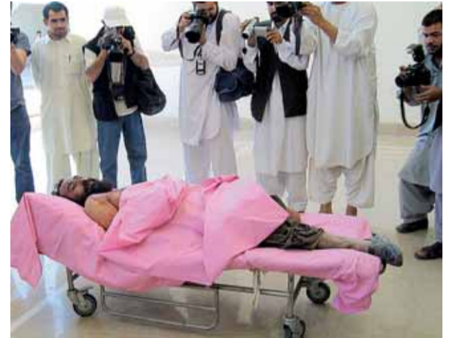
Reporteros afganos fotografían el cadáver de Dadullah

rece a Dadullah. El militar talibán había perdido una pierna en un combate anterior. El supuesto cadáver fue trasladado a Kandahar. Según el gobernador de la ciudad, el cuerpo se enviará hoy a Kabul.