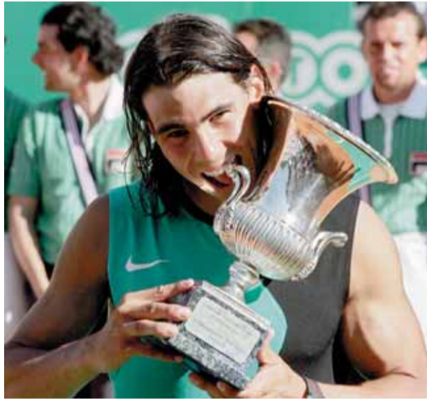
Nadal muerde la copa del ganador.

Pero, a diferencia del sábado, Nadal jugó ayer ante González más agresivo, con golpes más largos y más metido en pista. Y, sobre todo, estuvo mejor a la hora de meter sus primeros servicios, no ce-