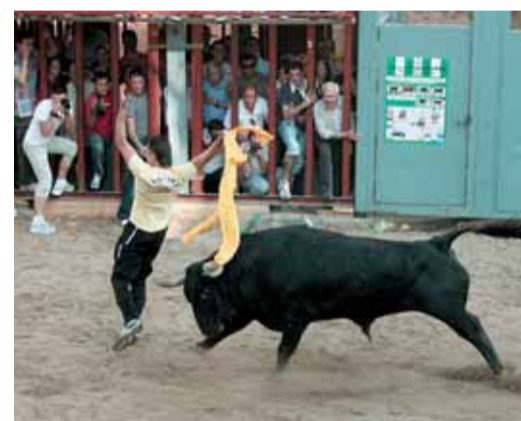
Un pase en la primera sesión de 'bou per la Vila'. J. V.