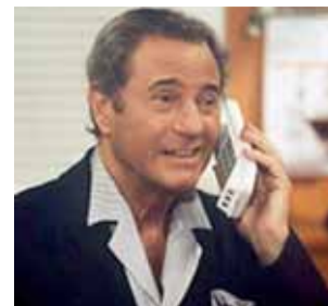
El conocido actor.