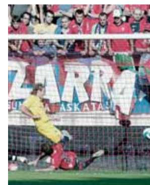
Forlán remata a la red.

● El de ayer es el segundo 'hat-trick' que firma Diego Forlán como futbolista del Villarreal. El primer lo protagonizó en el Camp Nou en la penúltima jornada de la Liga 04-05, en un partido que acabó con 3-3. Con los tres tantos de ayer, el delantero uruguayo ya suma 15 en la actual competición y un total de 50 en Liga. En el 1-4 remató con un rival en el suelo. Dijo que "no le vi".