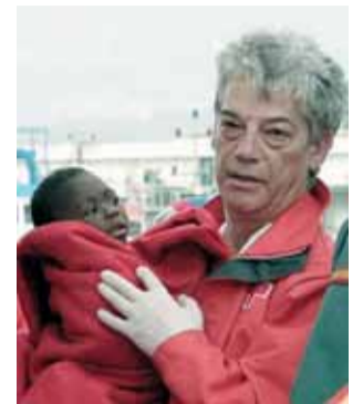
Un voluntario, con un niño.