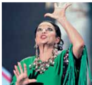
La célebre artista.

BARCELONA. El descubrimiento de Troya y la extinción de un incendio en Berlín son los principales argumentos de The hunt for Troy y Raging Inferno , exitosos telefilmes europeos de los que Telecinco ha adquirido los derechos de emisión.