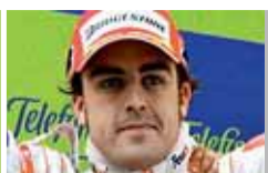
Fernando Alonso CAMPEÓN DEL MUNDO DE FÓRMULA 1

«LLEGUÉ MÁS RÁPIDO, FRENÉ MÁS TARDE, DELANTE DE ÉL [MASSA], PERO ÉL NO PENSÓ LO MISMO» • Deportes Página 15