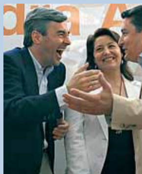
Ángel Acebes, ayer.

● El secretario general del PP, Ángel Acebes, exigió al Gobierno que inicie "esta misma tarde" [por ayer] "el proceso judicial para la suspensión de ANV". Para el PP, ya no hay dudas de que "ETA quiere el voto para ANV". El presidente de los populares, Mariano Rajoy, anunció que preguntará al presidente del Gobierno por qué "dejó" que Batasuna vaya a las urnas. EFE