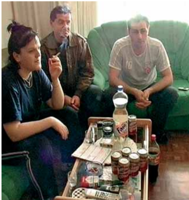
Una familia de rumanos en una imagen del documental.

En este municipio madrileño viven 38.000 inmigrantes, de los cuales la mitad son rumanos. El próximo 27 de mayo es la primera vez que este colectivo puede participar en unas elecciones municipales. Es un hecho que, obviamente, no ha pasado desapercibido a los políticos.