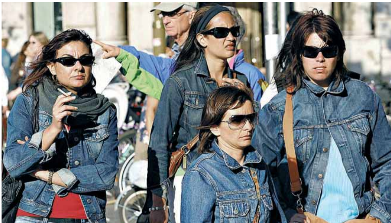
Un grupo de mujeres se protege los ojos del sol durante un paseo por Barcelona, la semana pasada.

La consecuencia es que la radiación se almacena en cier-