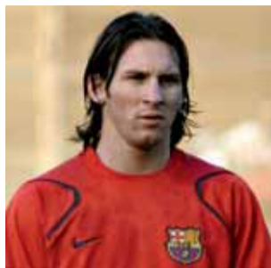
El jugador Leo Messi.