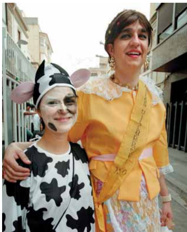
La 'otra' reina de las fiestas, ayer, en la Cavalcada. C. RIPOLLÉS

Tampoco ha faltado en este arranque festivo el 'bou per la Vila', ni el vinito de rigor en el Casal del Vi. Esta noche, la 'xulla' se encargará de darle más cuerda si cabe a la semana grande de Vila-real.