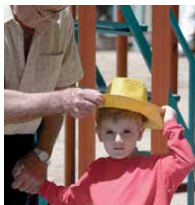
Un niño se protege del sol. J. VILANOVA