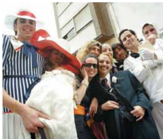
Bodas y bautizos en la peña El Culató. C. RIPOLLÉS