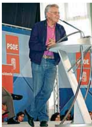
González, ayer en Badajoz.