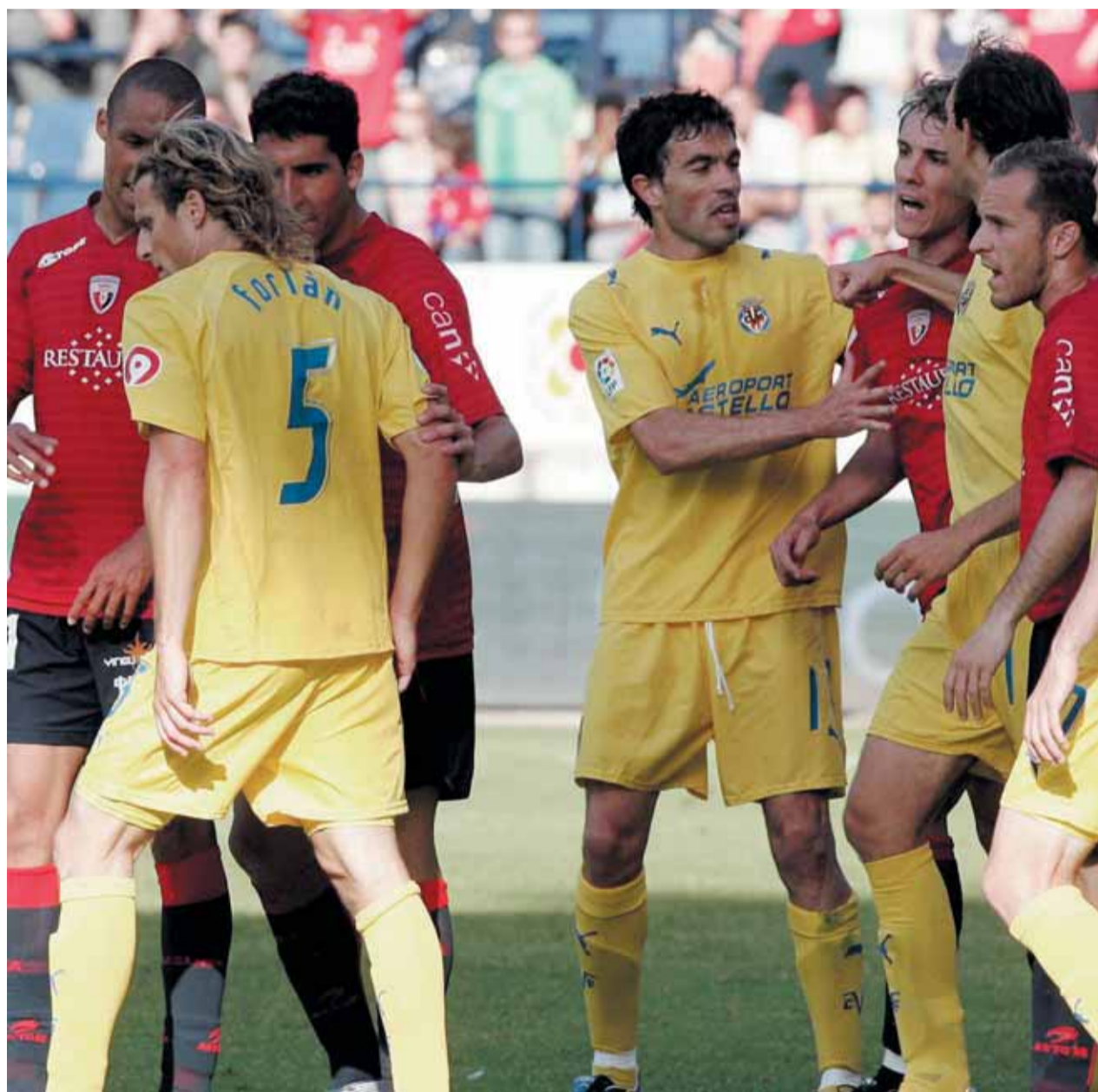
Jugadores de Osasuna recriminan a Forlán tras haber conseguido el 1-4.

Sin embargo, el conjunto amarillo ha resurgido de ma-