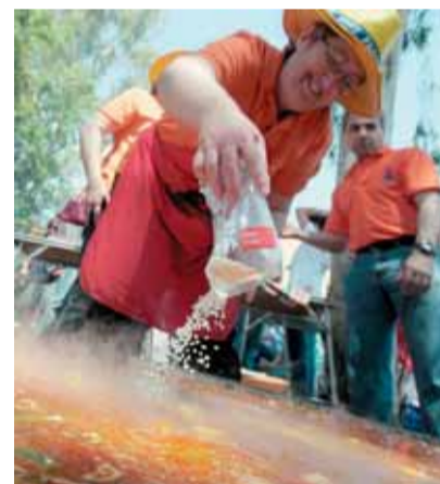
Concurso de paellas. J. VILANOVA