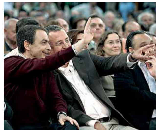
José Luis Rodríguez Zapatero, ayer en Salamanca.