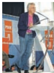
González, ayer en Badajoz.

do sus dotes de oratoria y recordando el pasado. El histórico socialista hizo memoria aprovechando que el Tribunal de Derechos Humanos de Estrasburgo acaba de cuestionar la imparcialidad del juicio contra su secretario de Estado Rafael Vera, condenado por el secuestro de Segundo Marey. En