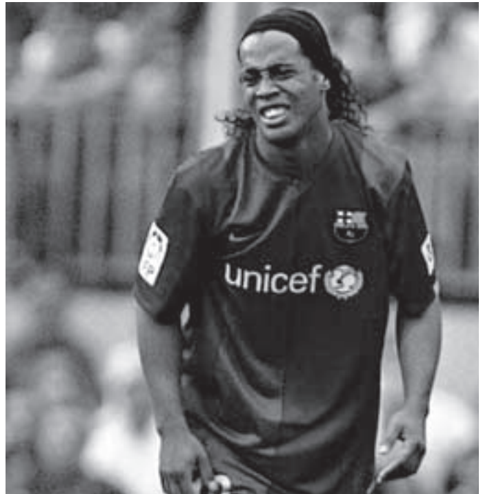
El delantero del Barça Ronaldinho se lamenta durante el partido ante el Betis, ayer.

Los azulgrana, sin tensión ni fondo físico, tienen que esperar ahora a que el Madrid, que llega embalado a las últimas cuatro jornadas, falle. El crédito y la confianza del campeón de Liga y de la Champions se agota. Está bajo mínimos.