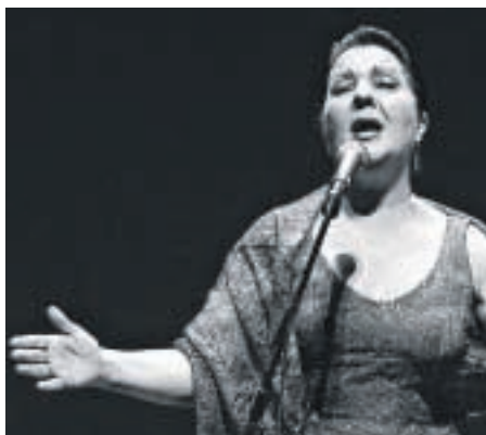
Una de las mejores voces flamencas, Carmen Linares.