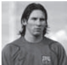
El jugador Leo Messi.