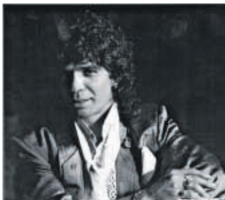
El fallecido cantaor Camarón de la Isla.