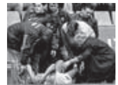
El brasileño siendo atendido.

junto celeste, ocho teniendo en cuenta que en caso de empate quedarían por encima en la clasificación. Es decir, que una victoria de la Real Sociedad la próxima jornada dejaría al cuadro olivíco a dos puntos de materializar su descenso matemático a Segunda División.