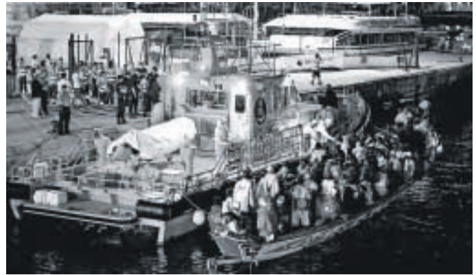
Desembarco de un cayuco con decenas de personas, ayer, en Tenerife.

interceptada ayer por la Guardia Civil y Salvamento Marítimo, a siete millas de la Isla de Alborán (Almería). Según el pesquero que la avistó y alertó al centro de emergencias, en la barcaza podrían viajar 60 subsaharianos y algún menor entre ellos.