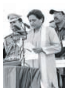
Mayawati jurando el cargo.

Mayawati fue, a mediados de los noventa, la primera ministra más joven de un estado indio. El regreso al poder de esta abogada, ahora con mayoría absoluta, podría tener gran calado político. Uttar Pradesh pesa mucho en las elecciones generales. EFE