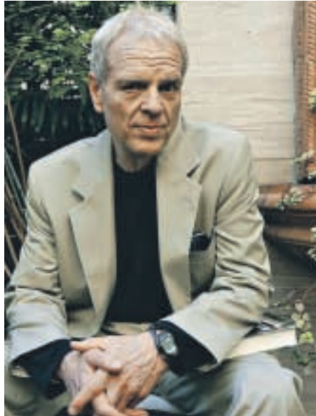
El escritor estadounidense, en Barcelona. FRANCESC SANS

Como método de trabajo Folsom planteó a los servicios de inteligencia americanos y españoles la misma pregunta: ¿qué pasaría si el presidente desapareciera? Y basó la trama en esas respuestas que in-