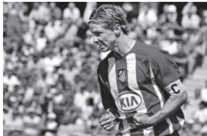
Torres celebra el primero de sus dos goles, ayer en Getafe.

GOLES: 0-1 (2') Torres. 0-2 (18') Maniche. 1-2 (60') Manu. 1-3 (64') Torres. 1-4 (68') Galletti (p.)