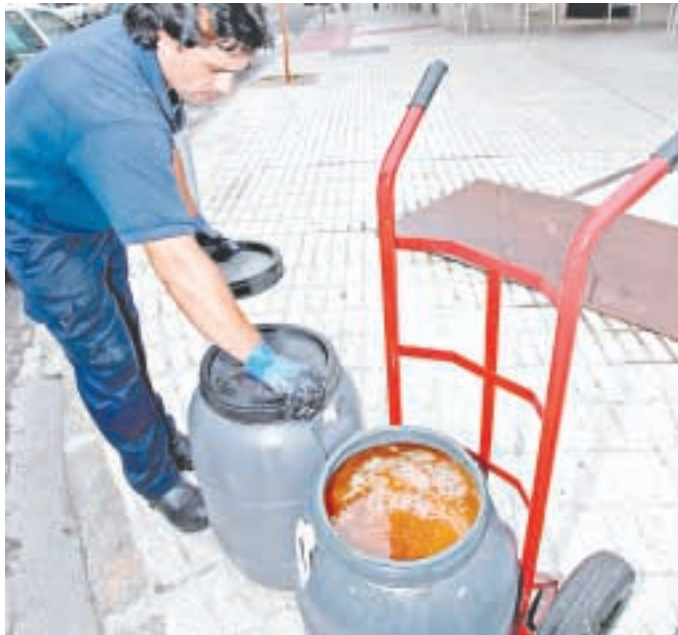
Más de 8.000 ciudadanos colaboran con esta iniciativa ecológica. M. G. BREJA

Tirar el aceite por los desagües, que generalmente son de PVC, hace que éstos se vayan deteriorando porque, cuando el aceite se enfría,