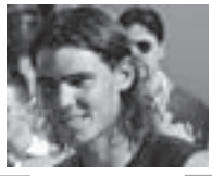
Rafael Nadal JUGADOR DE TENIS