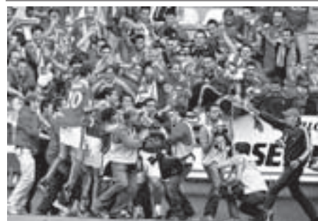
ANA F. BARREDO EFE

El Murcia asciende a Primera. Empatado el sábado en el campo de la Ponferradina (1-1) y certificó su ascenso. El Murcia regresa a Primera. Igual que el Valladolid, líder de Segunda.