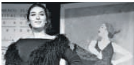
La cantaora flamenca Estrella Morente.

● La ciudad de Cornellà se convierte en capital del arte flamenco una vez más ante la llegada del Festival de Arte Flamenco de Catalunya. En su XXIV edición acoge tanto cantaores y tradiciones de ámbito más local como artistas consagrados de la talla de Estrella Morente. La artista granadina, todo un referente del cante flamenco, ofreció un emotivo recital en el Auditori de Cornellà.