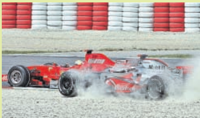
Massa, por delante, y Alonso, en el momento en que se tocan, en la primera curva.

● Acababa de empezar el Gran Premio de España y se produjo el susto de la jornada. Fernando Alonso, en su intento de adelantar a Massa en la salida, acabó contactando con él en la primera curva. El bicampeón del mundo se salió de la pista y, milagrosamente, pudo volver a ella. Luego, habló de "suerte" porque "en el 99 por ciento de los casos, los dos coches hubiéramos quedado eliminados". Y censuró la maniobra, según él desafortunada, del piloto brasileño de Ferrari: "Llegué más rápido, frené más tarde, delante de él [Massa], pero él no pensó lo mismo".