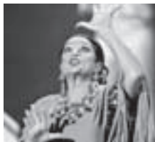
La célebre artista.

BARCELONA. El descubrimiento de Troya y la extinción de un incendio en Berlín son los principales argumentos de The hunt for Troy y Raging Inferno , exitosos telefilmes europeos de los que Telecinco ha adquirido los derechos de emisión.