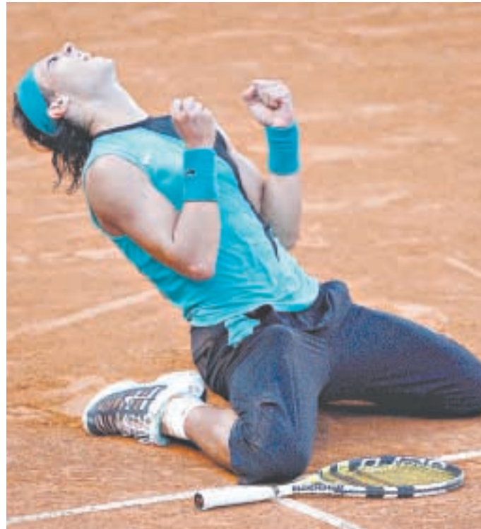
El tenista balear levanta los brazos tras conseguir el punto de la victoria.

● El número uno del mundo ha decidido romper con su entrenador, el australiano Tony Roche, al que Federer le agradeció "todos sus esfuerzos durante estos últimos años". El cambio se produce en el peor momento deportivo del suizo y a dos semanas de Roland Garros, su gran objetivo.