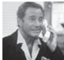
El conocido actor.