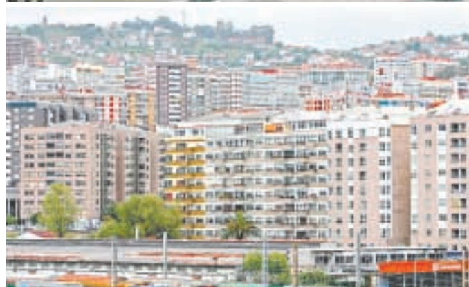
El tráfico y el urbanismo son los principales problemas de Vigo para el ciudadano. M. G. BREA

Mientras tanto la oposición suspende quedándose en un 3,9. Haciendo un balance de las ocho principales ciudades gallegas, sólo en Ferrol y en Pontevedra reciben una peor valoración los políticos de oposición con un 3,3 y un 3,7 respectivamente.