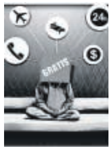
ILUSTRACIÓN: CARLOS SUÑÉ

P ara qué pagar si lo puedes tener gratis? Detrás de esta pregunta han surgido las iniciativas empresariales, solidarias o reivindicativas de gran relevancia durante la última década.