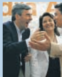
Ángel Acebes, ayer.

● El secretario general del PP, Ángel Acebes, exigió al Gobierno que inicie "esta misma tarde" [por ayer] "el proceso judicial para la suspensión de ANV". Para el PP, ya no hay dudas de que "ETA quiere el voto para ANV". El presidente de los populares, Mariano Rajoy, anunció que preguntará al presidente del Gobierno por qué "dejó" que Batasuna vaya a las urnas.