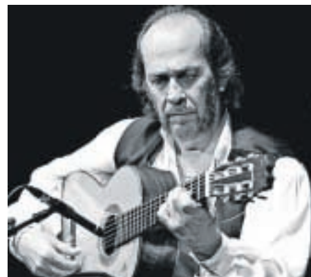
Paco de Lucía es uno de los más populares guitarristas.