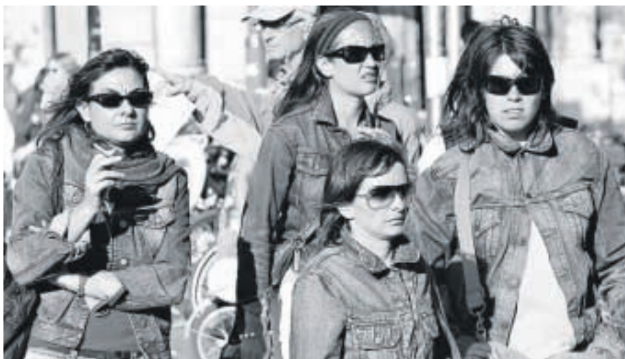
Un grupo de mujeres se protege los ojos del sol durante un paseo por Barcelona, la semana pasada.

La consecuencia es que la radiación se almacena en cier-