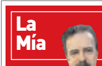
Por Manuel Campo Vidal

En muchas ciudades españolas se puede dar el caso en las próximas elecciones de que los colectivos de inmigrantes tengan un peso esencial en la elección de gobiernos. El documental muestra las diversas respuestas de unos y otros ante un hecho casi sin precedentes y del que todos quieren sacar tajada.