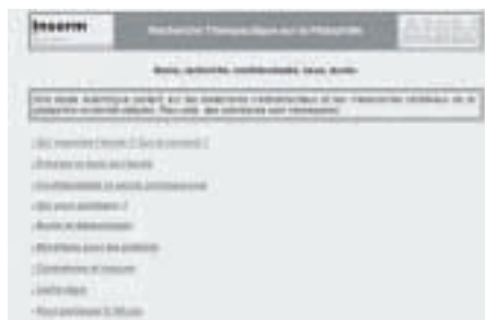
Web en la que se anuncia el ensayo científico.

Las moléculas sometidas a prueba se utilizan para el tratamiento del cáncer de próstata y disminuyen la secreción de la testosterona, la hormona masculina que regula el deseo sexual. Su peculiaridad respecto a otros tratamientos es que es reversible. Sin embargo, Stoleru advierte de que "se trata sólo de aportar una herramienta suplementaria, no es la píldora milagro". EFE