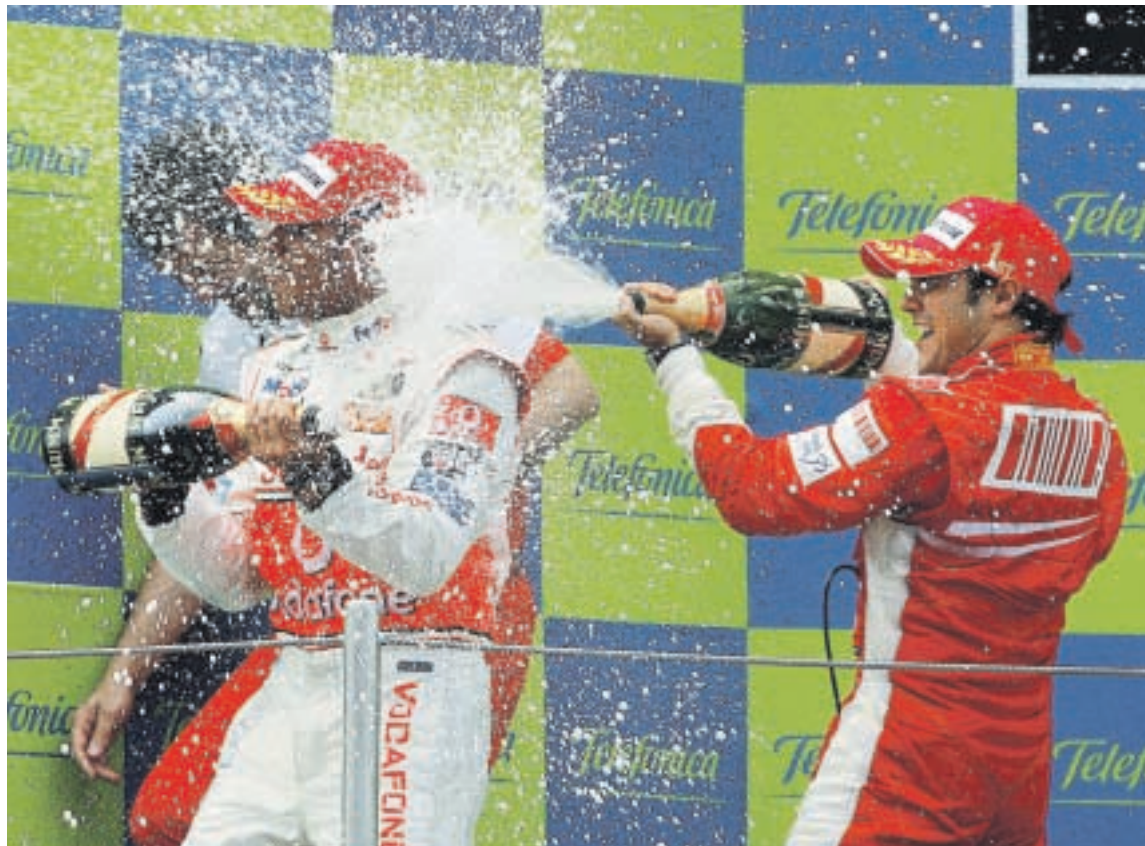
Felipe Massa y Lewis Hamilton celebran y se rocían con cava sobre el podio de Montmeló, tras el GP de España, ayer.

Lejos del corredor de Ferrari estaba Hamilton, el gran beneficiado en la salida. El único que templó los nervios. El piloto británico se aprovechó del choque entre Massa y