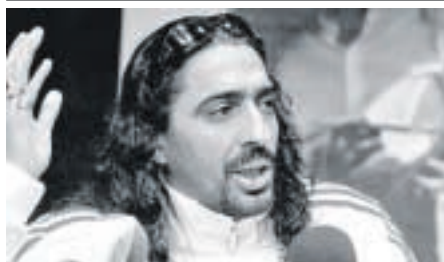
'Lágrimas negras' popularizó a Diego 'El Cigala'.