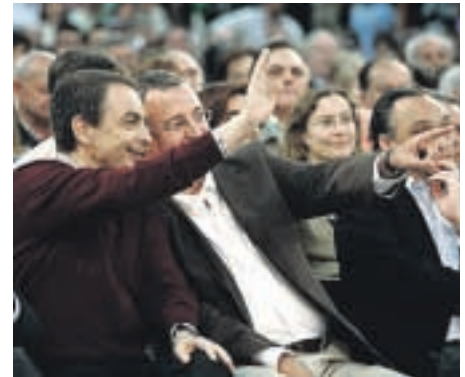
José Luis Rodríguez Zapatero, ayer en Salamanca.