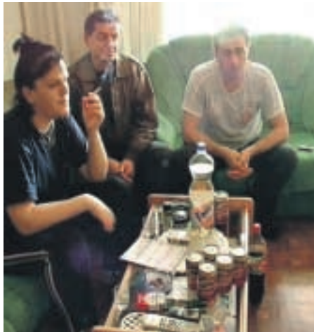
Una familia de rumanos en una imagen del documental.

En este municipio madrileño viven 38.000 inmigrantes, de los cuales la mitad son rumanos. El próximo 27 de mayo es la primera vez que este colectivo puede participar en unas elecciones municipales. Es un hecho que, obviamente, no ha pasado desapercibido a los políticos.