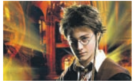
El aprendiz de mago en un fotograma de la película. ADN