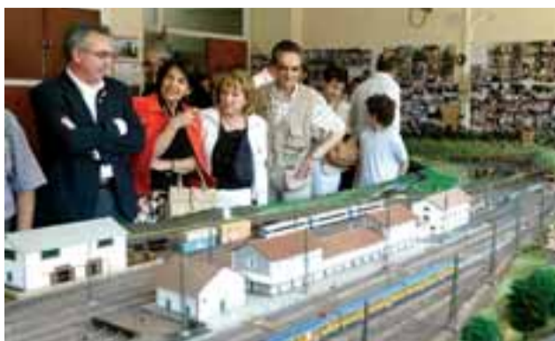
Miguel Sanz (UPN), de visita electoral a Alsasua.

A falta de 12 jornadas para acudir a la cita con las urnas, los candidatos siguen una agenda imparable que continuará esta semana con la visita, además, de figuras relevantes de la política nacional.