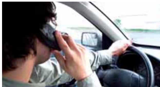
Hablar conduciendo conlleva multa y pérdida de puntos.

El joven estellés estudia 4º de la ESO en la ikastola Lizarrre y sigue sus estudios de txistu en el Conservatorio Pablo Sarasate de Pamplona.