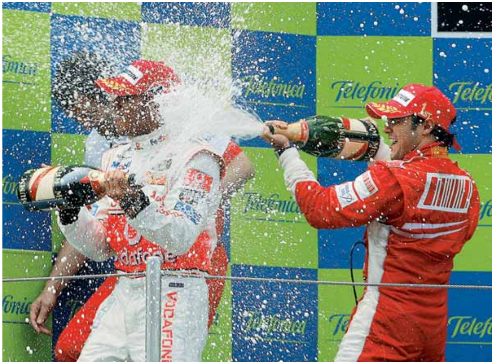
Felipe Massa y Lewis Hamilton celebran y se rocían con cava sobre el podio de Montmeló, tras el GP de España, ayer.

Lejos del corredor de Ferrari estaba Hamilton, el gran beneficiado en la salida. El único que templó los nervios. El piloto británico se aprovechó del choque entre Massa y