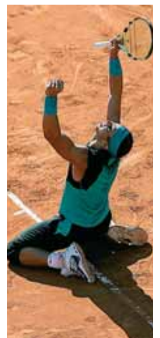
Nadal levanta los brazos tras ganar a González.

Al final del partido, sonreía satisfecho. Tras el palizón del sábado en las semifinales contra Davydenko, ayer Nadal se lo pasó en grande. "Por fin he podido tener una final tranquila", declaraba tras recibir de Manolo Santana el trofeo romano. El 21º título de su carrera.