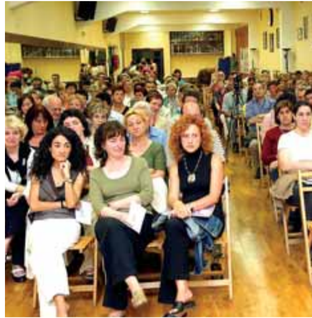
Reunión de afectados por esta enfermedad.

Se trata de un trastorno muy común que afecta, según un estudio de EPISER de la Sociedad Española de Reumatología, a entre el 2% y el 4% de la población española, lo que supone más de un millón de personas enfermas mayores de 18, de las cuales el 90% es mujer.