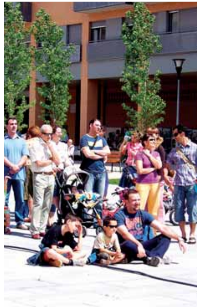
Ayer al mediodía, durante la actuación de Cheroкке Big Band.

A su vez, otros pequeños se sumergieron en talleres de manualidades variados, donde pudieron, por ejemplo, construir juguetes, marionetas o máscaras con diversos materiales reciclados.