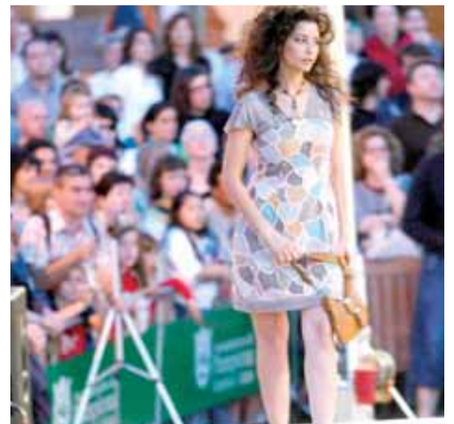
Participaron 50 personas, de entre 3 y 50 años.