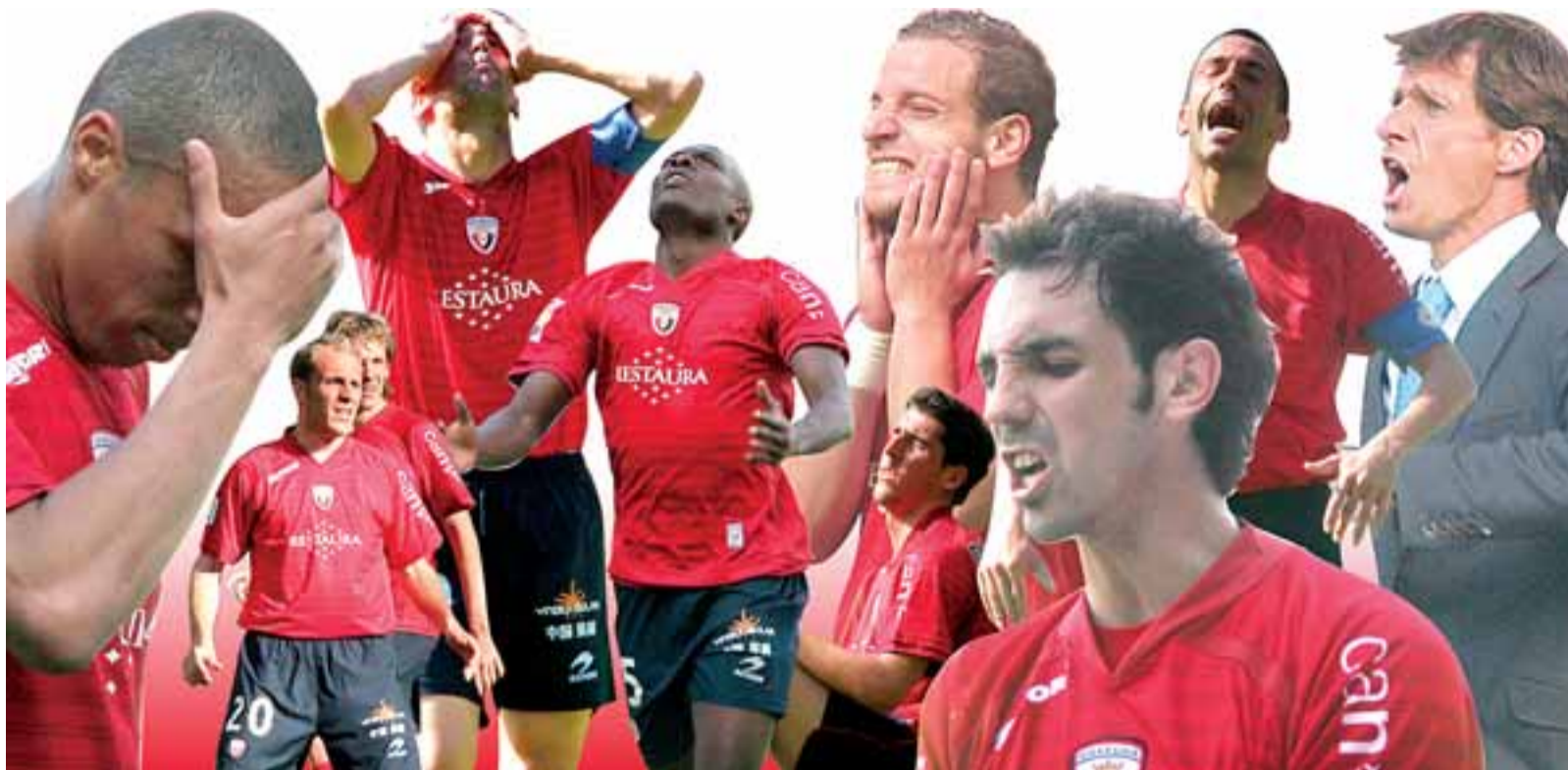
Los gestos de los jugadores de Osasuna, ayer en el Reyno de Navarra, lo dicen todo. El equipo está sufriendo en el tramo final de la temporada. JAVIER NOÁIN