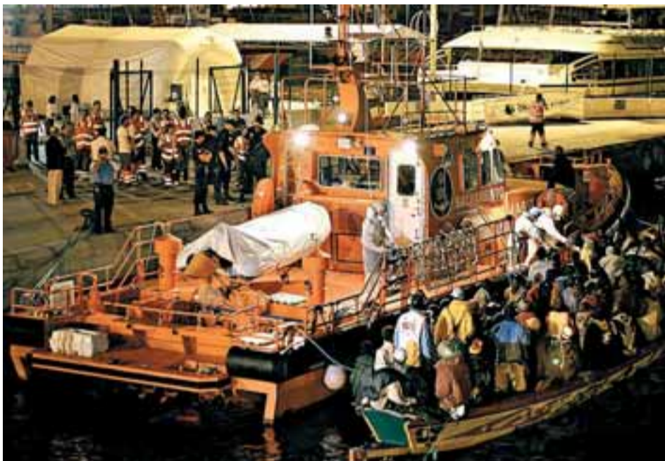
Desembarco de un cayuco con decenas de personas, ayer, en Tenerife.

Por otro lado, una patera con un número indeterminado de inmigrantes al cierre de esta edición fue localizada e interceptada ayer por la Guardia Civil y Salvamento Marítimo, a siete millas de la Isla de Alborán (Almería). Según el pesquero que la avistó y alertó al centro de emergencias, en la barcaza podrían viajar 60 subsaharianos y algún menor entre ellos.