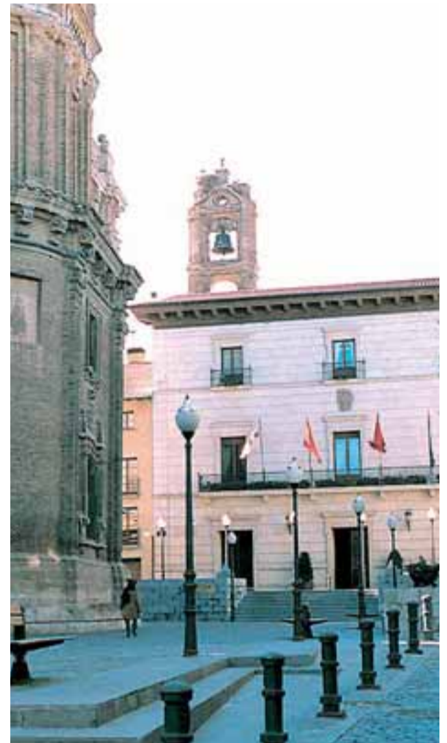
Fachada principal del Consistorio tudelano.

Posteriormente, en los comicios de 1999 consiguió 12 ediles y cuatro años más tarde repitió la misma cifra. En estos últimos ocho años no le ha hecho falta pactar con otras formaciones políticas. En 2003, además de los 12 concejales de UPN, PSN obtuvo 5, Bazarre 2 e IU 2.