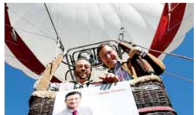
Torrens (PSN) y Mori volaron en globo aerostático.