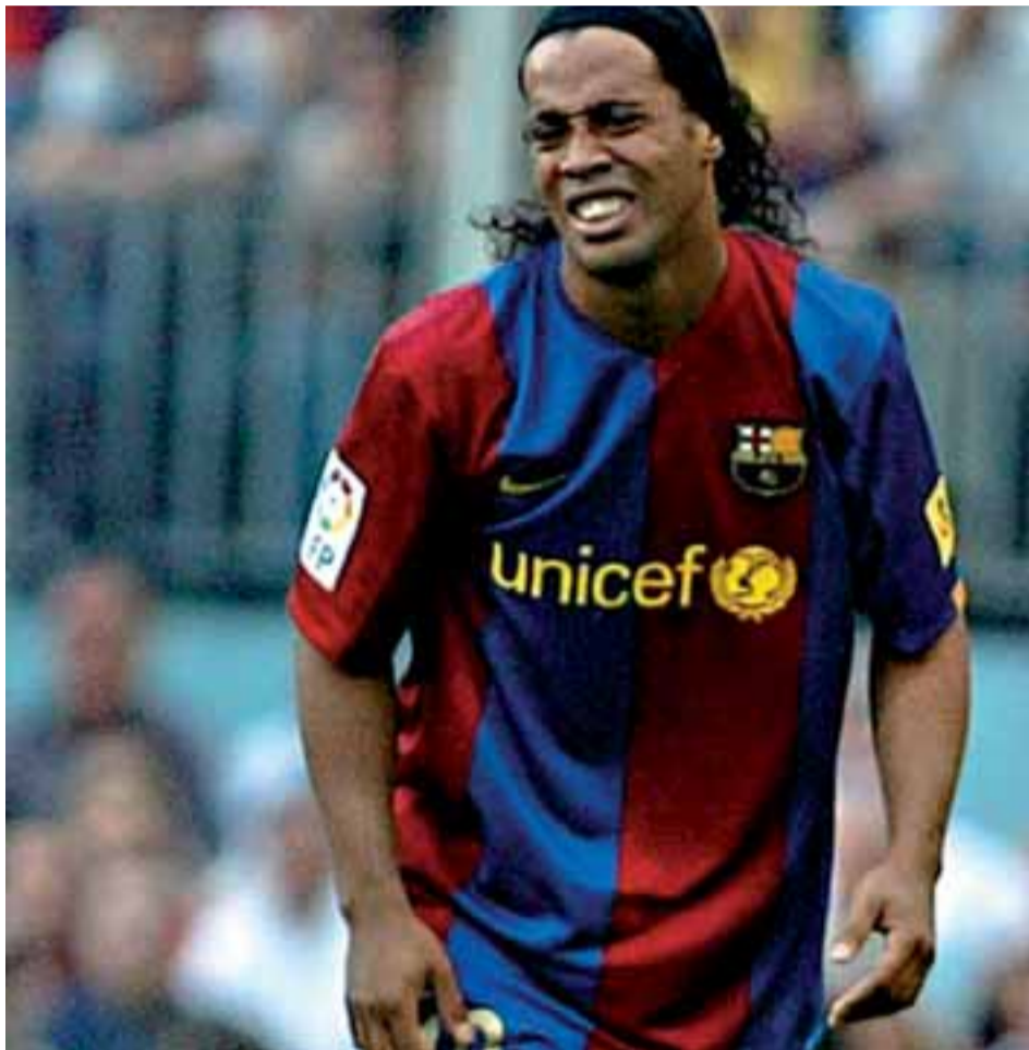
El delantero del Barça Ronaldinho se lamenta durante el partido ante el Betis, ayer.

Un error defensivo en el último minuto dio al Betis un empate inesperado. Sobis marcó y resquebrajó por completo los cimientos de un Barça que en la primera mitad desperdició hasta ocho ocasiones de gol.