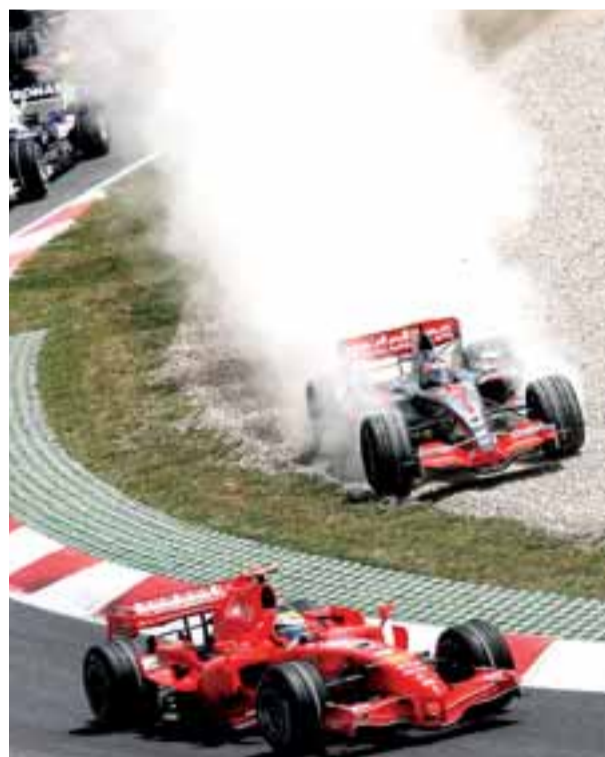
Alonso se salió de la pista, ayer, en Montmeló.