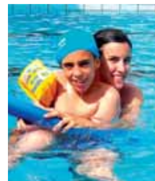
Actividad de Anfas en 2006.