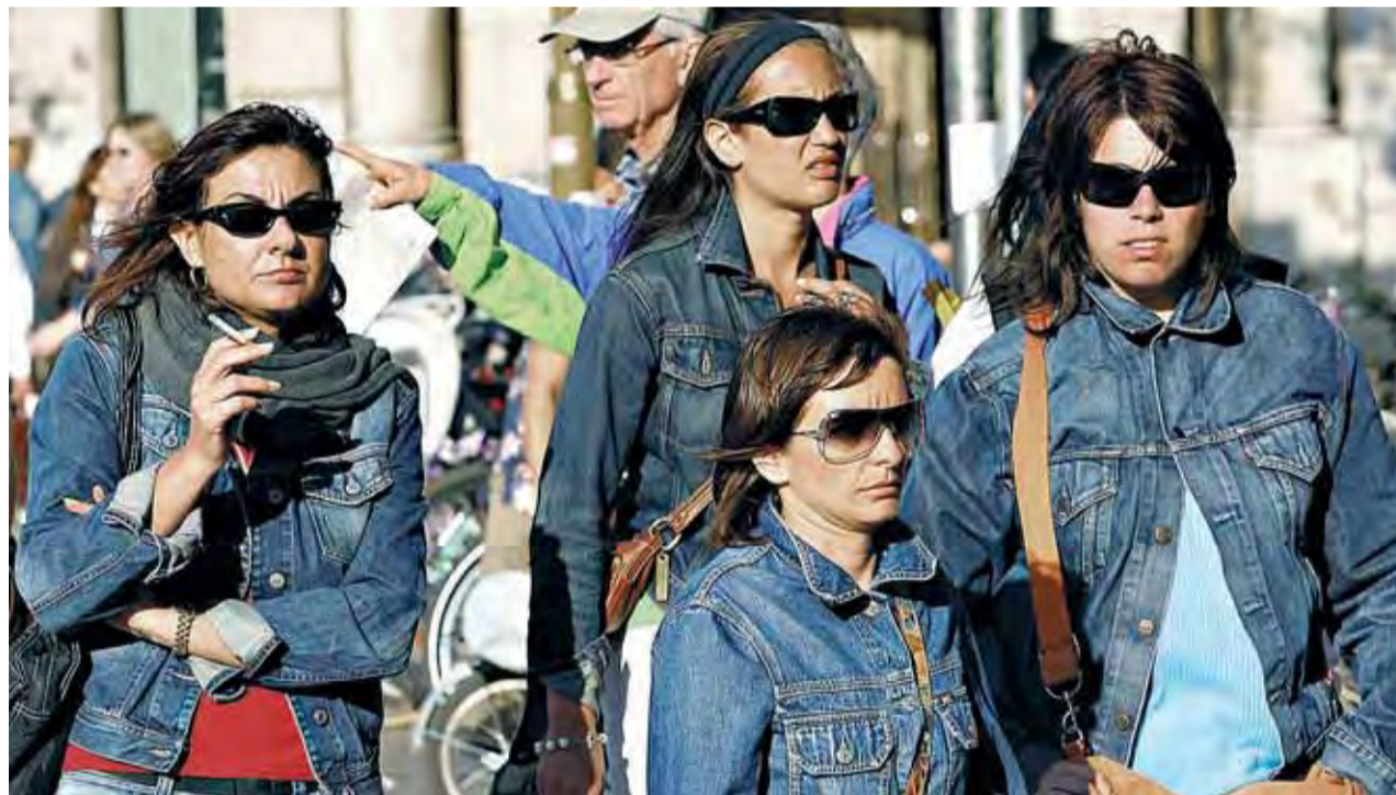
Un grupo de mujeres se protege los ojos del sol durante un paseo por Barcelona, la semana pasada. JORDI SOTERAS

La consecuencia es que la radiación se almacena en cier-