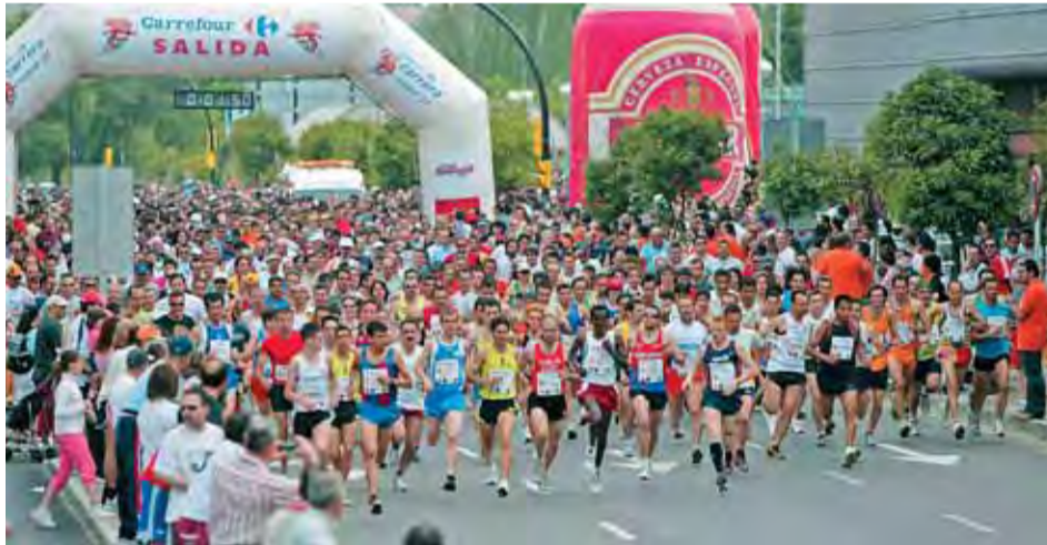
Las calles por las que pasó la prueba se convirtieron en una riada de corredores.