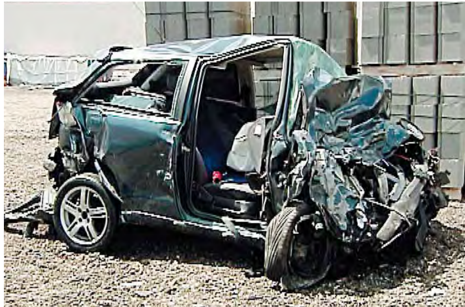
Estado en que quedó uno de los vehículos implicados en el accidente.

SEIS FALLECIDOS EN UN MES Los dos tramos en obras de la