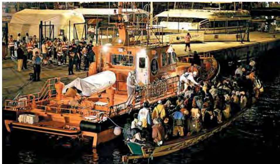
Desembarco de un cayuco con decenas de personas, ayer, en Tenerife.

interceptada ayer por la Guardia Civil y Salvamento Marítimo, a siete millas de la Isla de Alborán (Almería). Según el pesquero que la avistó y alertó al centro de emergencias, en la barcaza podrían viajar 60 subsaharianos y algún menor entre ellos.