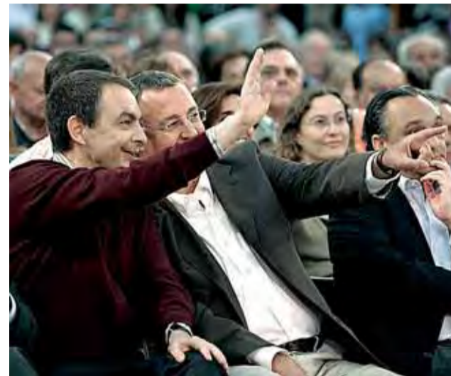
José Luis Rodríguez Zapatero, ayer en Salamanca.