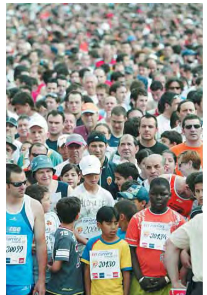
Los primeros en la línea de salida llegaron temprano. M. O.