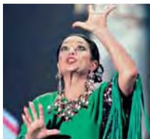
La célebre artista.

BARCELONA. El descubrimiento de Troya y la extinción de un incendio en Berlín son los principales argumentos de The hunt for Troy y Raging Inferno , exitosos telefilmes europeos de los que Telecinco ha adquirido los derechos de emisión.