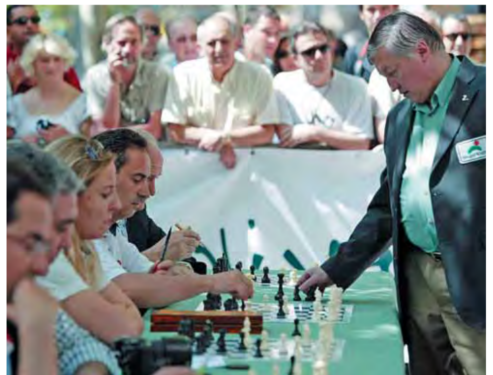
El campeón Anatoli Karpov se midió a 16 contrincantes durante una hora y media.