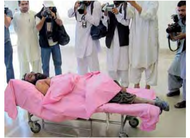
Reporteros afganos fotografían el cadáver de Dadullah, ayer.

Así lo destacó en un comunicado difundido por una página web talibán, en la que pidió combatir la política estadounidense, consistente en "crear fracturas entre los grupos étnicos" para "debilitar" al mundo musulmán.