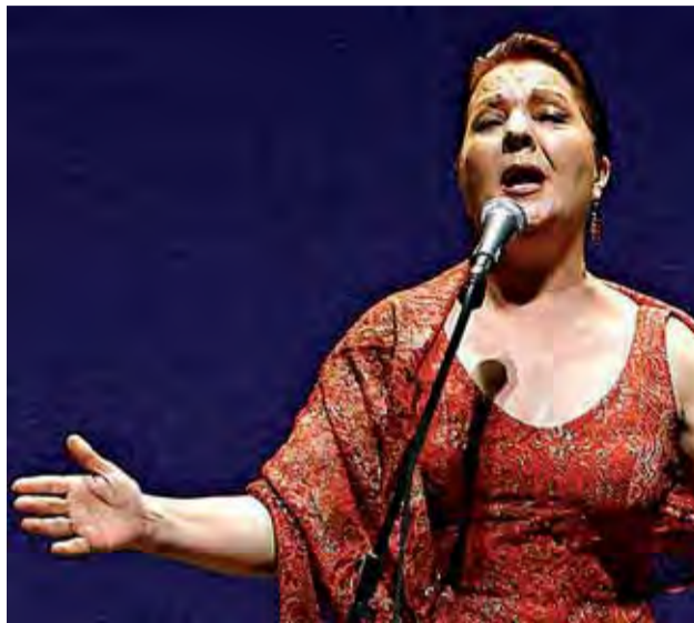
Una de las mejores voces flamencas, Carmen Linares.