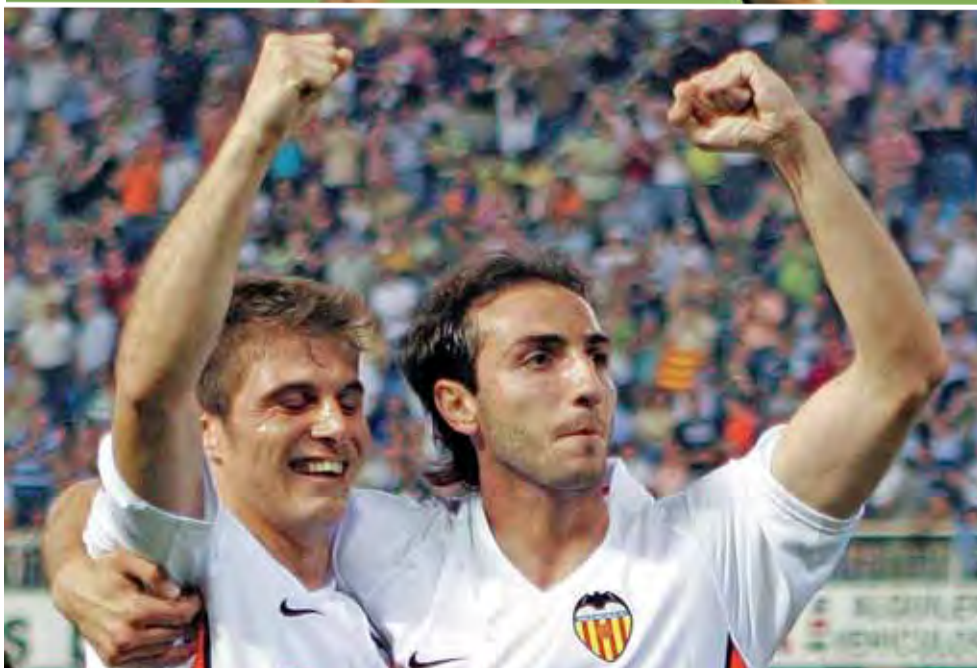
El Valencia desbarboló al Zaragoza en la primera parte con ocasiones constantes.