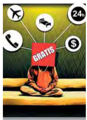
ILUSTRACIÓN: CARLOS SUÑÉ

Tube apostó por un sistema sencillo para subir vídeos a la red y ahora es el canal más popular para visualizar y compartir imágenes. Stuart, propiedad del siempre rápido difunde arte de forma digital. El mecenazgo sale barato.