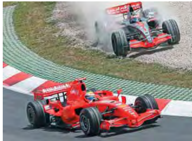
Massa cerró a Alonso y le hizo salir de la pista.

El Zaragoza, a siete puntos del Valencia • Página 12