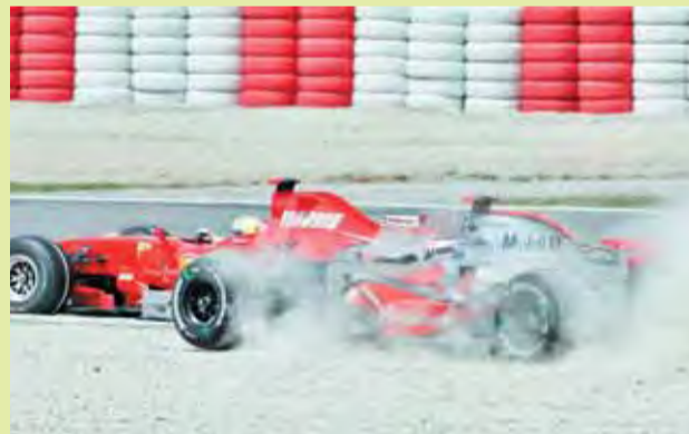
Massa y Alonso, en el momento en que se tocan.

● Fernando Alonso, en su intento de adelantar a Massa en la salida, acabó contactando con él en la primera curva. El bicampeón se salió de la pista, pero pudo volver a ella. Luego, habló de "suerte" porque "en el 99 por ciento de los casos, los dos coches hubiéramos quedado eliminados". Y censuró la maniobra del brasileño: "Llegué más rápido, frené más tarde, delante de él, pero él no pensó lo mismo".