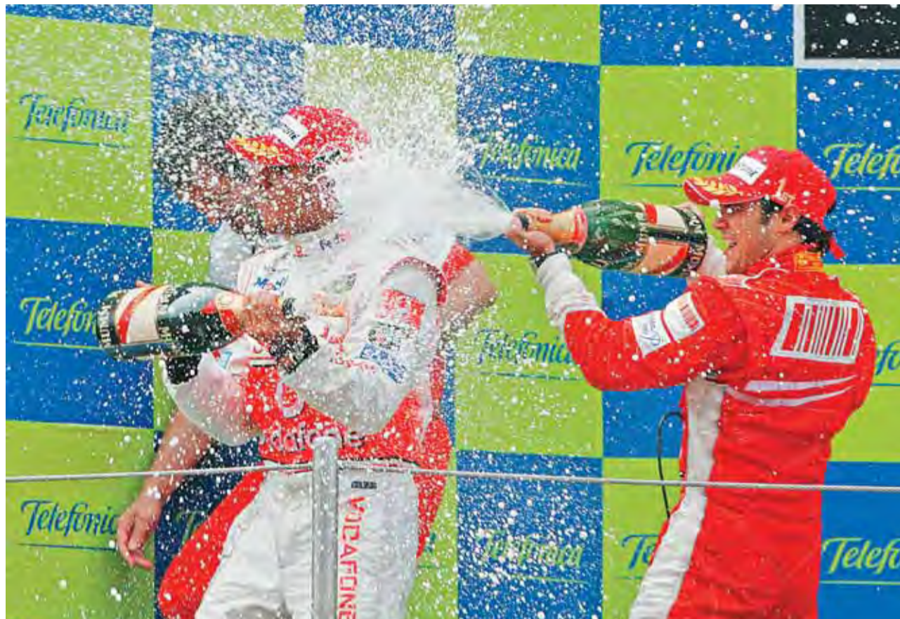
Felipe Massa y Lewis Hamilton celebran sus resultados y se rocían con cava sobre el podio de Montmeló.

Varios metros por delante, Massa seguía dominando la carrera, acumulando vueltas rápidas. Cumplía la tradición: desde el año 2000, el piloto que logra la pole, gana.