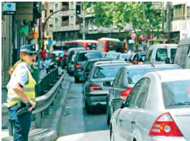
Paseo Teruel, una vía que se reformará en junio.

Mientras los grandes debates políticos sobre movilidad se centran en el tranvía y el metro, la mayoría de los partidos incluyen en su programa electoral la redefinición de las líneas de autobús. El servicio deficiente y las condiciones laborales de los conductores han