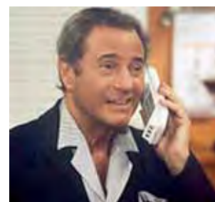
El conocido actor.