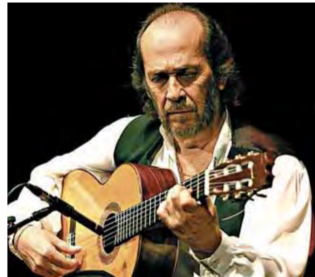
Paco de Lucía es uno de los más populares guitarristas.