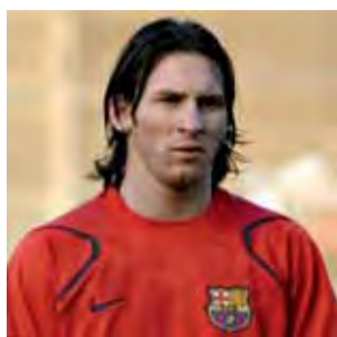
El jugador Leo Messi.