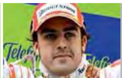
Fernando Alonso CAMPEÓN DEL MUNDO DE FÓRMULA 1

«LLEGUÉ MÁS RÁPIDO, FRENÉ MÁS TARDE, DELANTE DE ÉL [MASSA], PERO ÉL NO PENSÓ LO MISMO» • Deportes Págs. 15