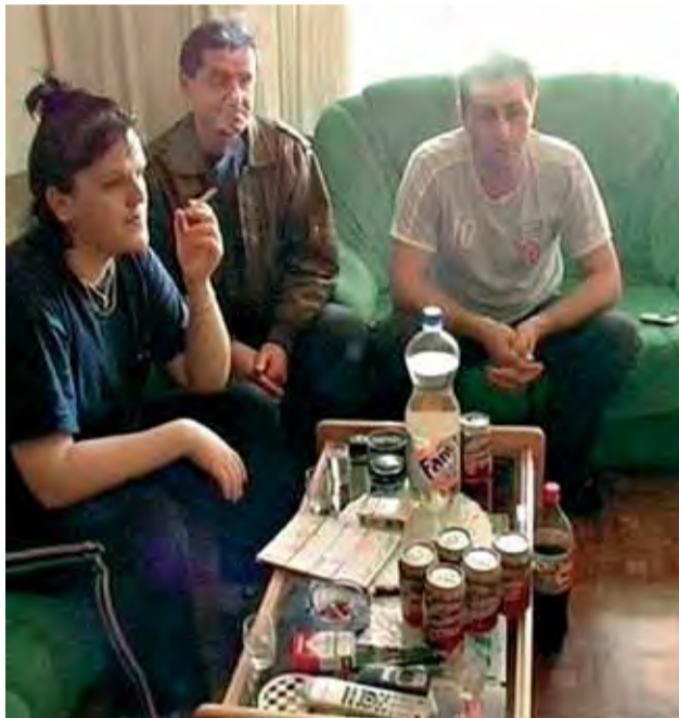
Una familia de rumanos en una imagen del documental.

En este municipio madrileño viven 38.000 inmigrantes, de los cuales la mitad son rumanos. El próximo 27 de mayo es la primera vez que este colectivo puede participar en unas elecciones municipales. Es un hecho que, obviamente, no ha pasado desapercibido a los políticos.