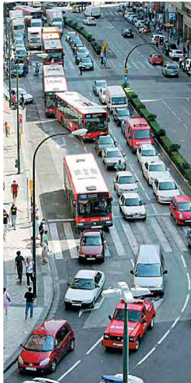
Atasco en César Augusto, en imagen de archivo.

En Zaragoza hay censados 311.602 vehículos, de los que 237.208 son coches. El aumento de turismos se ha traducido en un déficit de 50.000 aparcamientos, que se atenuará con 1.536 plazas. Los políticos creen que el tráfico mejorará con el Plan Intermodal de Transporte, que busca que 204.000 conductores cambien el coche por el transporte público con el horizonte del 2015.