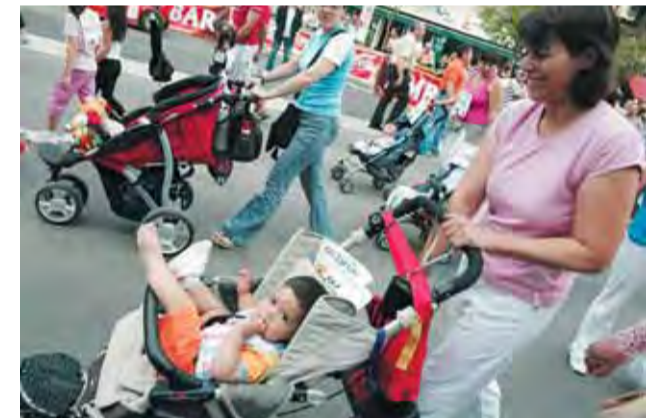
Entre los participantes, había niños muy pequeños. M. OVEJERO