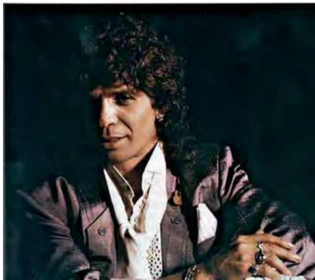
El fallecido cantaor Camarón de la Isla.