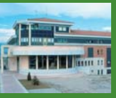
10 Canonge Collell, Vic