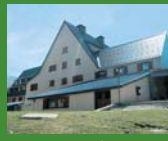
6 Pic de l'Àliga, Núria