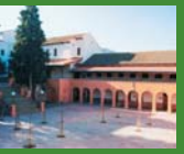
5 Jaume I, l'Espuga de F.