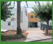
8 L'Encanyissada, Poble N. del Delta