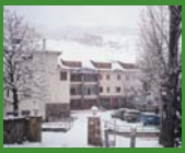
3 M. D. de les Neus, La Molina