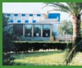
2 Sta. Maria del Mar, Coma-ruga