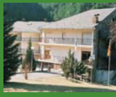
7 Pere Figuera, Planoles