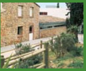
4 Empúries, l'Escala