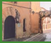
1 Casa Gran, Altafulla