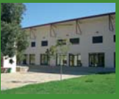
9 Del Pallars, Tremp