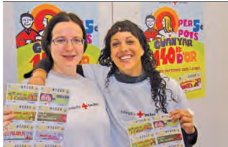
Uns voluntaris de Creu Roja amb unes butlletes