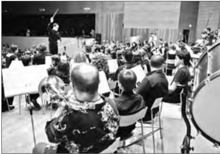
Els músics de L'Intèrpret actuaran a l'Auditori Enric Granados

L'Auditori Enric Granados acollirà aquest concert en el qual participaran més de 200 músics