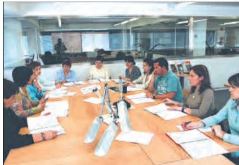
Un dels moments del taller