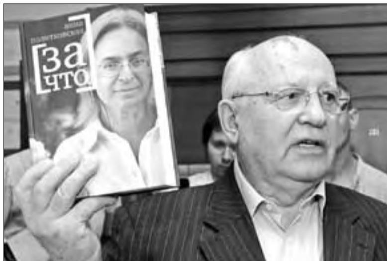
L'antic president soviètic mostra un exemplar de la publicació

L'expresident de la Unió Soviètica, Mijail Gorbaxov, va ser l'encarregat ahir de presentar, a la seu de la seva fundació, a Moscou, el llibre de la periodista assassinada Anna Politkovskaya. El llibre es titula ¿Para qué?