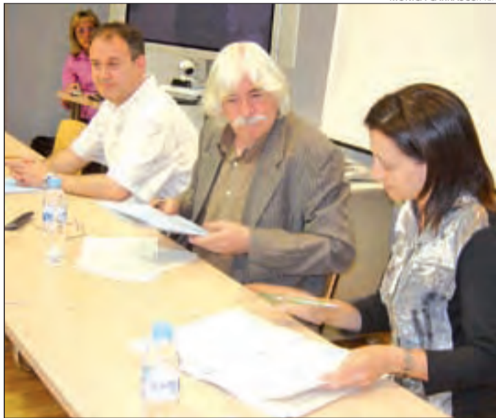
Moment de la signatura de l'acord