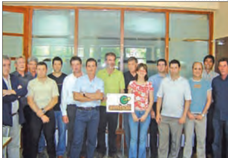
Els representants de les cooperatives impulsores de la planta