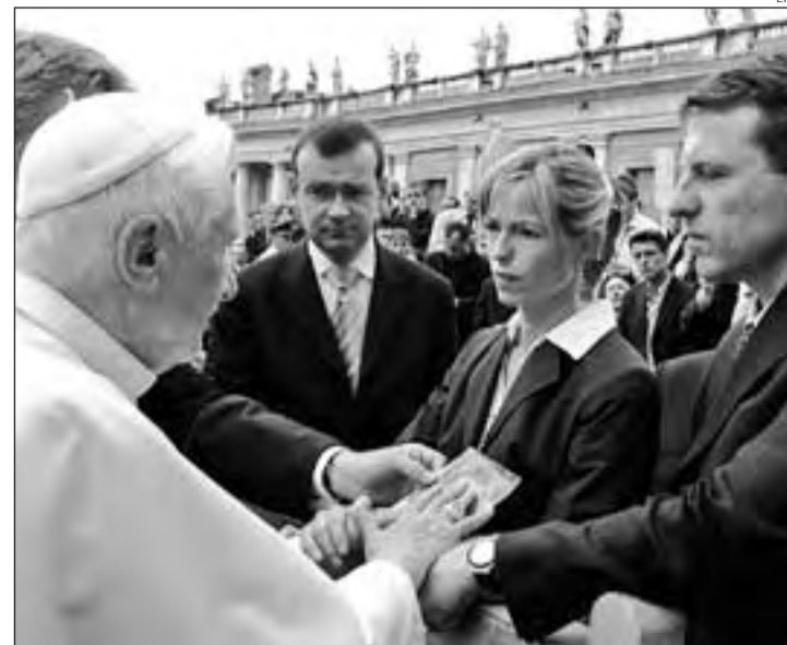
Benet XVI observa la fotografia de la nena desapareguda