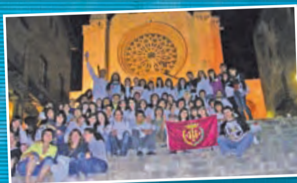
200 lleidatans han pogut gaudir de l'Aplec de l'Esperit a Tarragona