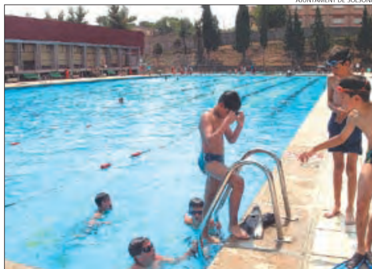
AJUNTAMENT DE SOLSONA

Els cursets de natació es duran a terme, com cada temporada, en cinc horaris diferents en funció dels grups d'edat. ■