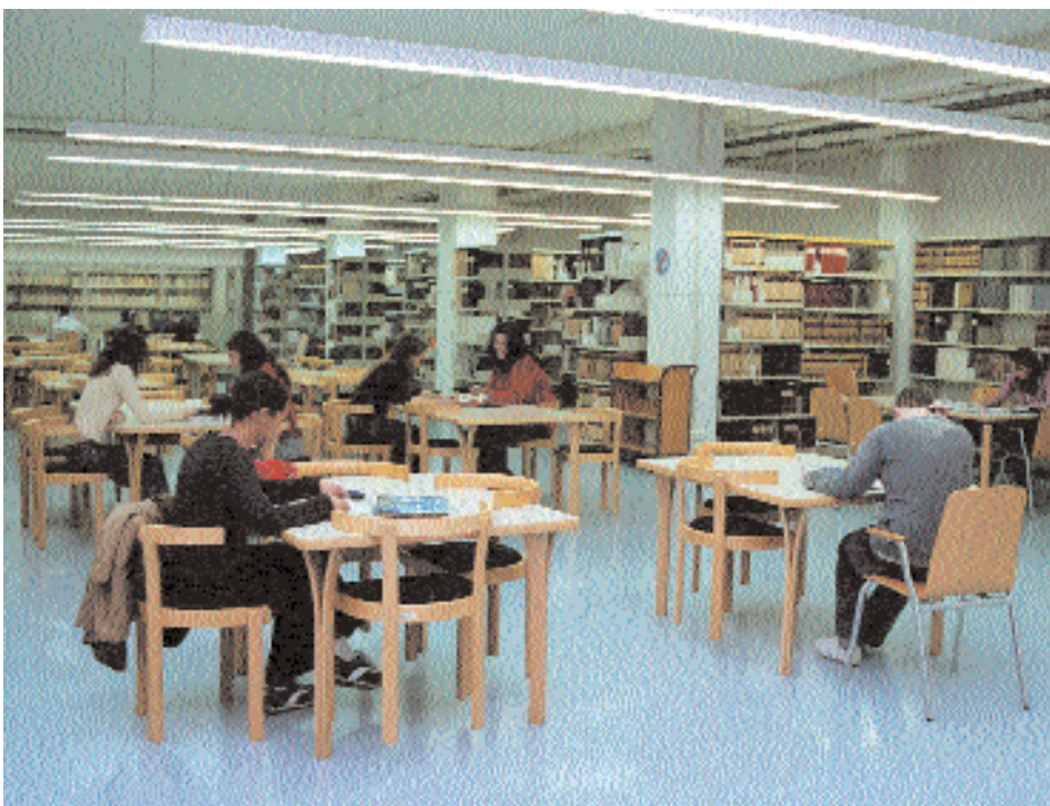
Biblioteca de la Facultat de Biblioteconomia i Documentació (març de 2005)

El juliol de 1997, la Diputació de Barcelona, titular del centre, la Universitat de Barcelona i la Generalitat de Catalunya signaven els convenis per a la integració gradual de l'Escola a la Universitat de Barcelona i per a la creació d'un centre propi de la mateixa Universitat. La integració va començar a ser efectiva el curs 1997-98, quan l'alumnat de nou accés ja va ser considerat alumnat de la UB. El gener de 1999, l'Escola passava a ser un centre de la Universitat amb el nom genèric Escola Universitària de Biblioteconomia i Documentació . El març d'aquell mateix any començava la integració del professorat amb la convocatòria de les tres primeres places de titular, i al mes d'agost el centre assolia la condició de Facultat . El conveni d'integració ha finalitzat el desembre de 2005, estant encara pendent la convocatòria de diverses places de professorat.