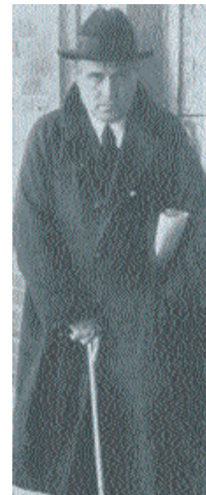
Eugeni d'Ors, primer director de l'Escola Superior de Bibliotecàries

La concepció de tot el projecte era moderna i modèlica per al seu temps, sobretot en aquest apartat de la formació del personal, en el qual fins i tot es preveia la formació continuada. I si bé els arguments a favor d'una escola femenina avui no serien políticament correctes, el projecte donava una sortida laboral i, consegüentment, una certa independència a les noies de classe mitjana, sobretot de famílies intel·lectuals, que serien les alumnes del centre.