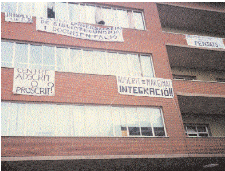
Fa ana de l'Escola al pavell  Camb , al recinte de la Maternitat, amb les reclamacions de l'alumnat sobre la integraci  del centre a la Universitat de Barcelona (juny de 1995)

La creació dels ensenyaments en el marc universitari va haver de vèncer obstacles que provenien de molts fronts. L'any 1977, per acostar postures divergents, l'Escola de Bibliologia i la Biblioteca de Catalunya van organitzar un Seminario sobre la Profesión del Bibliotecario, amb la col·laboració de l'Asociación Nacional de Bibliotecarios, Archiveros y Arqueólogos i de l'Associació de Bibliotecàries. Les conclusions demanaven la creació oficial dels ensenyaments, la seva estructuració en cicles segons la Llei general d'educació, el reconeixement de les escoles existents i la seva adscripció a la Universitat, i la formació d'una comissió per redactar les directrius de plans d'estudis en què les escoles estiguessin representades. Aquest seminari va tenir una certa influència per agilitar el procés de reconeixement dels estudis, ja que es van fer molts contactes polítics. Però, una vegada aprovats el desembre de 1978, es va haver d'esperar més de dos anys perquè es publicuessin les directrius de plans d'estudis que seguien fil per randa la proposta de l' Escola de Bibliologia . L'Associació de Bibliotecàries va treballar conjuntament amb l'Escola per aconseguir el reconeixement dels ensenyaments.