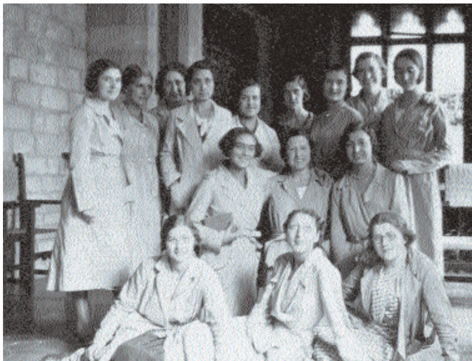
Alumnes de segon curs de l' Escola de Bibliotecàries (curs 1932-33)

La caiguda de Primo de Rivera el gener de 1930 va tenir repercussions immediates. El president de la Diputació, Milà i Camps, va ser cessat i substituït per Joan Maluquer, que va canviar radicalment els objectius de l'organisme amb vista a recuperar els instruments i les institucions de l'etapa anterior. A l'Escuela Superior para la Mujer els canvis tampoc no es van fer esperar. Alexandre Galí va ser nomenat director interí del centre l'abril de 1930 perquè procedís a la reorganització. El curs acabà amb normalitat: es feren els exàmens corresponents i l'excursió a Escornalbou. Tanmateix, al final de juny el Ple de la Diputació suprimia la que ja s'anomenava Escola Superior per a la Dona , i quinze dies després creava l' Escola de Bibliotecàries , continuadora de la que havia estat creada per la Mancomunitat «i destruïda per diputats provincials del període de la Dictadura».