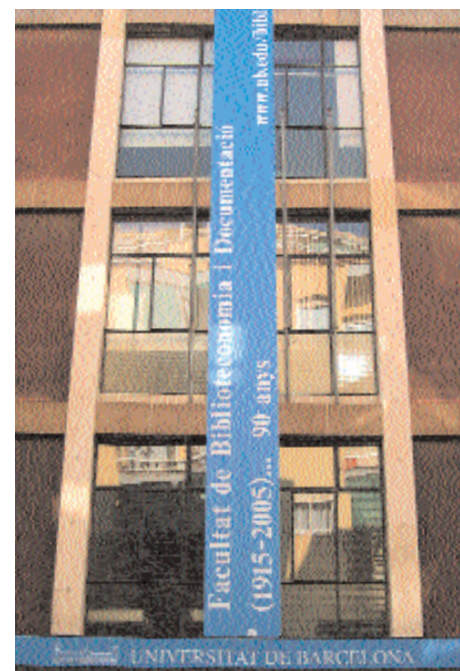
Façana de la Facultat de Biblioteconomia i Documentació (gener de 2006)

Amb la signatura del conveni d'integració a la Universitat de Barcelona, el juliol de 1997 l'Escola es traslladava provisionalment a l'edifici del carrer de Melcior de Palau, uns espais ben comunicats amb la resta del món, però bastant aïllats dels altres campus de la UB. La situació de l'edifici té molts avantatges, però també és cert que ha dificultat en certa mesura la integració de l'alumnat i del professorat en la vida universitària. Pendent d'una possible nova ubicació encara no decidida, la Facultat s'ha anat fent seus els espais i els ha anat ampliant i adaptant a unes necessitats que no han parat de créixer des que s'hi va traslladar: nous ensenyaments i programes, més professorat, noves necessitats tecnològiques, etc.