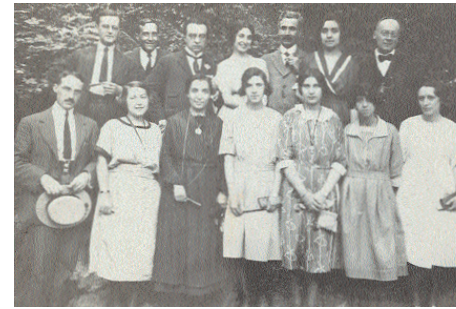
Excursió a les Planes.