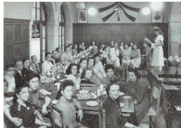
Celebració a l' Escuela de Bibliotecarias (anys quaranta)

Per a l'Escola, la victòria franquista va significar un daltabaix més gran que el que havia patit durant la dictadura anterior. Es repetiren els mateixos esquemes —cessament del professorat, canvi de pla d'estudis, castellanització absoluta—, però a final dels anys trenta la institució era més madura i sòlida. Per això, la llarga etapa següent, caracteritzada per la imposició d'una ideologia única, la mediocritat, l'estancament, la manca de mitjans i d'imaginació i l'aïllament, va fer més notòria la pèrdua ocasionada pel canvi de rumb. L'Escola de Bibliotecàries havia estat un centre docent de qualitat i coherent, ple de sana normalitat, com havia de ser. El contrast amb la sordidesa i la grisor del període posterior la van convertir en una escola llegendària per a les alumnes que hi van estudiar i per a les de les promocions posteriors.