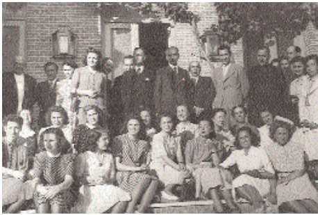
Visita de professors i alumnes de l' Escuela de Bibliotecarias al Consejo Superior de Investigaciones Científicas (Madrid, 1942)