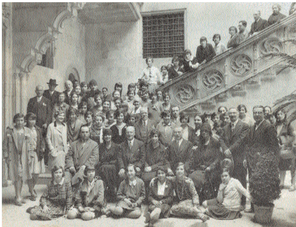
Grup d'alumnes i personal docent de l' Escuela Superior para la Mujer a l'escalinata de la Casa dels Canonges (cap al 1928)

La destitució d' Eugeni d'Ors , l'any 1920, va provocar una primera crisi en el si de l'Escola i de les biblioteques populars que no va tenir gaires conseqüències, llevat de protestes no formalitzades d'alumnes i de bibliotecàries. Va ser molt més greu la crisi que es començà a gestar el setembre de 1923 amb el cop d'estat de Primo de Rivera i que culminà el 1925 amb la supressió definitiva d'una Mancomunitat ja molt diluïda. Per a les institucions i escoles de la Universitat Industrial, el punt d'inflexió del procés de desfeta es va produir l'abril de 1924, quan, arran d'una nota despectiva del diputat Darius Rumeu adreçada al professor belga George Dwelshauvers, uns 150 professors van ser destituïts o van dimitir dels seus càrrecs en solidaritzar-se amb el professor.