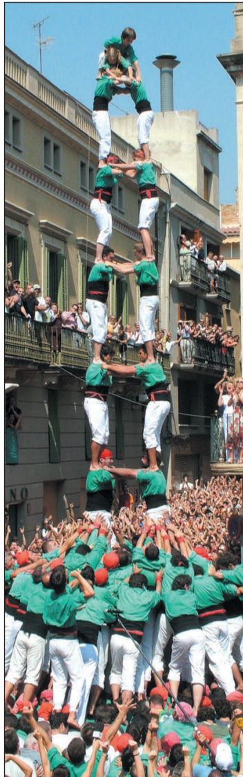
La torre de 9 verda.

Els verds porten el millor programa possible però la Colla Vella té la gamma extra preparada per si els vilafranquins fallen