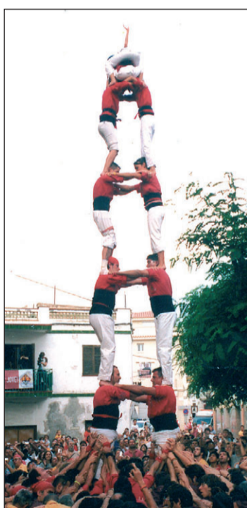
Torre de 7 dels Xicots.

Dissabte els Xicots compartiran plaça amb els Castellers i la Joves de Valls. Els vermells podrien atacar el 3 de 8 i els verds la gamma alta de 8.////