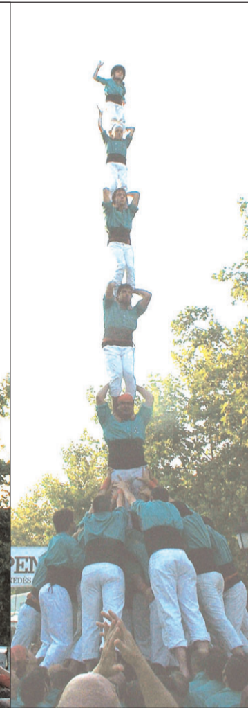
Torre de 8 amb folre, 4 de 8 amb l'agulla, 3 de 8 i pilar de 7 amb folre alçats davant el monument de la rambla Sant Francesc, dissabte en motiu del ViJazz.