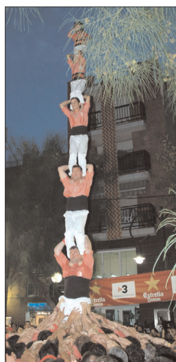
Pilar de 6 de la Colla Vella i 2 de 8 amb folre dels de Sants.

Finalment al Camp d'en Grassot (Barcelona) els de Lleida van tornar a completar el 3 de 8 i la torre de 7.////