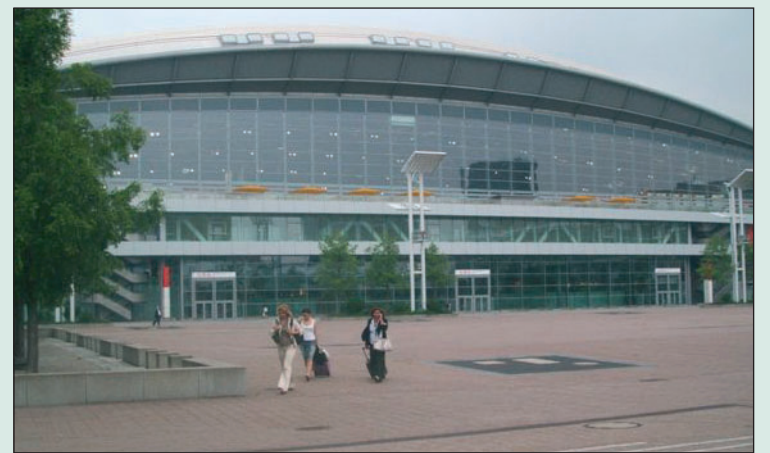
La plaça de l'Àgora, al recinte de la Fira de Frankfurt.

La plaça Àgora de Frankfurt acollirà dues actuacions, el dissabte a les 3 de la tarda i el diumenge a les 12. Les dues colles, que s'allotjaran en el mateix hotel de la ciutat, tenen previst alçar castells de 8. Les actuacions no comptaran amb un nombre de rondes determinat però sí que el temps de l'actuació està estipulat en una hora i mitja.