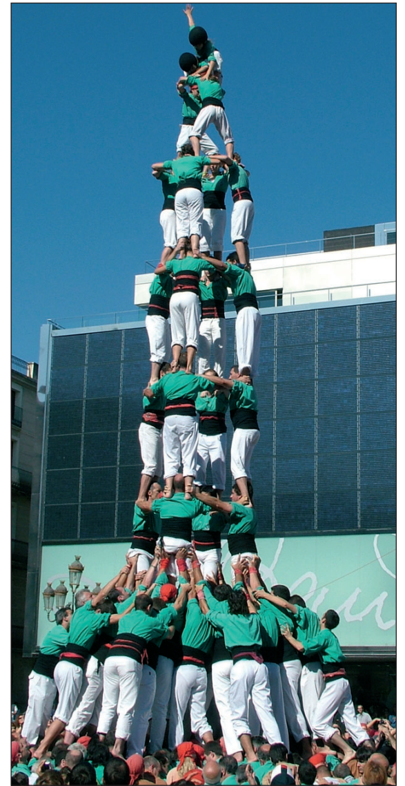
4 de 8 amb l'agulla, 3 de 9 amb folre i 4 de 9 amb folre dels Castellers de Vilafranca a la diada del Mercadal de Reus aquest passat diumenge.