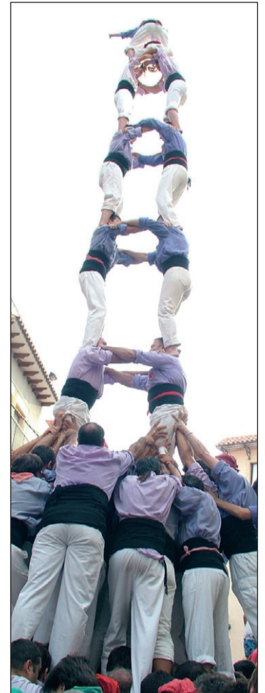
Torre de 8 amb folre i pilar de 7 amb folre dels Castellers i 2 de 8 amb folre de la Jove de Tarragona a Torredembarra.