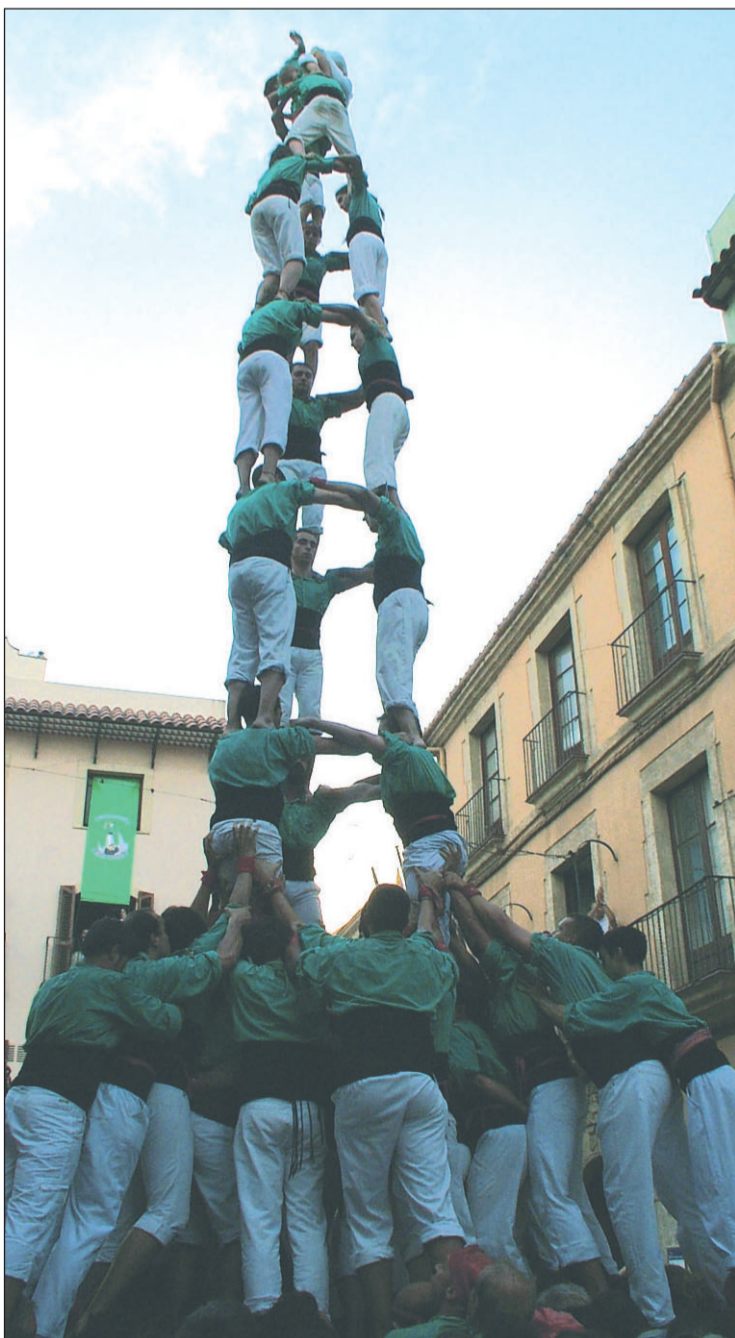
3 de 9 amb folre dels Castellers, diumenge a Torredembarra.