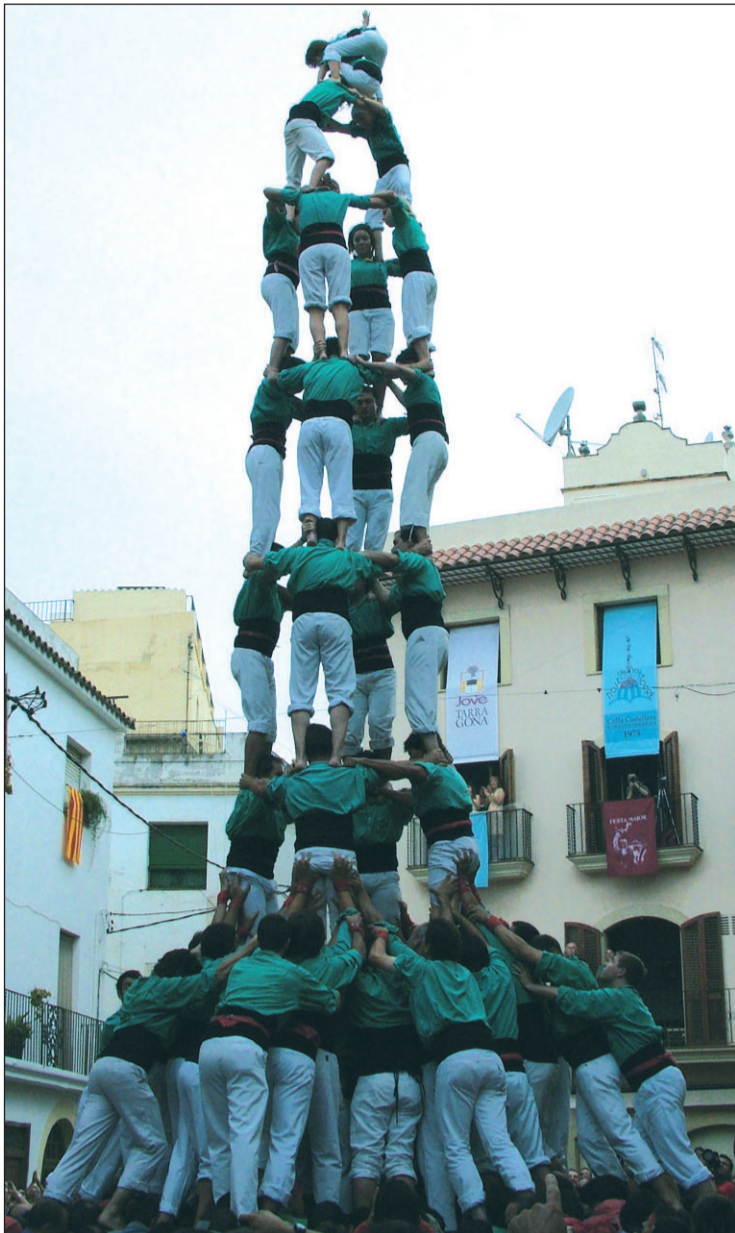
4 de 9 amb folre carregat dels Castellers, diumenge a Torredembarra.