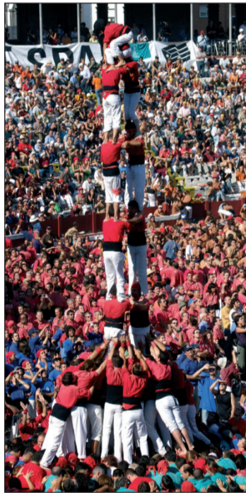
Torre de 8 dels Xicots.

En total 68 castells: 43 de descarregats, 10 de cornats, 5 intents desmuntats i 10 intents fallits entre les 18 colles assistents. Gairebé en un 80% de les construccions es van coronar.////