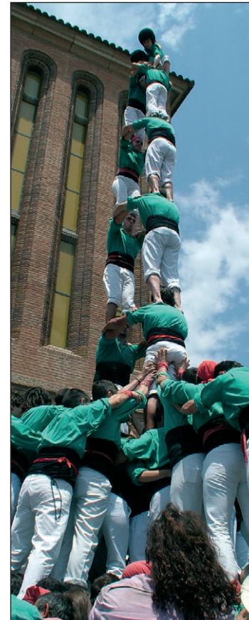
A dalt: 4 de 8 amb l'agulla i torre de 8 amb folre dels Castellers. Fotos: 7DIES A baix: Pilar de 7 amb folre dels verds i intent del 3 de 9 amb folre dels Minyons.