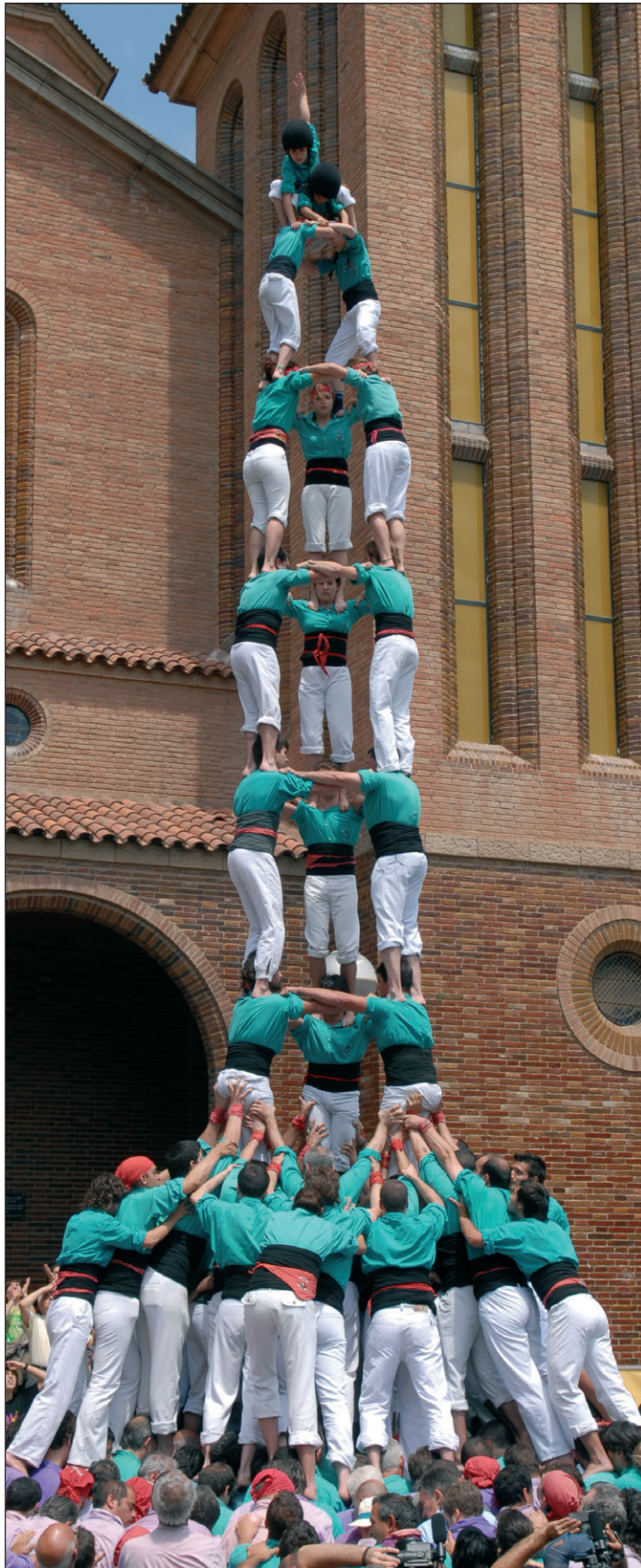
3 de 9 amb folre dels Castellers de Vilafranca, el primer del 2007.

Els de Cal Figarot van completar diumenge la millor actuació del que va d'any amb l'estrena del primer 3 de 9 amb folre del 2007 i arrodonint-ho amb castells de la gamma alta de 8