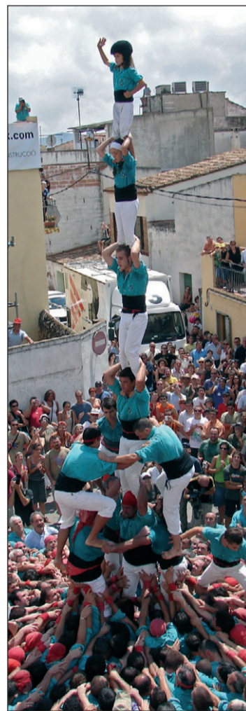
El 3 de 8 amb l'agulla.