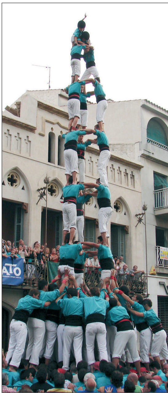
3 de 9 amb folre i 4 de 9 amb folre dels Castellers de Vilafranca, dissabte passat a la diada del Figarot.

Aquest cap de setmana nova tanda d'actuacions al Catllar i l'Arboç.////