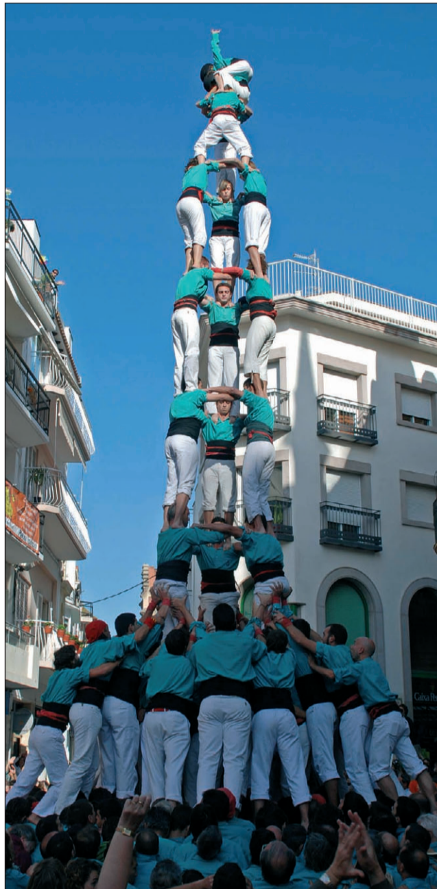
3 de 9 amb folre i pilar de 7 amb folre dels Castellers de Vilafranca, aquest passat diumenge a Sitges.

A plaça, dijous a 2/4 d'1, hi seran també els de Mataró amb ganes de fer la tripleta i els de Sants de fer el castell de 9.///