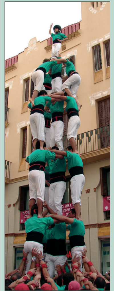
3 de 8 amb l'agulla de l'any passat a Sitges. 29/10/2006

Tot just fa un any que els verds van estrenar el 3 de 8 amb l'agulla, enguany n'han fet un i ja van pel de 9 pisos