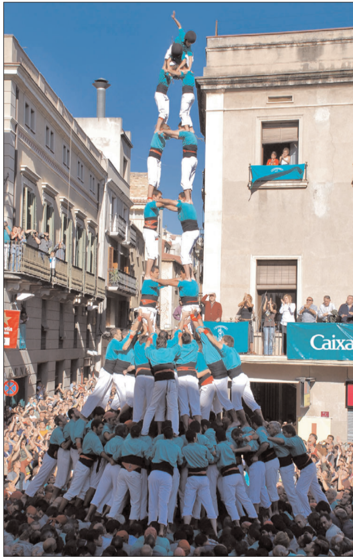
Torre de 9.

Els Castellers de Sants van provar per primer cop el 3 de 9 amb folre, per dues vegades la canalla es va fer enrera quan semblava que el podien aconseguir. Es van haver de conformar amb el seu millor repertori de castells de 8 i esperar una nova oportunitat per donar el salt.////