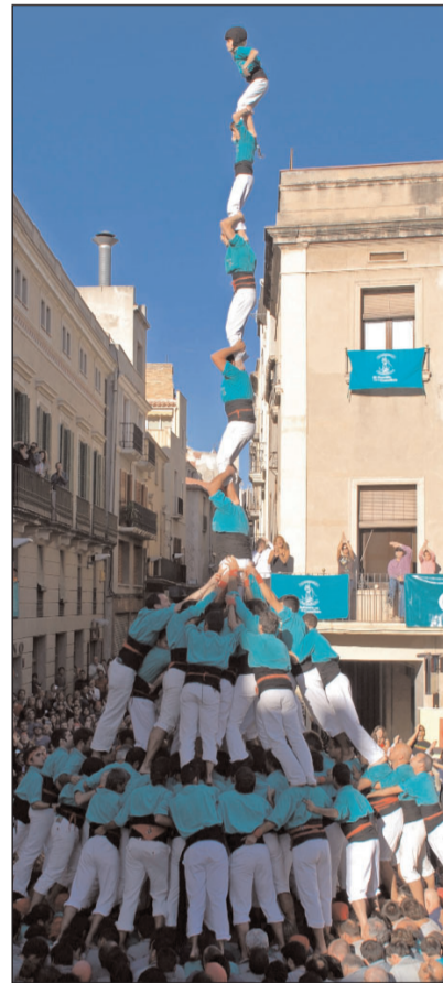
A dalt: Pilar de 8 amb folre i manilles i l'intent de 5 de 9 amb folre. A baix: 4 de 9 amb folre de Mataró i l'intent del 3 de 9 amb folre de Sants.

Des de la seva consecució, la torre de 9, no ha faltat mai en el repertori anual dels vedes i ha estat comodi per quan les coses no han sortit com s'esperava (tal com va passar dijous). Cal tenir en compte que mentre pels Castellers és un recurs fàcil per la resta de colles esdevé en un castell de màxima dificultat. A excepció dels Minyons (que enguany l'han coronat en dues ocasions) el 2 de 9 no el fan les colles de Valls des del 2001