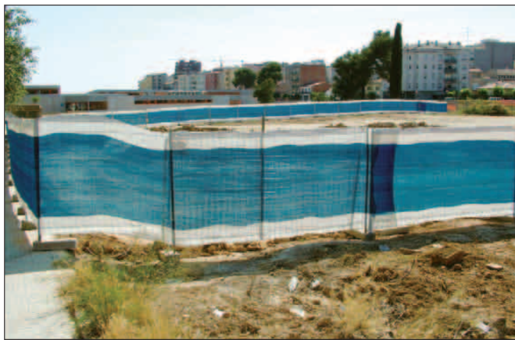
Els terrenys de la Girada on s'ubicaran els nous jutjats de la Vila.