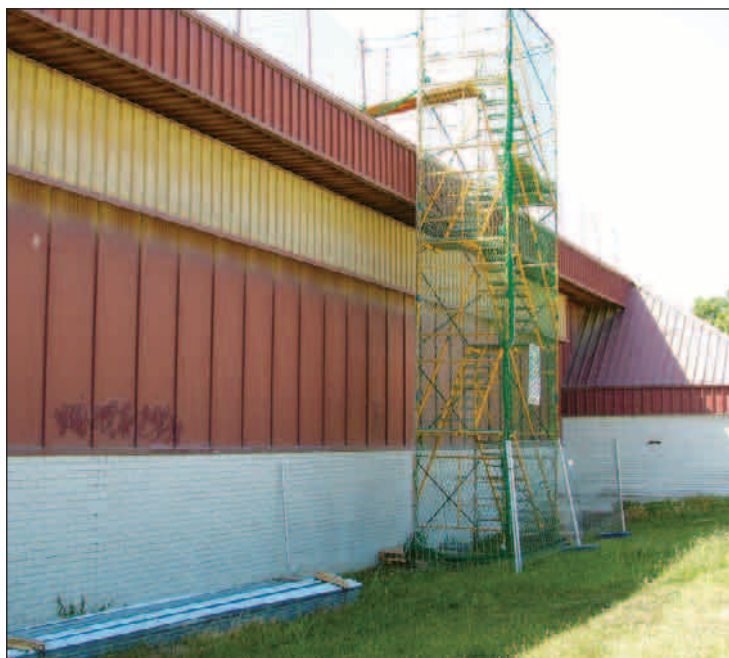
La solució definitiva és la contrucció d'una segona coberta.

La setmana passada van iniciar-se els treballs d'acondicionament de la teulada del pavelló d'hoquei de la zona esportiva de Vilafranca.