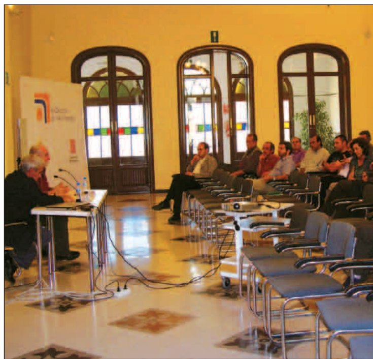
Dijous es van cloure les jornades de la fase de participació.