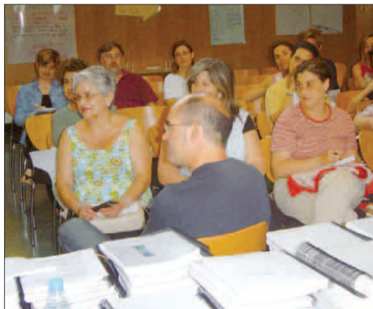
Els lectors de l'Odissea faran una primera selecció de les obres.