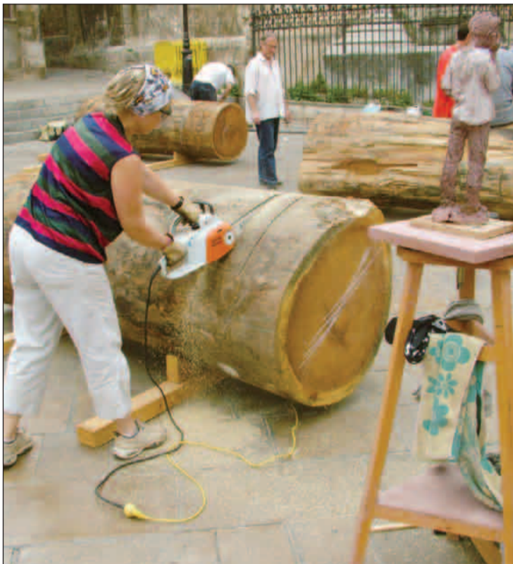
Els artistes van començar, dilluns, a treballar els materials.

Apropar el procés de creació artística al carrer és un dels propòsits del Simpòsium d'escultura