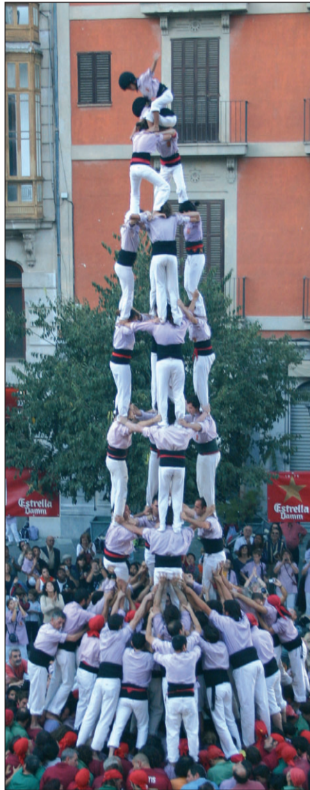
3 i 4 de 9 amb folre dels Minyons de Terrassa, dissabte a Palma de Mallorca.