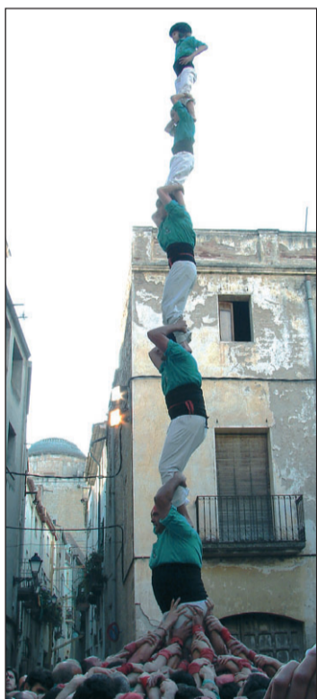
3 de 8 dels Castellers.