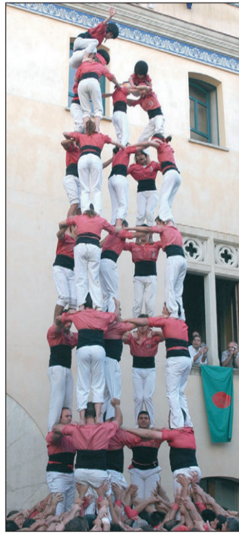
5 de 8 i 2 de 8 amb folre de la Colla Vella dels Xiquets de Valls.

Les colles de Valls s'estan mostrant més fortes que en els darrers anys a aquestes alçades de la temporada.////