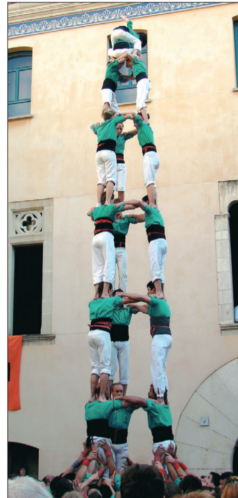
4 de 8 amb l'agulla, torre de 8 amb folre i 3 de 8 dels Castellers de Vilafranca en la diada de diuenge a la Selva del Camp.