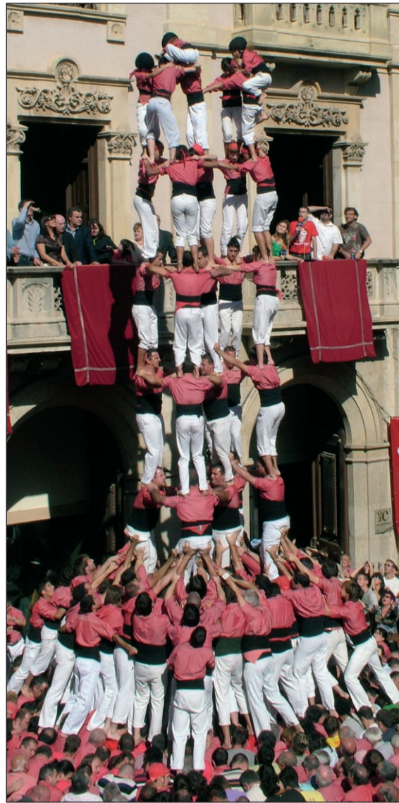
Intent de 5 de 9 amb folre de la Colla Vella i pilar de 8 amb folre i manilles de la Colla Vella a la diada de Santa Úrsula.

mental espatat l'enxaneta no va voler pujar tot i la insistència dels rosats, fet que va provocar xiulets provinents del rotllo de la Joves. Això va derivar en un intercanvi de gestos despectius, crits, insults i alguna empenta. Al final va tornar la calma i cap a casa.////