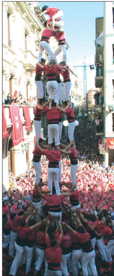
4 de 9 amb folre de la Colla Joves. 7DIES

mental espatat l'enxaneta no va voler pujar tot i la insistència dels rosats, fet que va provocar xiulets provinents del rotllo de la Joves. Això va derivar en un intercanvi de gestos despectius, crits, insults i alguna empenta. Al final va tornar la calma i cap a casa.////