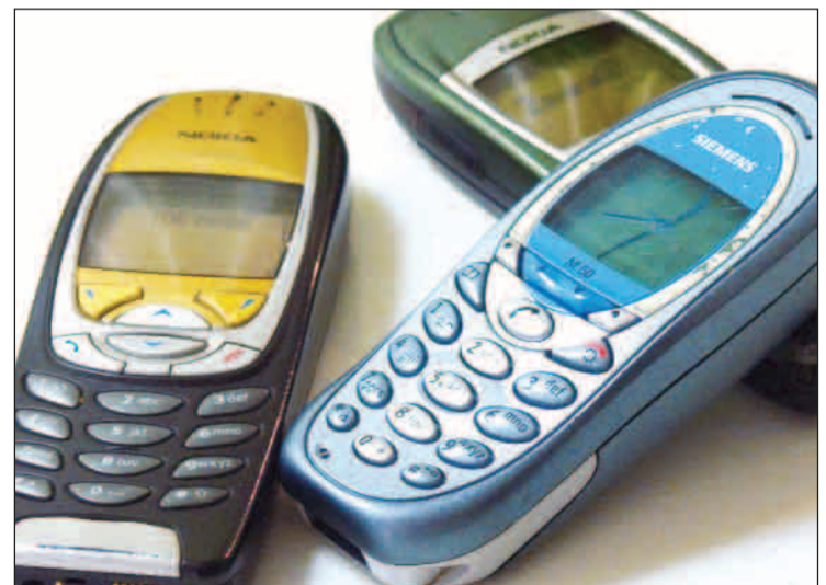
L'oficina de l'OMIC rep gran quantitat de reclamacions sobre els serveis de tarificació addicional.

L'OMIC considera que el nou reglament millora la protecció dels usuaris d'aquests serveis