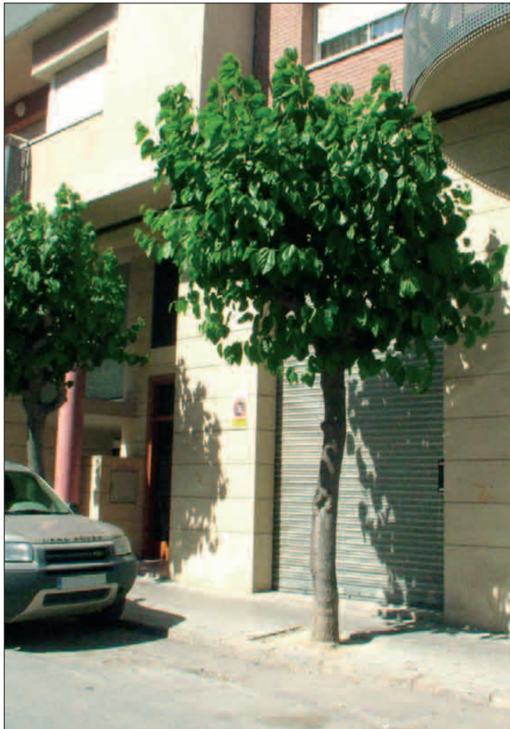
Serveis Socials es traslladarà l'any vinent al carrer Tossa de Mar.