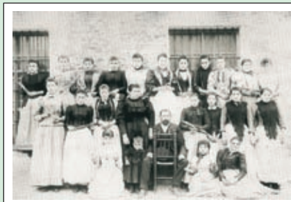
La totalitat de la plantilla del personal de la fàbrica tèxtil del Tori. Any 1894.