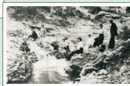
Grup familiar refrescant-se en una de les cinquanta fonts que existeixen al terme de Sant Quintí. Foto de 1912.