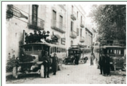
Tres vehicles per al transport de passatgers que comunicava Sant Quintí amb tots els pobles de la comarca. Anys vint.

Ens posarem d'acord per tal de recollir les seves imatges (o negatius fotogràfics), les reproduïrem i l'hi retornarem d'immediat.