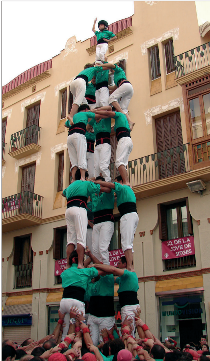
El 3 de 8 amb l'agulla dels Castellers de Vilafranca, el primer de la història.

Per la seva banda els de Sitges van revalidar el 4 de 8 i els de Sants la torre de 8 amb folre. ////