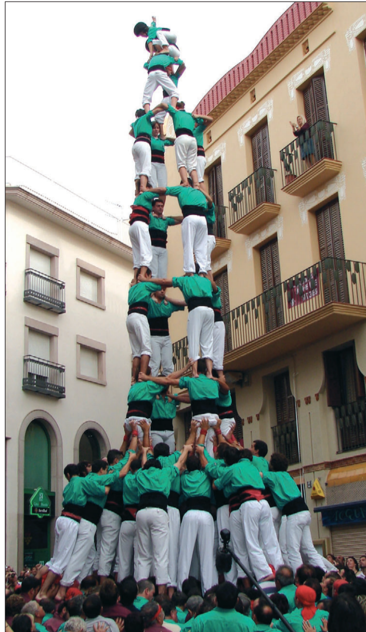
El 4 de 9 amb folre descarregat número 100 en la història dels Castellers.