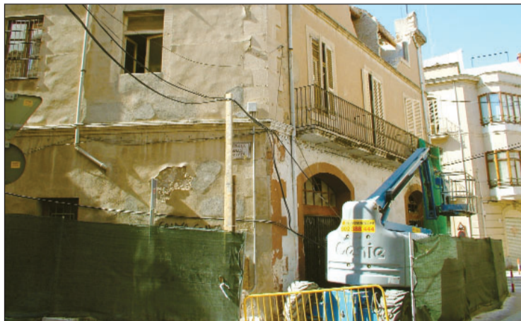
L'immoble del carrer Ferrers cantonada Muralla dels Vallets.