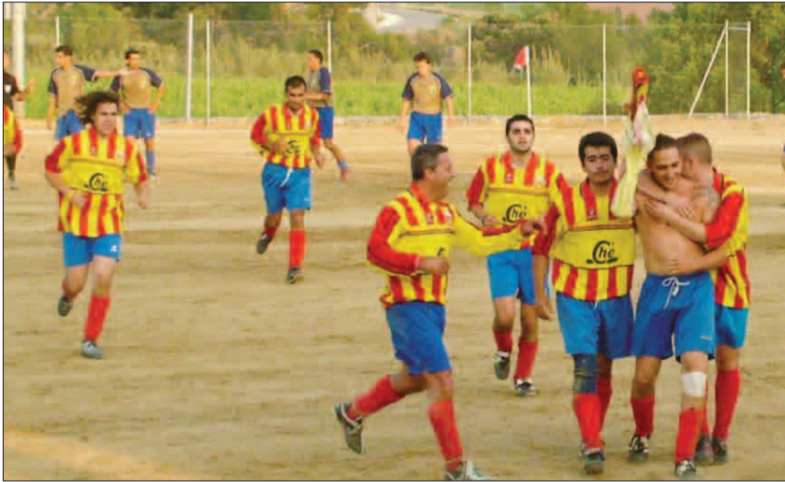
Els jugadors de la Múnia celebren el cinquè gol davant el Molanta.

Aquest dissabte es van disputar els primers dos partits de quarts de final de la Copa Ràdio Vilafranca.