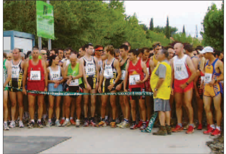
La cursa preveu superar els 500 participants.