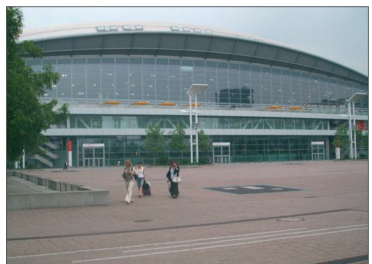
Les dues colles actuaran en una monumental plaça del recinte firal.

D'altra banda el viatge del president dels verds a Alemanya ha servit per continuar els contactes que els han de portar el proper mes de gener a Xile.////