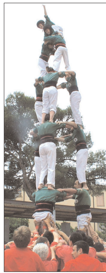
3 de 7 per sota dels de Sant Cugat i 3 de 7 dels de l'Arboç.