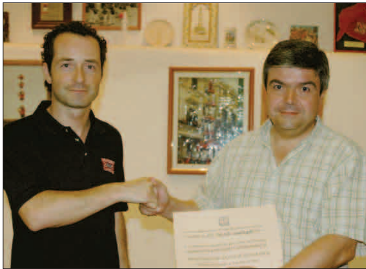
Els presidents, dels Xicots i de la Creu Roja, en el moment de l'entrega del taló solidari.

A Vilafranca, a la rambla, s'hi van concentrar de bon matí i després a l'hora del vermut. ////