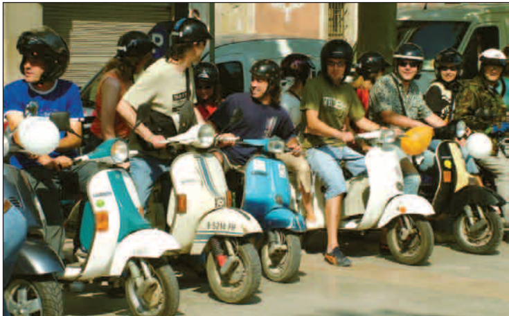
Les vespes continuen aixecant passions malgrat el pas del temps.

Vespes d'arreu del país es van citar aquest diumenge al matí a Vilafranca en la 5a trobada de motos d'aquesta marca. Els propietaris van fer un tomb per la