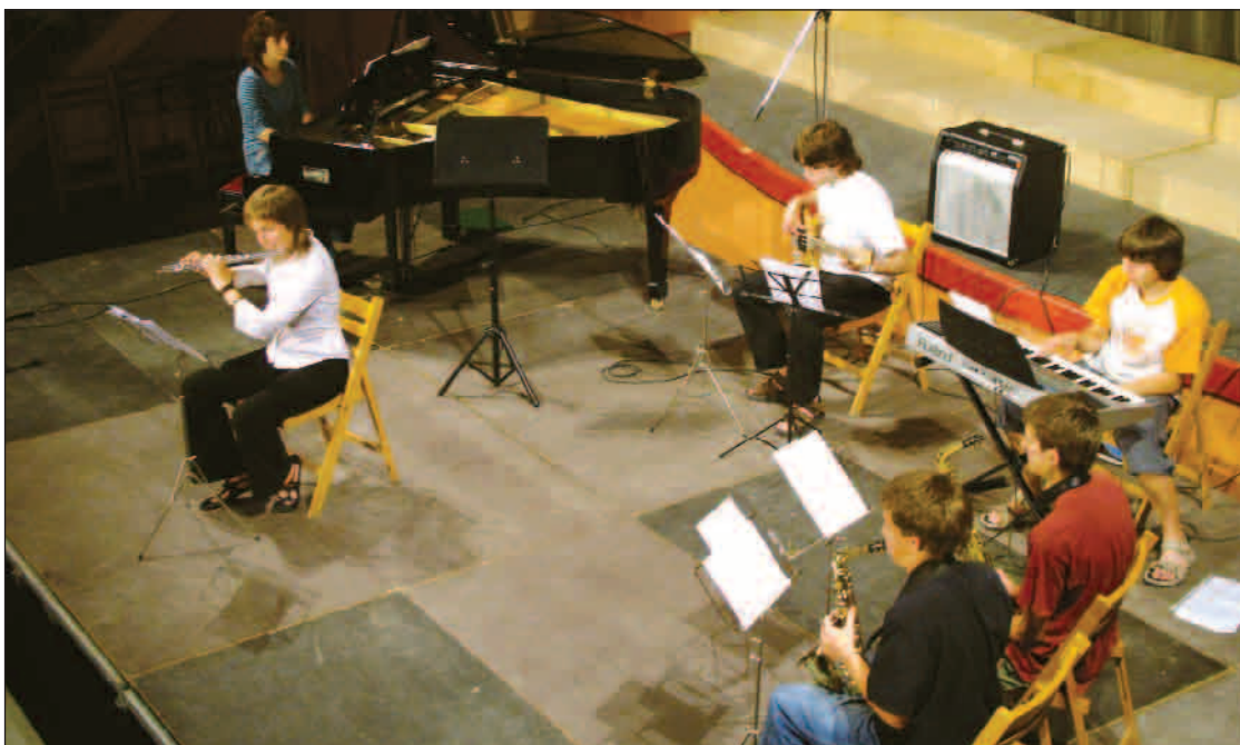
Moment del concert de fi de curs de l'EMM M.Dolors Calvet, dissabte passat al teatre municipal.