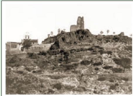
Les ruïnes del castell de Subirats, en començar el segle XX.

Ens posarem d'acord per tal de recollir les seves imatges (o negatius fotogràfics), les reproduïrem i l'hi retornarem d'immediat.