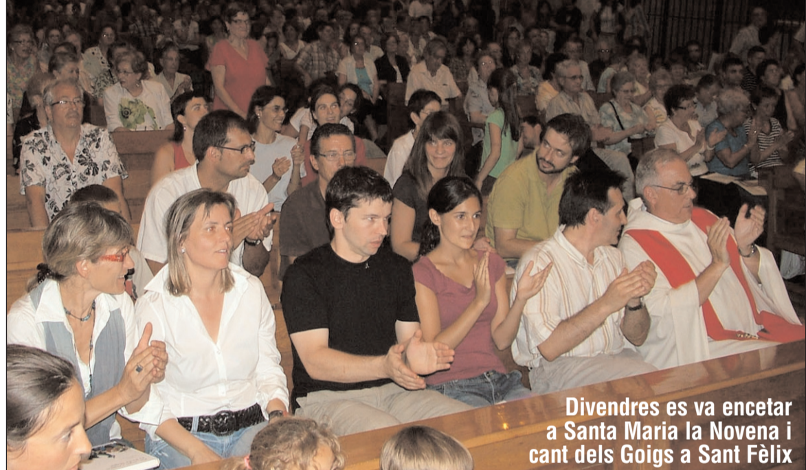
Divendres es va encetar a Santa Maria la Novena i cant dels Goigs a Sant Fèlix