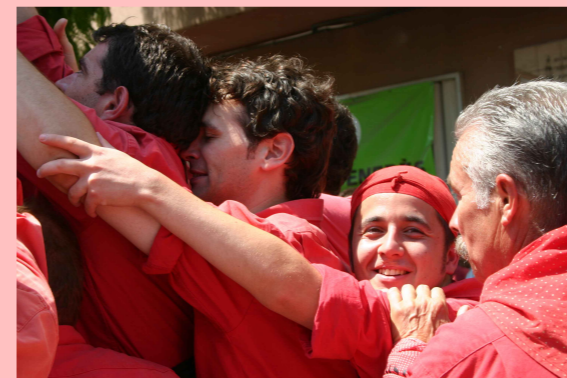
Coordinació: Olga Olivé Textos: Olga Olivé, Alfons González, Xavier Guardiola

Ara toca treballar de valent. Amb la mirada posada al concurs i la fira, la tècnica s'ha proposat treballar a fons els castells de vuit. De tots nosaltres depen que poguem repetir aquest any també com a colla de vuit. A més, l'equip del pilar ha intensificat encara més la seva preparació i les sensacions són també força positives. Nens! ara és el moment de donar pit i no perdre's cap assaig! Com veureu dins el butlletí, a més, assistir a aquests darrers assajos enguany té premi!