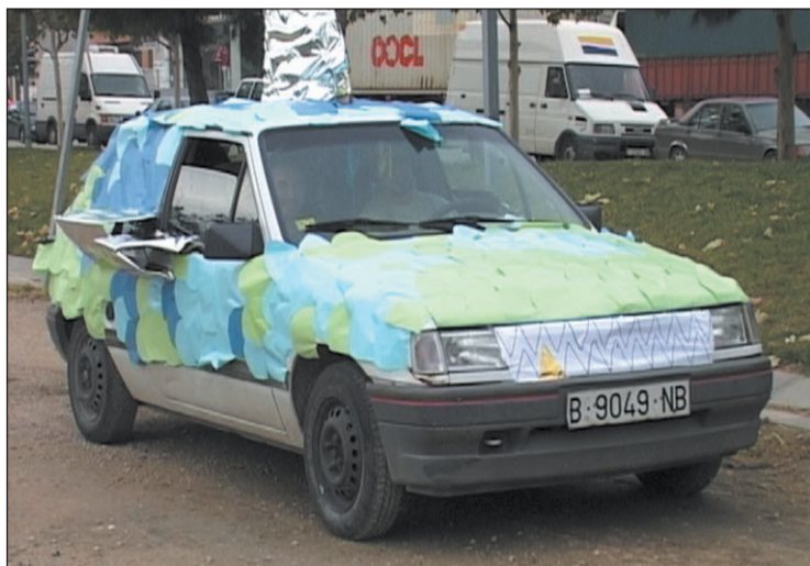
Un dels cotxes participants del 14è Ralli dels Falcons.