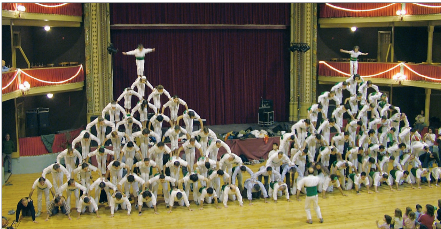
Les dues escales de 9 simultànies aixecades diumenge pels Falcons de Vilafranca al saló d'actes de la societat la Principal en la diada del seu aniversari.

Els falcons també van alçar nou pilars de 3 nets simultanis, una piràmide de drets de 5 flanquejada per dues torretes, un 3 de 6 net simultaniament amb una pira 4x4 i una estrella (pira/castell). Un pilar de 5 aixecat per sota amb dos pilars de 4 nets al costat va cloure la seva actuació. ////