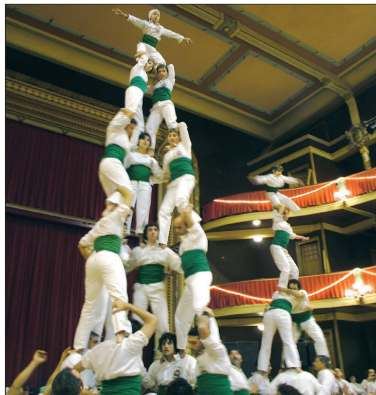
La piràmide de drets de 5 amb una de les dues torretes simultànies.

Els actes del 46è aniversari van finalitzar aquest diumenge amb la gran actuació falconera, una cercavila amb traca i vermut popular per tothom.