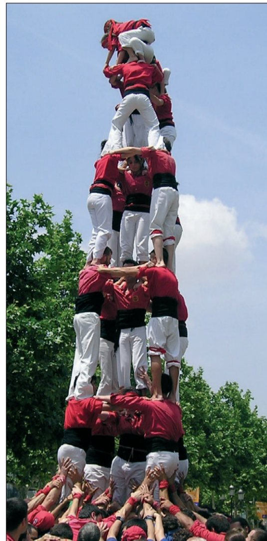
4 de 8, torre de 7 i 5 de 7 dels Xicots de Vilafranca a la diada del Firal celebrada diumenge passat a la Rambla Sant Francesc.