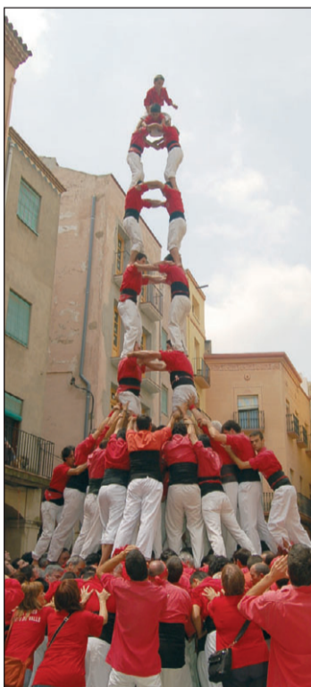
2 de 7 dels de Tarragona i 2 de 8 de la Joves.

VINE A PASSAR L'ESTIU AMB NOSALTRES Casal d'estiu a Mas Cavalls tots els matins de juliol i agost