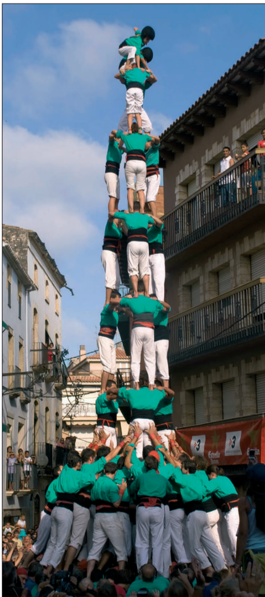
3 de 9 amb folre, a l'esquerra el de Torredembarra i a la dreta el d'Altafulla.

Dissabte els va caure accidentalment el 3 de 9 amb folre una cop coronat, diumenge van descarregar-lo a Altafulla sense problemes