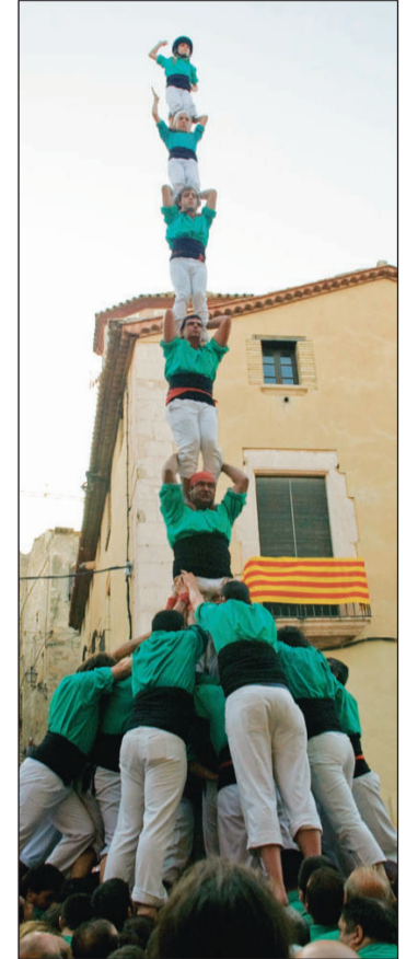
5 de 8 a Torredembarra i pilar de 7 amb folre a Altafulla.