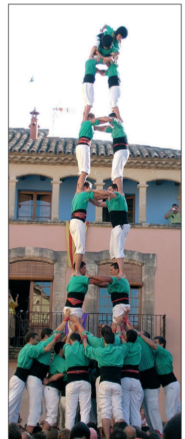
4 de 8 amb l'agulla i torre de 8 amb folre a Altafulla.