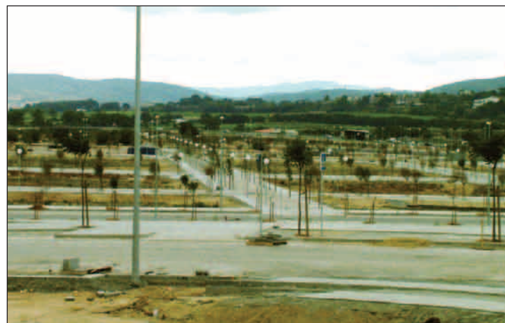
El sector de la Girada II presenta aquest aspecte actualment.

contenidors per a la recollida selectiva de residus domèstics i incorporar espai per aparcament de bicicletes. Altres trets comuns a la Girada II seran que els aparells d'aire condicionat s'ubicaran a la coberta de l'edifici i que tots els blocs de més de 8 habitatges disposaran de plaques solars. Per Josep Colomé, aquest seguit de mesures voler ser "una regulació estricta que ha de definir l'espai com a sostenible". ////