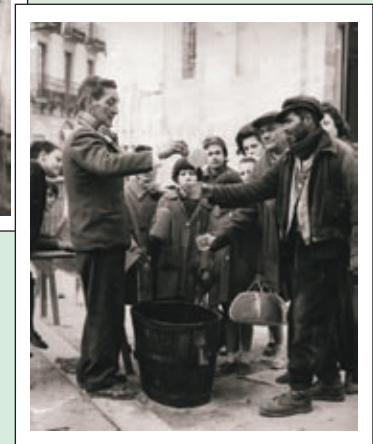
Per la festivitat de Santa Llúcia s'oferia escudella i carn d'olla a tots els que ho necessitaven. També s'acompanya l'àpat amb un got de vi. Any 1958.