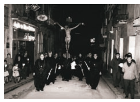
Processó del Divendres Sant al seu pas pel carrer Major. Anys seixanta.