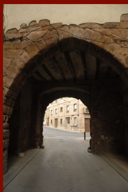
Portal de Sant Miquel