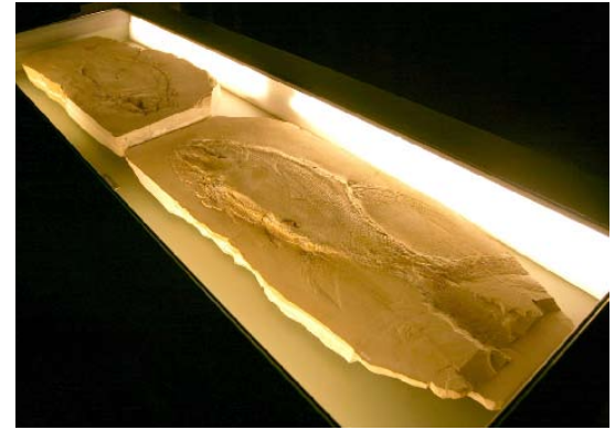
Exemplar fòssil de la col·lecció paleontològica, Perleidus giganteus