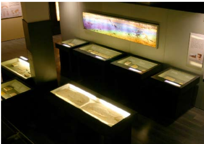
Mostra de l'àmbit Alcover-Mont-ral.

"EL MUSEU HA VOLGUT DONAR LA DIMENSIÓ QUE MEREIX UNA COL·LECCIÓ D'AQUESTES CARACTERÍSTIQUES: UN MUNTATGE EXPOSITIU DE LA SALA DE FÒSSILS QUE COMBINA UN DISCURS MUSEOGRÀFIC MODERN I ENTENEDOR"