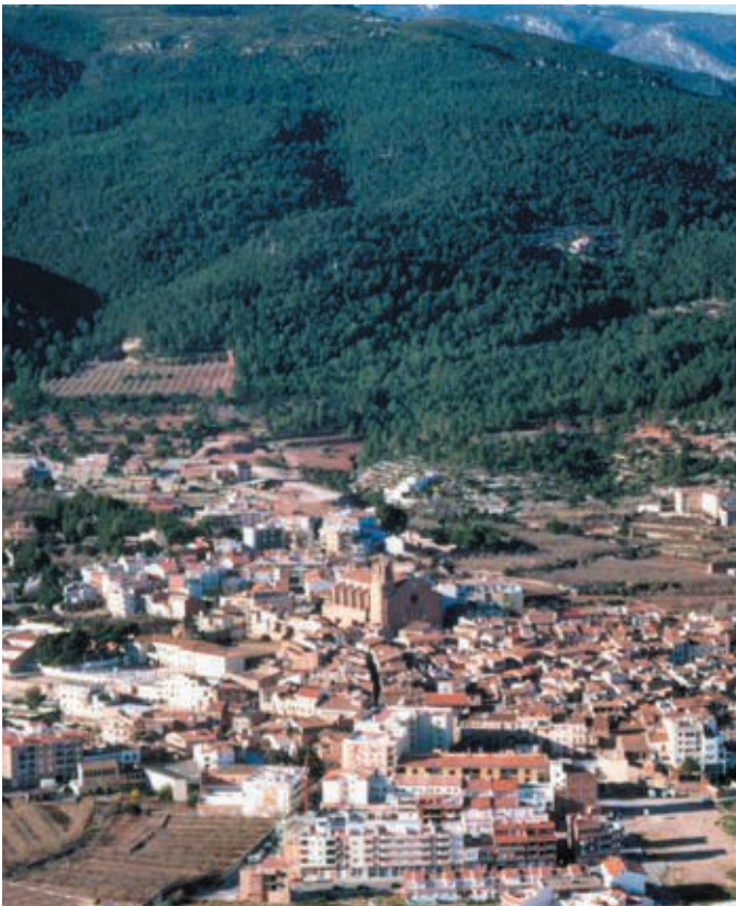
Alcover es troba a la zona de contacte entre les muntanyes de Prades i el Camp de Tarragona.

A l'interior del Camp de Tarragona, Alcover es troba ben comunicada amb Tarragona, Reus, Valls i Montblanc així com els nuclis de l'eix turístic de la Costa Daurada. L'existència d'un important patrimoni natural i cultural, la vall del Glorieta dins el futur parc Natural de les Muntanyes de Prades, el creixement poblacional, el manteniment d'un nucli antic amb valors arquitectònics d'interès, i la ja habitual presència de visitants fan que Alcover actualment plantegi els seus pilars de promoció turística que passen pel reconeixement dels valors de la seva identitat.