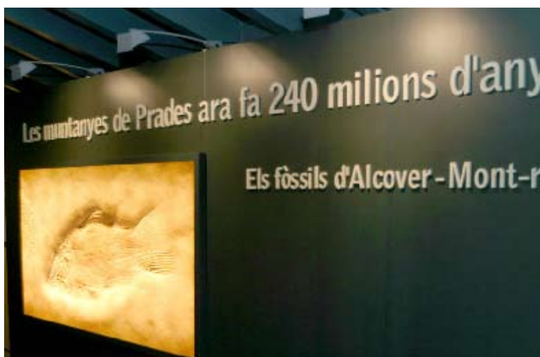
Plafó de presentació de l'exposició.

L'oferta que ofereix aquesta sala d'exposició permanent no se cenyeix únicament i exclusiva a la presentació dels exemplars més emblemàtics de la seva col·lecció. L'exposició combina un discurs museogràfic modern i entenedor, mitjançant text escrit i fotografia i amb la possibilitat de gaudir d'una visita guiada en què es descobreix al públic, allò que queda ocult als ulls del visitant. S'explica com és l'origen d'aquesta col·lecció, com i quan es varen descobrir els primers exemplars, i de retruc, la realitat patrimonial d'una explotació a l'aire lliure. Concretament, d'unes pedreres d'on s'extreu l'anomenada pedra d'Alcover que de manera fortuïta i al llarg de les darreres dècades convertiria els picapedrers en improvisats paleontòlegs, vertaders artífexs d'una troballa sense precedents, un patrimoni paleontològic de gran valor científic i cultural i un clar referent per a la vila.