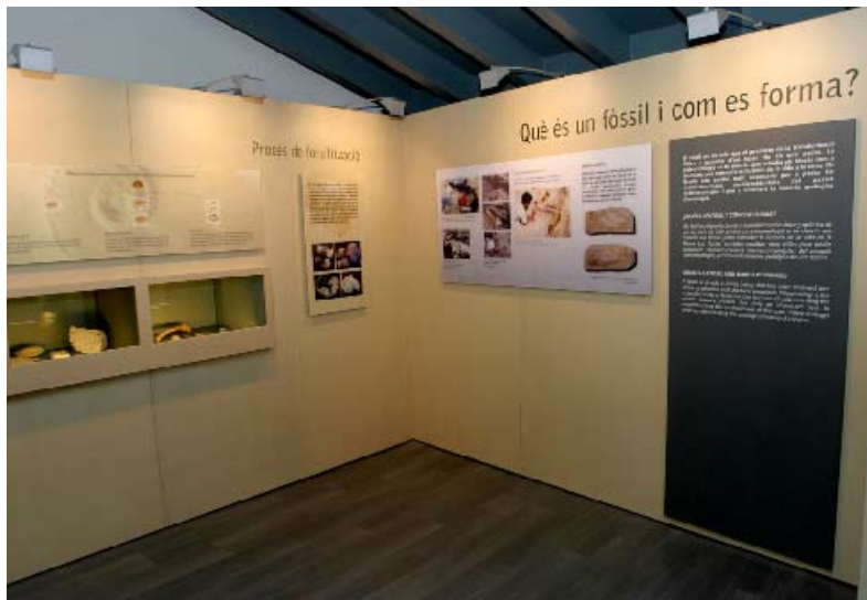
Vista de la sala de paleontologia. Què és un fòssil i com es forma?

És per això que des del museu s'ha volgut donar la dimensió que correspon a una col·lecció d'aquestes característiques, i s'ha creat i dissenyat tot un nou muntatge expositiu de la sala de fòssils que, sota el títol: "Les muntanyes de Prades ara fa 240 milions d'anys. Els fòssils d'Alcover-Mont-ral", convida el públic a gaudir de l'important patrimoni paleontològic del jaciment fossilífer d'Alcover-Mont-ral.