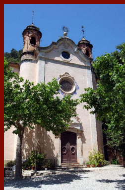
Ermita del Remei