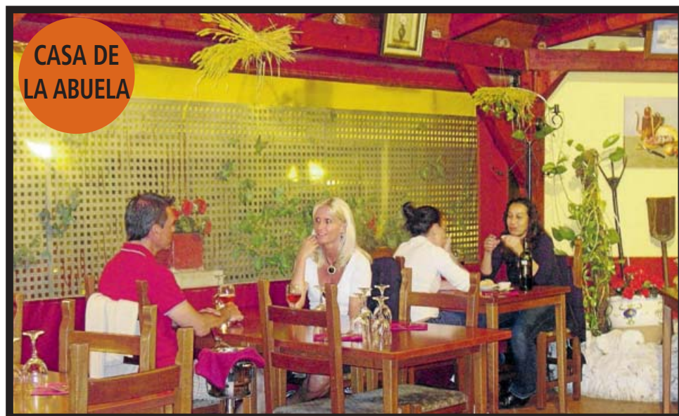
CASA DE LA ABUELA

CASA DE LA ABUELA. TELÉFONO: 971 40 42 06 C/ MIQUEL ROSSELLÓ ALEMANY, 7. CALA MAJOR (PALMA). ABIERTO DE LUNES A DOMINGO.