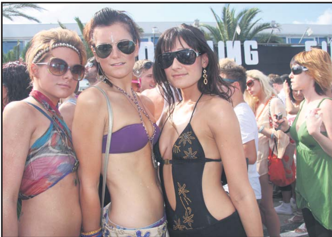
EN LA APERTURA LAS COLAS SON MUY LARGAS, PERO HACES AMIGOS

VIAJE A LA APERTURA DE SPACE WWW.SPAC-IBIZA.COM VIAJES POLUX, CI INDUSTRIA, 54