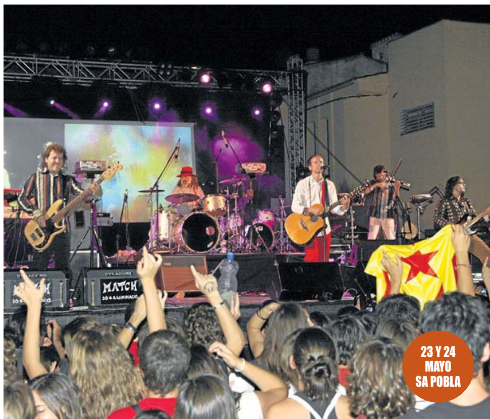
ELS PETS, UNO DE LOS GRUPOS QUE SIEMPRE HA ARROPADO EL 'ACAMPALLENQUA'