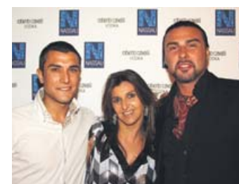
FIESTA CAVALLI EN NASAU

TOUS I MAROTO, 4 BAJOS JOAN MIRO, 72 TELEFONO 971 22 79 63