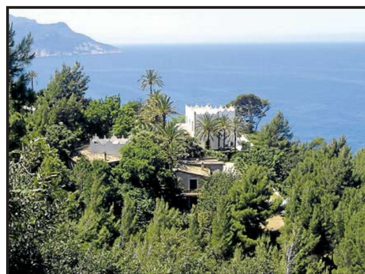
S'ESTACA ESTÁ CONSTRUIDA AL ESTILO SICILIANO.

por diseñar la edificación de las tres plantas. Está construida al estilo siciliano, con una crestería que remata el perfil de la azo-