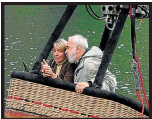
REDESCUBRIR LA VIDA A VISTA DE PÁJARO.