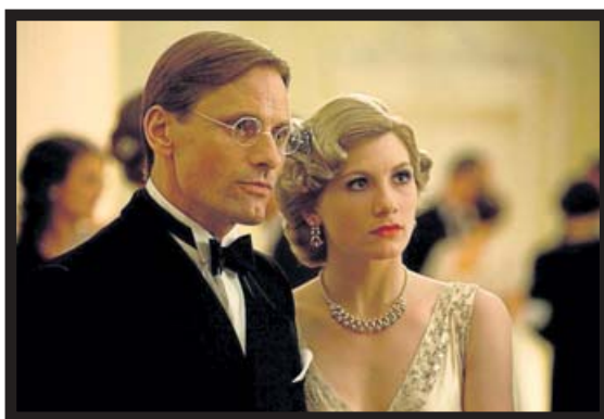
MORTENSEN SÓLO ESCRIBIÓ UN ENSAYO. LOS NAZIS LO CONVIRTIERON EN SU BANDERA INTELECTUAL.