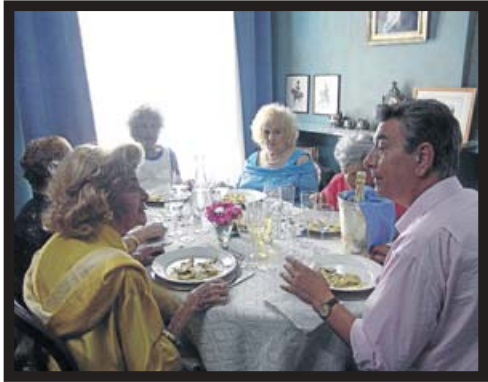
LA VIDA, CON ANCIANAS, ES MÁS BELLA.