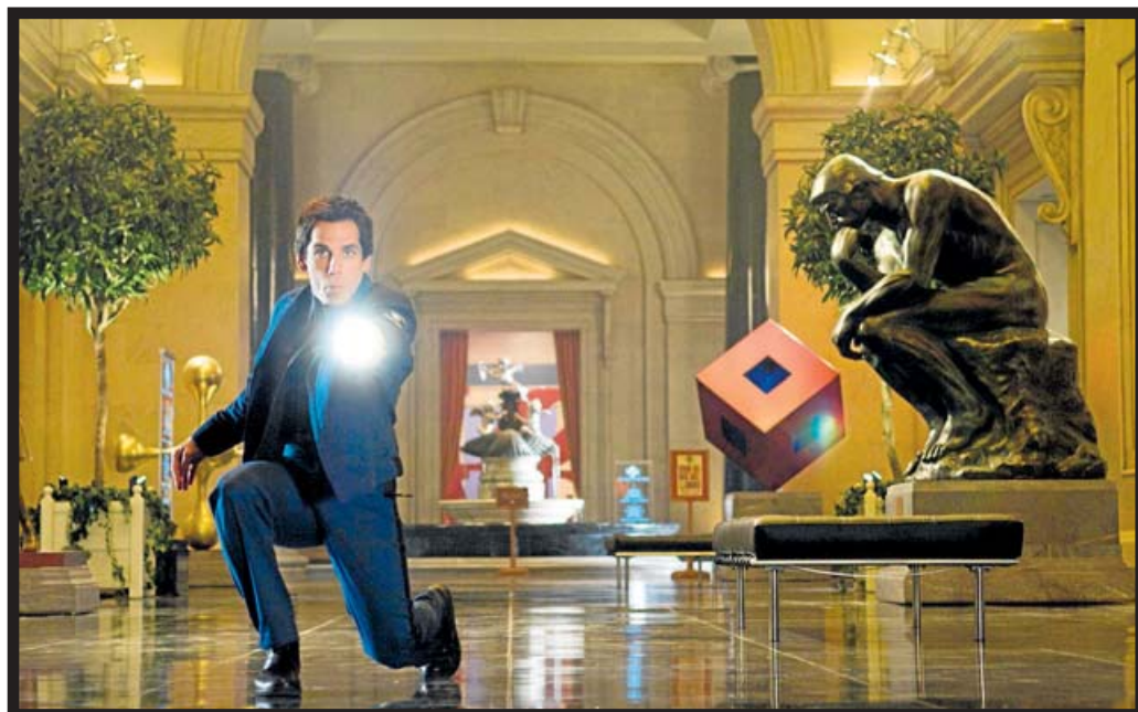
STILLER VUELVE AL MUSEO DE HISTORIA NATURAL PARA SEGUIR JUGANDO CON LOS MUERTOS.

Reconvertido a inventor de productos para publirreportajes, Stiller regresará nostálgico al lugar de los hechos, descubriendo que sus 'piezas' favoritas han sido consideradas obsoletas y esperan ser almacenadas. Entre ellas —de nuevo resucitadas— ha comenzado además una guerra por el control del museo, con dos bandos liderados por Roosevelt (Robin Williams), Octavio (Steve Coogan), Sacajawea (Mizuo Peck), Atila (Patrick Gallagher); y Kahmunrah (Hank Azaria), Iván el Terrible (Christopher Guest), Napoleón Bonaparte (Alain Chabat) y Al Capone (Jon Bernthal).