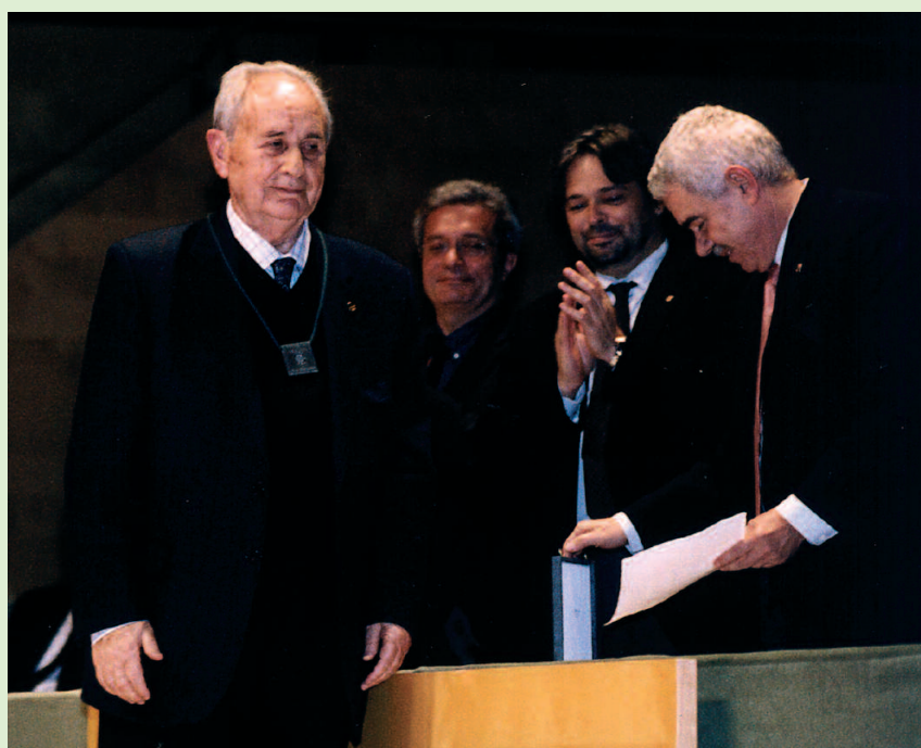
El desembre del 2004 va rebre la Creu de Sant Jordi