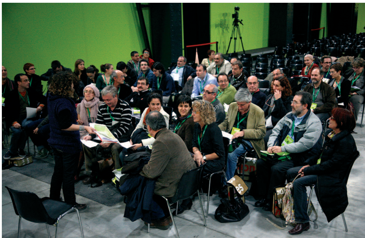
Les diferents comissions van debatre el document d'organització i les normes bàsiques d'ICV

Finalment, el document d'organització i de modificació de les Normes Bàsiques d'ICV va ser aprovat amb 351 vots a favor (91%), 28 abstencions (7%) i 7 vots (2%) en contra.†