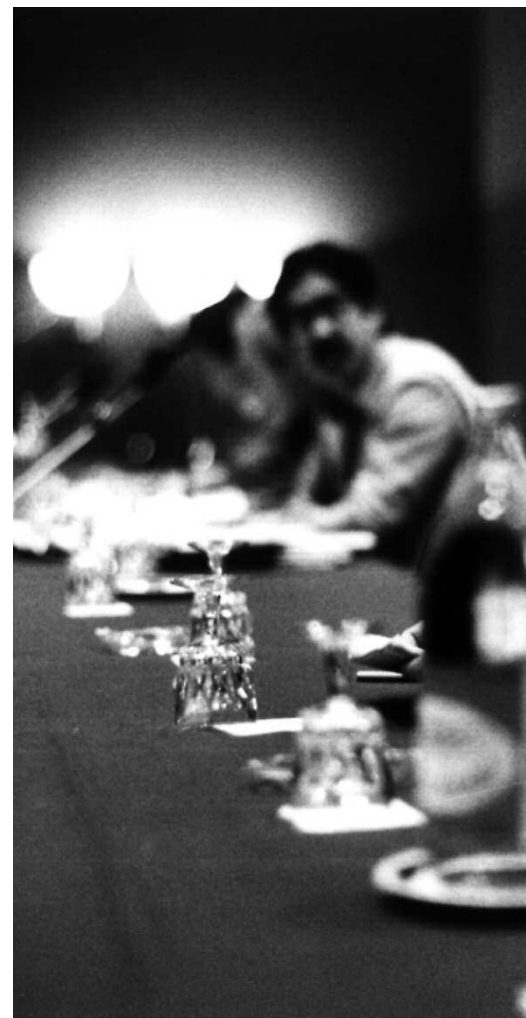
Miguel Núñez és un referent polític en la lluita per la dem

Després de deixar les Corts Generals Miguel Nuñez es dedicà a la cooperació internacional fundant i presidint l'associació Las Segovias per a la Cooperació amb l'Amèrica Central. L'any 1993 va rebre el premi Ciutat de Barcelona de Cooperació i el 1998 se li va lliurar la Medalla d'Honor de la ciutat de Barcelona. El 2004 el Govern de Catalunya va atorgar-li la Creu de Sant Jordi. ▸