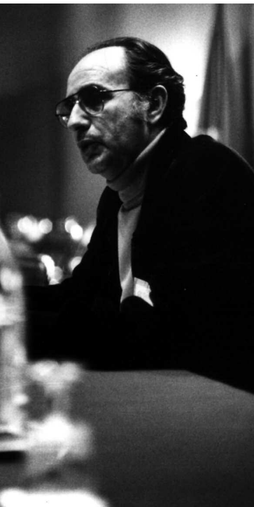
ocràcia d'aquest país

Gràcies Miguel, no t'oblidaré, no t'oblidarem.