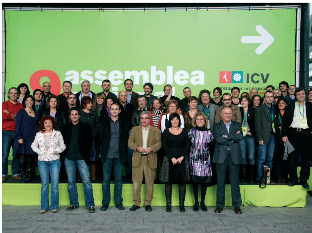
Imatge dels integrants de la nova Comissió Executiva d'ICV

La nova Comissió Executiva Nacional, que haurà de liderar el partit durant el nou mandat, va ser aprovada amb el 75,8% de vots a favor, el 13,4% de vots en contra, el 9,6% de vots en blanc i un 1,1% de vots nuls.