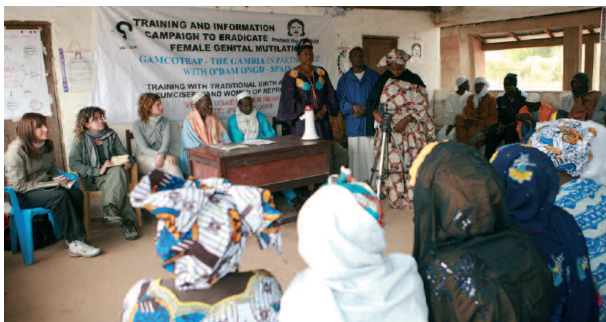
Imatge d'un dels tallers realitzats a Gàmbia

L'any passat, dins el Programa de Seguretat contra la Violència Masclista, es va elaborar un protocol intern policial que defineix l'àmbit d'actuació, els grups i la metodologia que fan servir els Mossos d'Esquadra a tot Catalunya davant les mutilacions genitals que pateixen especialment nenes.