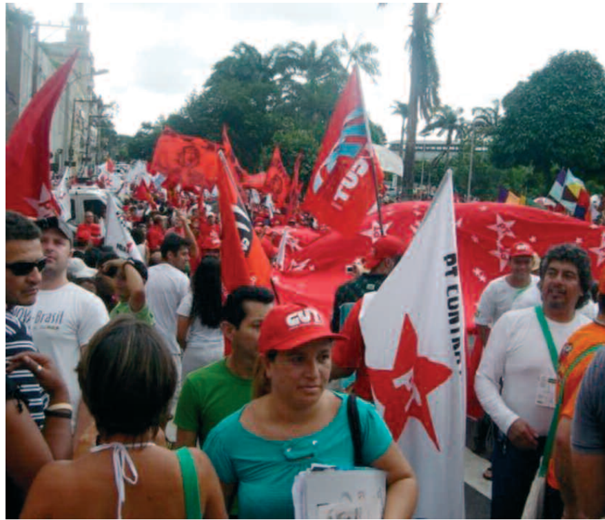
Manifestació d'inauguració del Fòrum Social Mundial 2009

El FSM és ja un grup de pressió als poders establerts i d'influència en l'opinió pública. És com un think tank , on no només hi sorgeix pensament alternatiu al capitalisme, sinó una fàbrica de nous intel·lectuals, de multiplicació d'activistes, de consolidació de militants i de captació de nous simpatitzants. No crec que el Fòrum sigui un contrapoder, perquè en ell no hi ha qui ostenti el poder doncs es tracta d'una organització horitzontal. Tanmateix, qui hi participa, diversos milions de persones des de l'any 2001, és qui exerceix aquesta funció de contrapoder, en el seu barri, ciutat, nació o Estat. El Fòrum és una escola de nous polítics, però que no només aprenen sobre política, sinó sobre el que hauria de ser prioritari per als polítics, millorar la vida de tots els qui vivim en aquest planeta, i el que és més important, sobre noves formes de fer política, sense cobdícies, ànsies de poder o protagonismes. El Fòrum és la universitat popular, d'aprenentatge col·lectiu, on tothom es converteix en mestres i alumnes, on totes les experiències són vàlides, on tots els punts de vista són escoltats. A més, és un espai obert, on qualsevol persona és benvinguda.