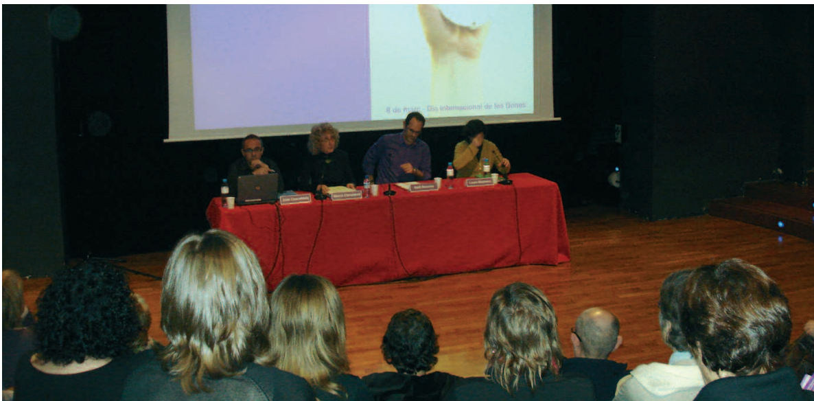
En commemoració del 8 de març, Dones amb Iniciativa va organitzar l'acte central de la campanya "La crisi també té rostre de dona"