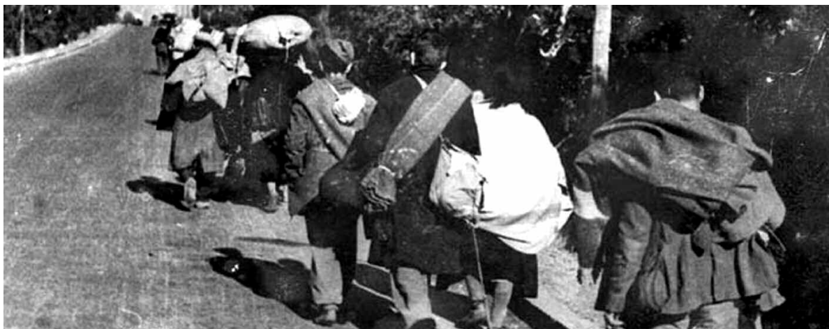
Catalans i catalanes cap a l'exili a França, l'any 1939