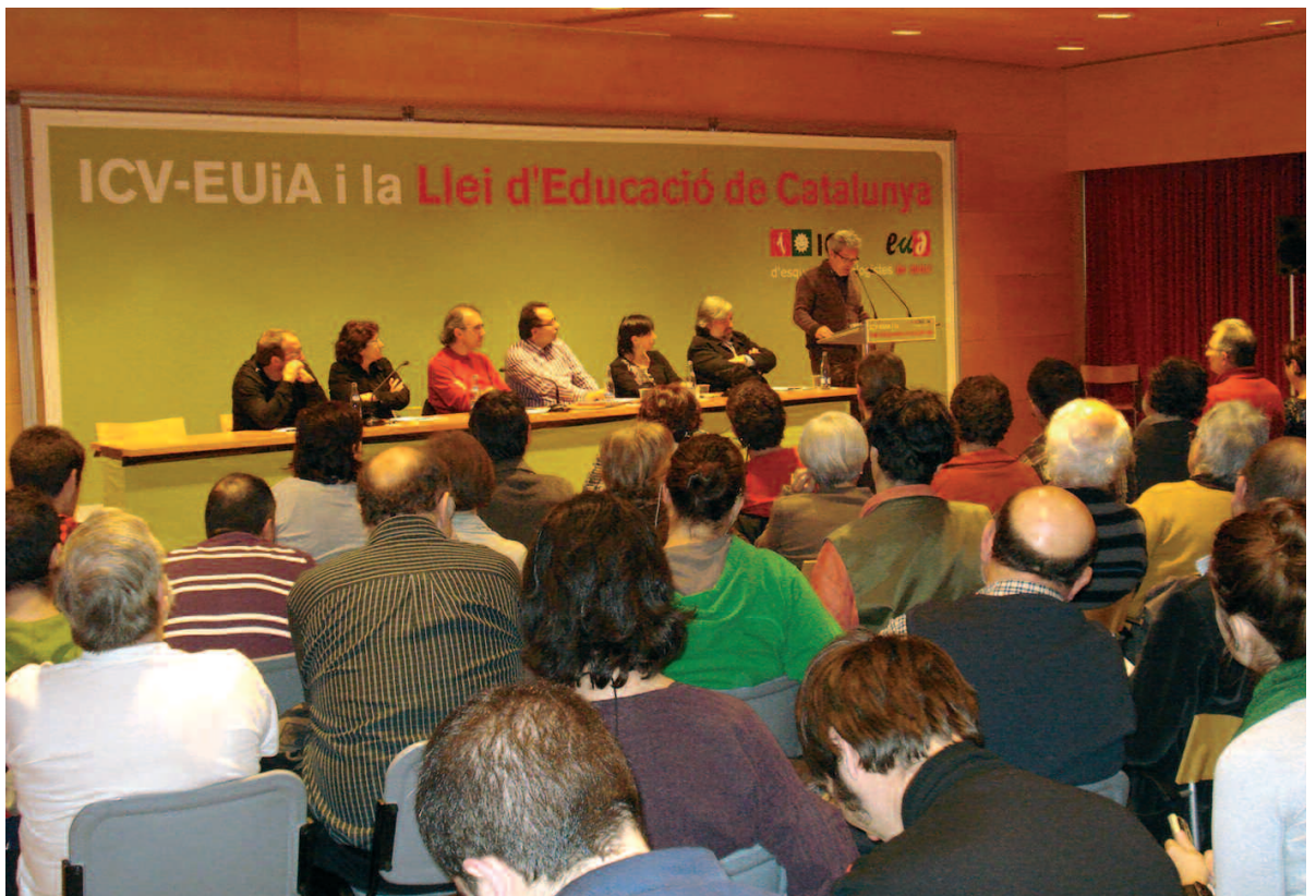
A les jornades hi va participar un gran nombre de militants i simpatitzants d'ICV

Aquestes esmenes presentades, que estan estructurades en tres eixos, pretenen que la LEC sigui hereva del PNE i capaç de generar acord amb la comunitat educativa. El primer eix sobre el que insisteixen les esmenes presentades respon a la necessitat d'aconseguir la igualtat de drets i d'oportunitats entre centres. Per aconseguir-ho cal l'establiment d'un Servei Públic d'Educació (tal com diuen la LOE i el PNE) i establir clarament les obligacions per formar-ne part; en cap cas deixar-ho únicament com a principis generals, que és com indica l'actual redactat.