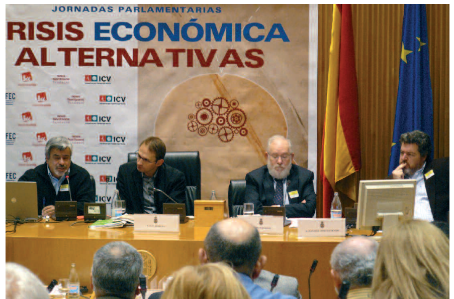
ICV i IU van organitzar les jornades sobre crisi econòmica i alternatives

Per la seva banda el secretari general de CCOO, Ignacio Fernández "Toxo", va recalcar que enfront de les propostes maximalistes de la patronal, els sindicats seguiran reivindicant la renovació de l'Acord de Negociació Col·lectiva (ANC). Va descartar els increments salarials per sota del 2% de l'IPC i també va atacar la possibilitat de reduir a un 5% les cotitzacions socials de les empreses per treballador, cosa que podria posar en perill, de cara al futur, el cobrament de les pensions.†