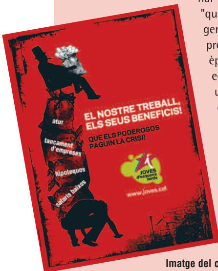
Imatge del cartell editat per JEV

El coordinador nacional de JEV ha conclòs "que no pot ser que la gent jove patíssim la precarietat laboral en època de creixement econòmic i ara, amb una crisi sense precedents, siguem també les persones més afectades i amb les quals la crisi s'acarnissa, especialment si aquests joves són dones i persones migrades".†