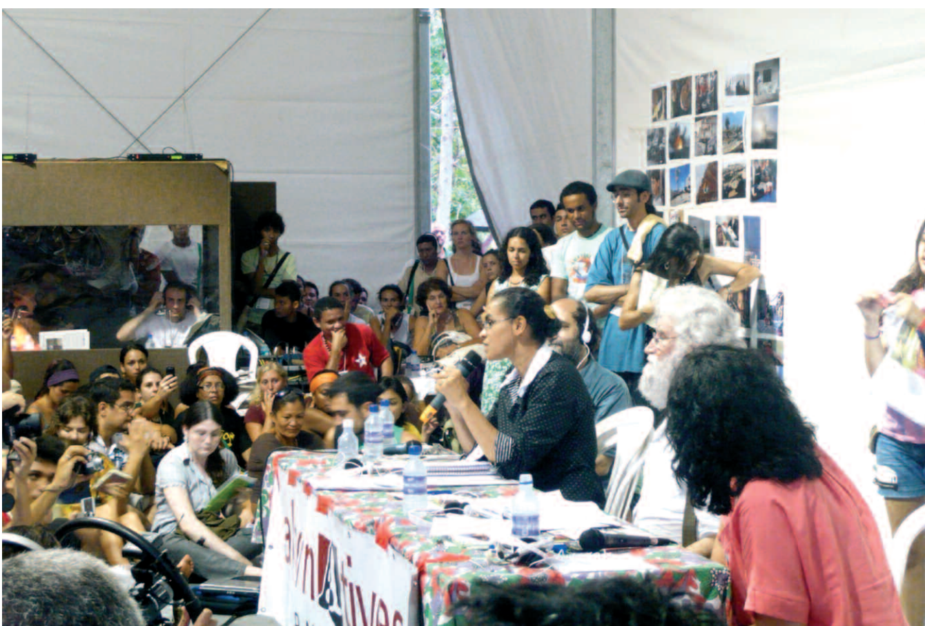
Marina Silva, senadora del PT i defensora del medi ambient al Brasil, a la xerrada sobre la situació de l'Amazònia

És a dir, en el Fòrum es pensa que aquesta profunda crisi no deixarà impassible ningú. Ens endinsem en un període de lluita entre els cada vegada menys privilegiats, aburgatsats, rics i acomodats ciutadans del Nord i milers de milions de persones, iguals en dignitat als anteriors, que exigiran canvis profunds en les seves vides i en els seus governs. El Fòrum ha de fer visibles les exigències dels oblidats pel capitalisme i les seves alternatives al sistema que ens ha portat a la crisi, aquest és el repte al qual s'enfronta els propers anys.†