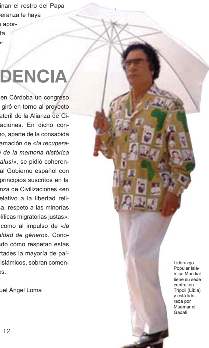
Liderazgo Popular Islámico Mundial tiene su sede central en Trípoli (Libia) y está liderada por Muamar el Gadafi