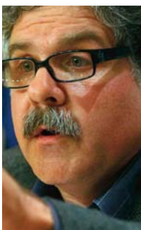
Joan Tardá (Portavoz de ERC en el Congreso)

El artículo 155 de la Carta Magna está "casi concebido para no aplicarse nunca"