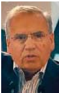
Alfonso Guerra (Presidente de la Comisión Constitucional de los Diputados)

"Si el lehendakari Juan José Ibarretxe convoca finalmente un referéndum, el Estado debe reponer la legalidad a través del artículo 155 de la Constitución".