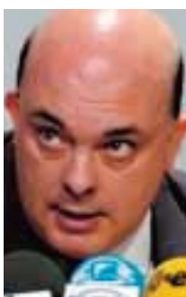
Emilio Olabarria (Portavoz de Interior del PNV en el Congreso)

"No quiero anticipar ninguna medida excepcional. El PNV e Ibarretxe rectificarán cuando vean que los españoles quieren mayoritariamente que gobierne un partido que cree en la Constitución y en el Estado de las Autonomías".