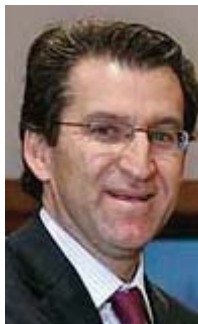
Alberto Núñez-Feijóo (Presidente del Partido Popular de Galicia)

"No creo que sea necesario aplicar el artículo 155 de la Constitución. Esto tan absolutamente convencido de que este desvarío no va a ninguna parte que no creo que hagan falta decisiones extraordinarias como esa. No va allegar el caso de tener que proponer ese tipo de medidas".